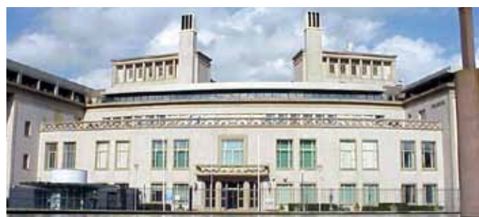
Budova ICTY

- Sljivančanin Review Judgment at the ICTY , 8. prosince 2010, http://dovjacobs.blogspot.com/2010/12/sljivančanin-review-judgment-at-icty.html .