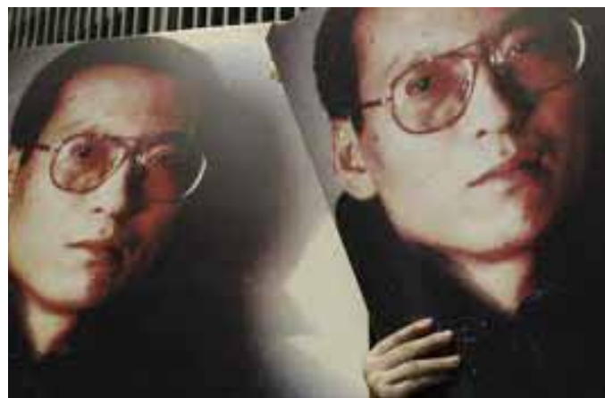
Pakét Liou Siao-Po

Peking v reakci na rozhodnutí Nobelova výboru přistoupil k netradičnímu kroku – zřídil “Konfuciovu cenu míru“, jež má podle oficiálního prohlášení “symbolizovat asijské hod-