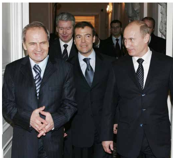
Předseda Ústavního soudu RF Valerij Zorkin (vlevo)