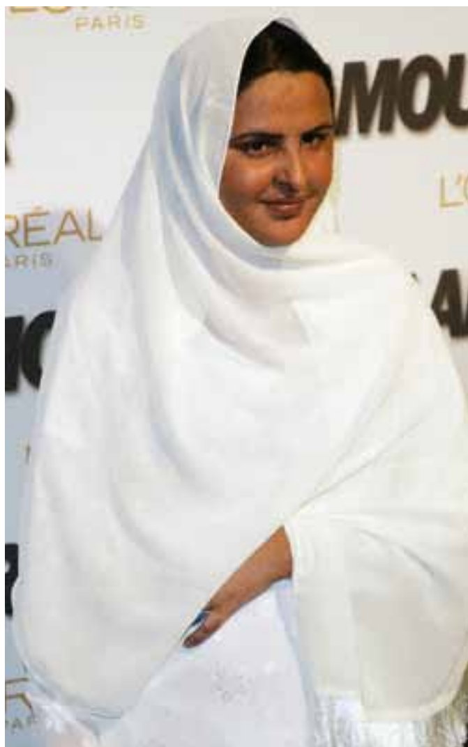
Mukhtār Mā'ī

Mukhtār Mā'ī: Myslím, že som k tejto myšlienke prišla vďaka Bohu. Som naozaj vďačná Bohu za to, že som mohla urobiť