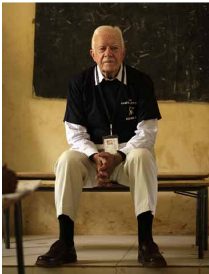
Jimmy Carter v Súdánu, foto: www.theepochtimes.com

V případě sebeurčení jižního Súdánu se nový stát bude muset v první řadě vypořádat nejen s přílivem nových obyvatel, ale zejména se státoprávními otázkami včetně názvu státu, státního občanství, určením hranic a dalšími. Představitelé jihu i severu by se měli v nejbližší době zapojit do jednání o přesném vymezení hranic, očekává se zejména dohoda