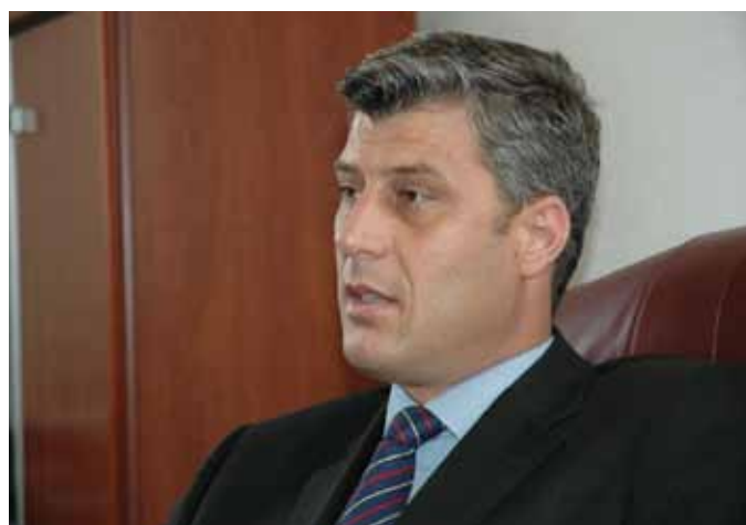
Hashima Thaci

Martyho správa potvrdzuje nielen závery o obchode s ľudskými orgánmi páchanom na niekoľkých stovkách Srbov, ale prináša ďalekosiahlu kritiku pôsobenia UÇK. Spravodajca poukazuje na skutočnosť, že zatiaľ čo zločiny spáchané srbskými silami na etnických Albáncoch boli dôsledne zdokumentované a stíhané, zločiny, ktorých sa dopúšťala opačná strana, medzinárodné spoločenstvo až dosiaľ prehliadalo. Čiernobiele optika uplatnená OSN voči stranám konfliktu usilovala o čo najrýchlejšie obnovenie poriadku v regióne. Tento úmysel však napokon vyústil do jeho destabilizácie a nastolenia selektívnej spravodlivosti, poskytujúcej beztrestnosť vážnym ľudskoprávnym zločinom.