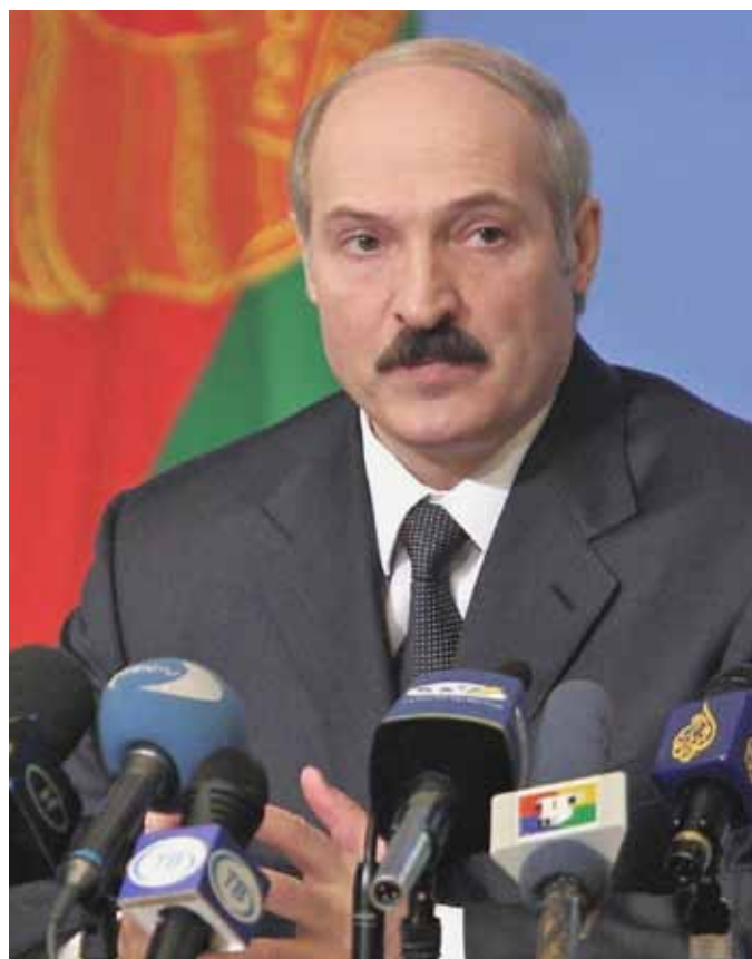
Alexander Lukašenko.

- Wong, E. 2010. Editor Said to Get Life Sentence for Uighur Reports, 24. prosinec 2010, http://www.nytimes.com/2010/12/25/world/asia/25uighur.html?scp=2&sq=uighur&st=cse .