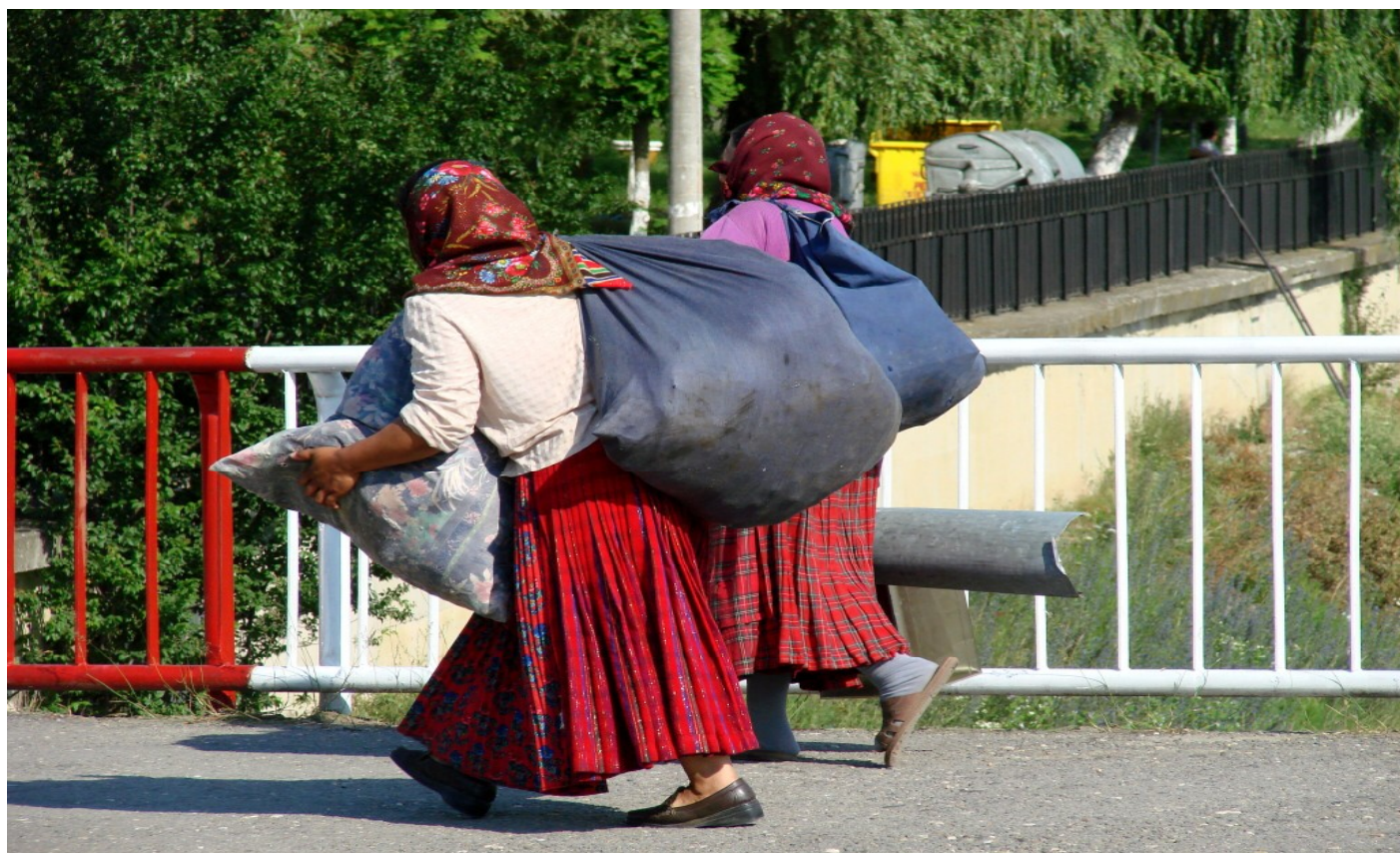
Ilustrativní foto: Romové ve Francii.

[2] URGENT ACTION: Romani families Forcibly evicted IN Rome. Amnesty International [online]. 10.10.2012 [cit. 2012-10-21]. Dostupné z: http://www.amnesty.org/en/library/asset/EUR30/018/2012/en/0ad4bc43-2cae-49ed-95b7-c8a-4b6a75ee0/eur300182012en.html