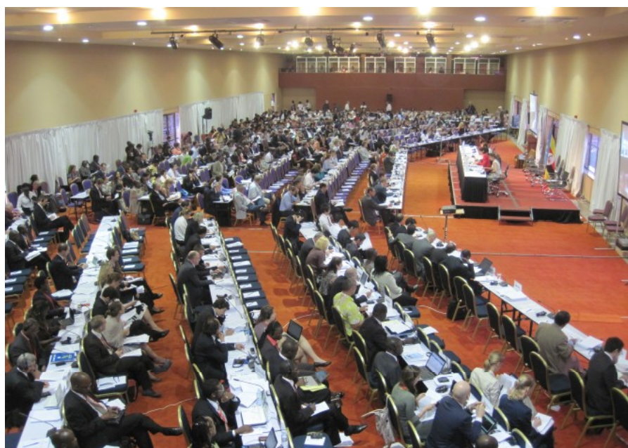
Revizní konference MTS v Kampale, Uganda.

Existenci Soudu však nedoprovází pouze úspěchy, ale též kritika. Týká se především nepružnosti této instituce, délky řízení, neschopnosti dopadnout podezřelé osoby, nedostatku nezávislosti, špatného vedení, financování, apod. Do roku 2012 patřila k hlavním nevyřešeným bodům i otázka jurisdikce. Římský statut totiž vymezoval definice válečných zločinů, genocidy, zločinů proti lidstnosti, chyběla však specifikace zločinu agrese. Problematiku zločinu agrese měla vyřešit Revizní konference v ugandské Kampale, která se konala v červnových dnech roku 2010. Na ní se státy sice shodly na definici zločinu agrese, jež vychází ze známé rezoluce Valného