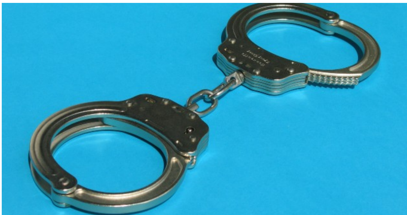
Ilustrační foto.

Značná část lucemburské produkce se tentokrát věnovala problematice evropského zatýkacího rozkazu.[4] V zářijovém rozsudku ve věci C-42/11 Joao Pedro Lopes Da Silva Jorge [5] Soudní dvůr dospěl k závěru, že členský stát nemůže uplatňovat možnost pro odmítnutí výkonu evropského zatýkacího rozkazu výlučně v souvislosti s vlastními státními příslušníky. Rámcové rozhodnutí totiž členským státům umožňuje, aby v situacích, kdy se vyžádaná osoba zdržuje v členském státě, je jeho státním příslušníkem nebo v něm má trvalé bydliště, příslušné justiční orgány rozhodly o tom, že uložený trest musí být vykonán na území tohoto členského státu (čl. 4 bod 6 rámcového rozhodnutí 2002/584/SVV).