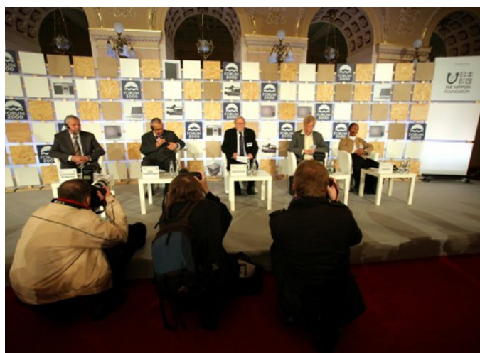
Zahajovací panel v Žofínském paláci.

že nezávislost a profesionalita médií může být zachována, jen nebudou-li závislé na konkrétním zdroji financování, a obhajovala model placení licenčních poplatků ve spojitosti s příjmy z reklam. Marocký aktivista Tarik Nesh Nash zase zdůraznil, že nová média jsou bez těch tradičních docela bezmocná, což doložil na několika příkladech, kdy se zajímavé „elektronické“ občanské projekty rozběhly až poté, co na ně upozornil tradiční tisk. A Nico Carpentier, člen Evropské asociace pro výzkum a vzdělávání v oblasti komunikace, upozornil, že média, přinejmenším ta klasická, nejsou důsledkem stavu společnosti, ale jedním z ovlivňujících faktorů a že jde o elitní systémy propojené s dalšími elitními systémy (politikou, akademií), a nikoliv s komunitami či obyčejnými lidmi[2].