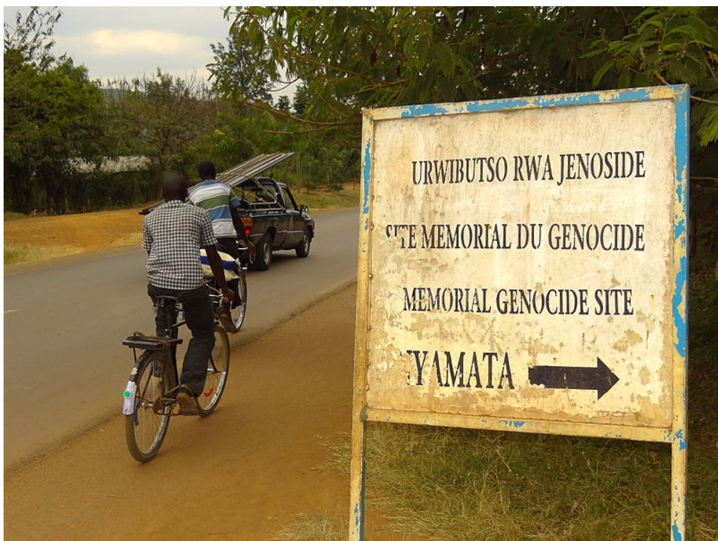
Památka genocidy v regionu Nyamata, Rwanda.