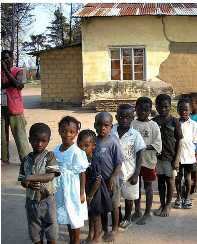
Děti v Demokratické republice Kongo © Ana Coita. Zdroj: http://www.fticr.com

V první řadě, jak udává výroční zpráva, trpíme nedostatkem kvantitativních dat, které mohou sloužit k porovnání případů sexuálního zneužívání napříč zeměmi v celosvětovém měřítku. Nejvíce informací plyne z oblastí, které již mají dlouhodobě nálepkou „nejhorší místo na Zemi pro ženy“. Jmenovitě se jedná o Demokratickou republiku Kongo, Rwandu, Súdán, Sierra Leone a Libérii, tedy země s největším výskytem sexuálního zneužívání žen, největší mediální pozorností a rovněž taky největším počtem neziskových organizací bojujících za práva žen. Jak zpráva tvrdí, s extrémně vysokým číslem případů sexuálního zneužívání tvoří tyto země výjimku z pravidla, nikoliv však normu obecně aplikovatelnou na zbytek probíhajících válečných konfliktů. Množství aktérů, kteří monitorují a poskytují statistické údaje o případech zná-