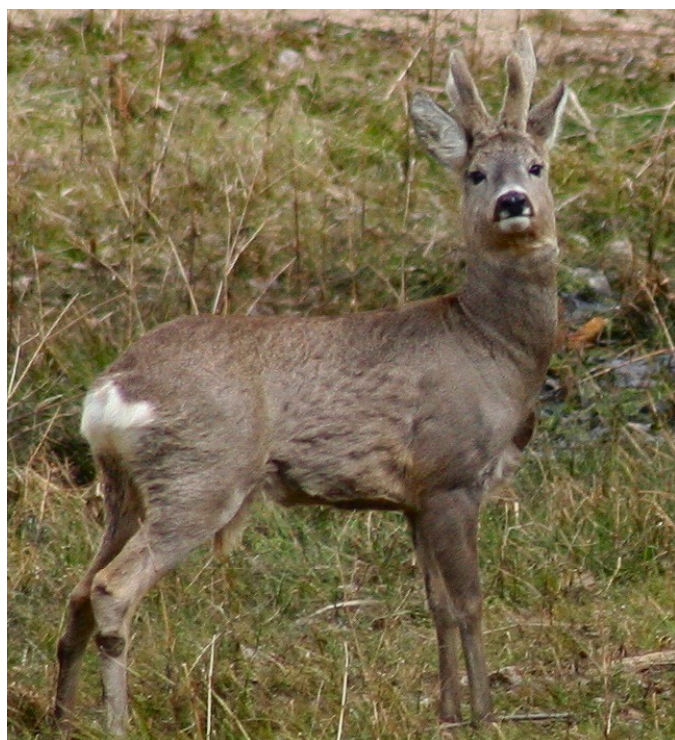
Ilustraci foto.

Pan Chabauty se ke svému zklamání od velkého senátu ESLP dozvěděl, že rozlišování mezi vlastníky malých a velkých honiteb je v souladu s Evropskou úmluvou o lidských právech ( Chabauty proti Francii , stížnost č. 57412/08). Sedmnáctka soudců se jednomyslně shodla, že Francie se nedopustila diskriminace (čl. 14 Úmluvy) ve spojení s právem na ochranu majetku (čl. 1 Protokolu 1). Chabauty vlastní dvě menší parcely o celkové výměře 10 hektarů, které jsou zahrnuty do místní lovecké oblasti. Díky tomu sice nedisponuje exkluzivním loveckým právem na vlastním pozemku, ale na oplátku má právo lovu v celé oblasti. Mezi vlastníky pozemků nicméně dochází k rozlišování, protože ti s většími výměrami mohou jejich zařazení do lovecké oblasti rozporovat, případně požádat o vyjmutí. Od roku 2000 navíc mají stejné možnosti i vlastníci pozemků, kteří pokládají lov za neetický, tentokrát již bez ohledu na výměru pozemku. To však nebyl případ pana Chabautyho, který se své osobní přesvědčení nikterak překrucovat nepokoušel.