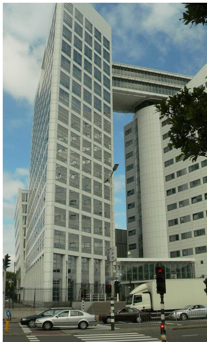
Budova Mezinárodního trestního soudu.

- Samoa ratifies amendments on the crime of aggression and article 8 , [online]. 27.9.2012. ( http://www.icc-cpi.int/NR/exeres/720050E1-B1E3-4558-B02F-983842ADA874.htm ).