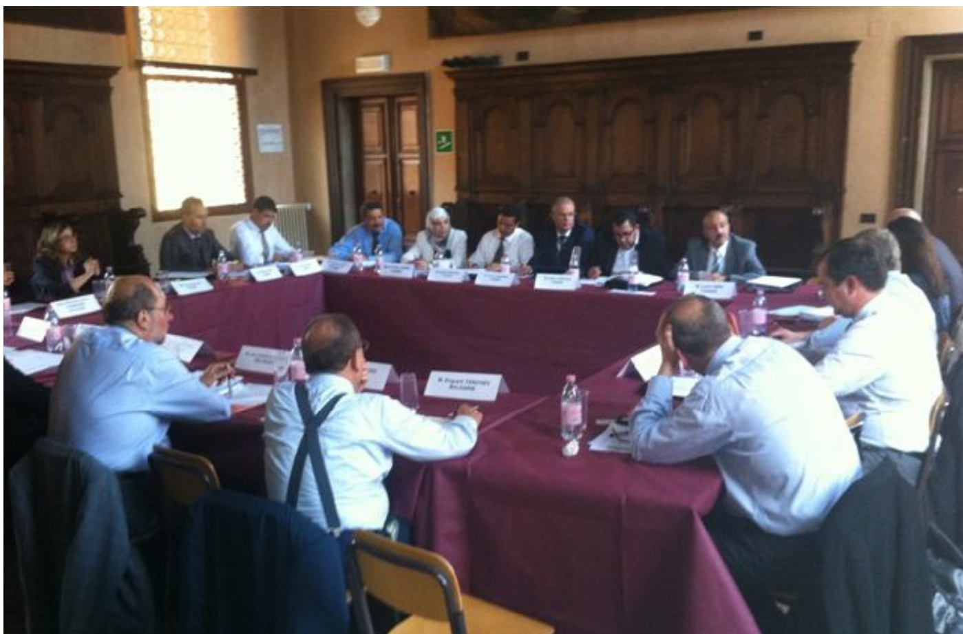
Zasedání Benátské komise.

Diskuse o přípravě tuniské ústavy byla na 92. zasedání Benátské komise bodem klíčovým, nikoli však jediným. V hledáčku Komise se ocitly i další země, konkrétně Ázerbájdžán, Bosna a Hercegovina, Maďarsko a Ukrajina. Tematicky se jednání zabývalo např. svobodou výkonu náboženství, organizací justice nebo modalitami výkonu politického mandátu členů exekutivní moci. (Abecedně) první zemí, na kterou se Komise zaměřila, byl Ázerbájdžán . Stalo se tak v souvislosti s jeho novým Zákonem o svobodě náboženského vyznání, který byl přijat v červnu 2010 a od té doby již stihl projít desítkou novelizací (Opinion 681/2012). Stanovisko Benátské komise, vypracované ve spolupráci s OBSE/ODIHR, se k zákonu postavilo velmi kriticky. Stanovisko upozorňuje mj. na to, že zákon vytváří nadměrně složitou proceduru registrace