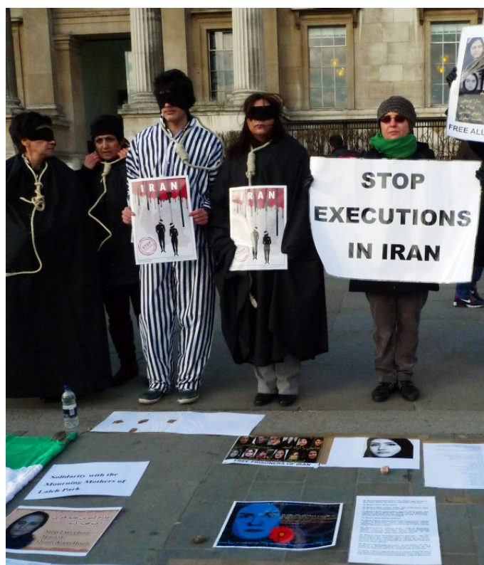
Demonstrace proti popravám v Íránu.

Více než 350stránková zpráva Komise obsahující detailní popisy praktik používaných při výsleších a následných popravách vězňů[2] je dalším krokem na cestě k odhalení minulosti Íránu, kde po svržení Amerikou podporovaného Muhammada Šáha Pahlavího v roce 1979 zavládl teokratický režim. Tak to alespoň vnímají lidé, kteří stáli u zrodu hnutí Íránský tribunál. Hnutí, jehož členy jsou především pozůstalí oběti a íránské emigranti, si klade za cíl prolomit hradbu mlčení o zločinech 80. let vystavenou íránskou vládou a posílenou nemožností mezinárodního společenství Írán k prošetření událostí donutit. Prostředkem k dosažení tohoto cíle pak má být zorganizování kvazisoudního procesu, v rámci nějž se „lidový soud“ složený z významných akademiků a právníků bude