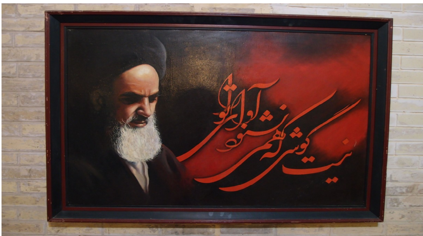
Obrázek ajatolláha sajjída Chomejního.

[4] Právní argumentace bude patrně opřena především o Mezinárodní pakt o občanských a politických právech, který Írán bez výhrady ratifikoval v roce 1975, a o mezinárodní obyčeje.