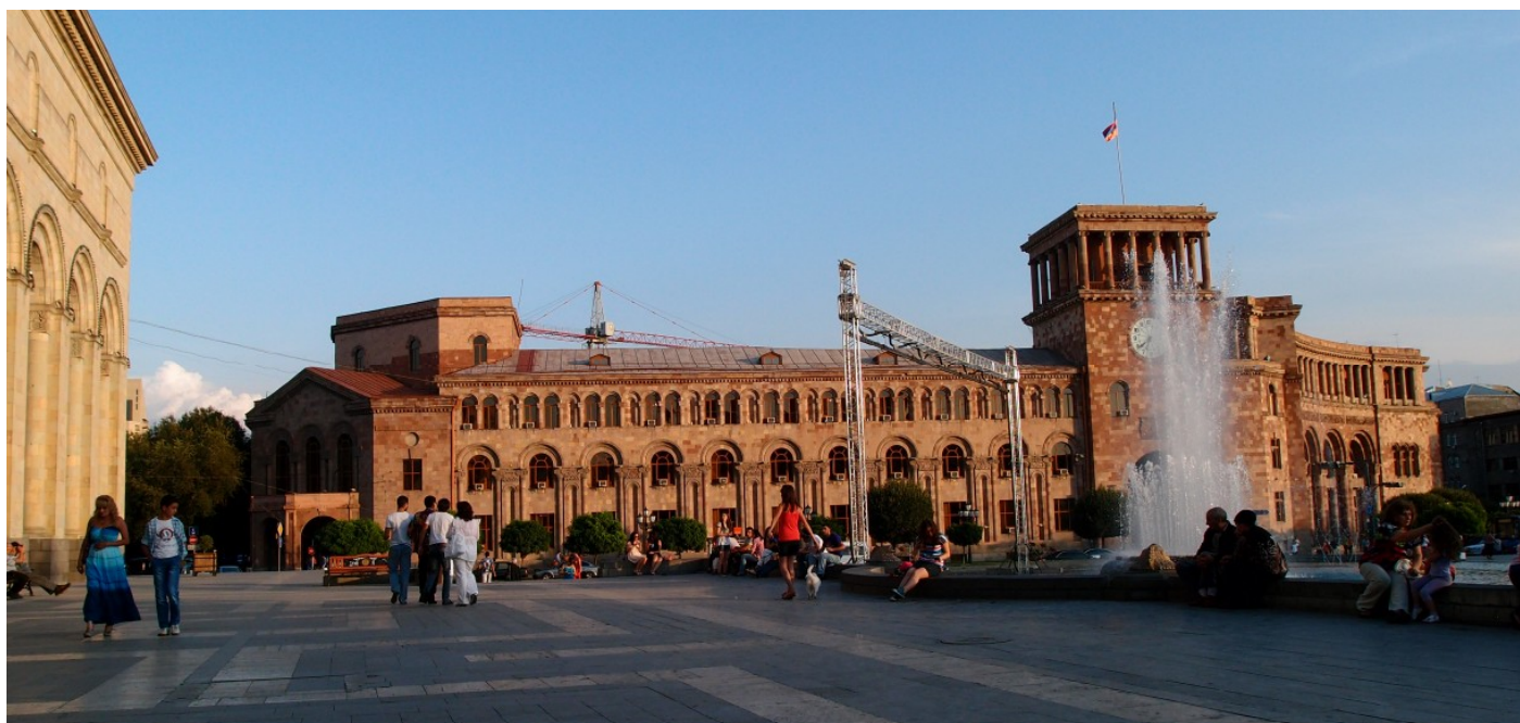
Centrum Jerevanu.