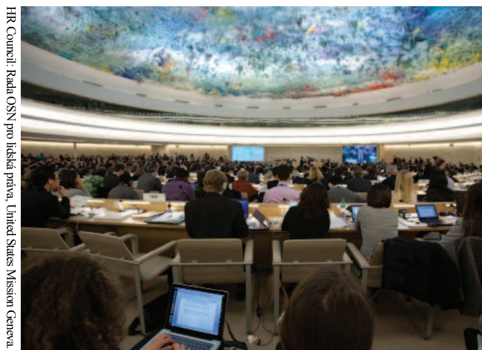
HR Council: Rada OSN pro lidská práva, United States Mission Geneva

Celkově mohu říci, že návštěva jednání Rady OSN pro lidská práva byla zajímavou zkušeností. Z tohoto článku nejspíše vyzněla určitá skepse nad pouhou (až bizarní) formalitou a neefektivností takovýchto setkání. Na druhou stranu ale považuji za příhodné vyslechnout si názory na stav lidských práv v ČR očima zahraničních pozorovatelů, protože pohled zvenjšku může být mnohdy užitečný a inspirativní.