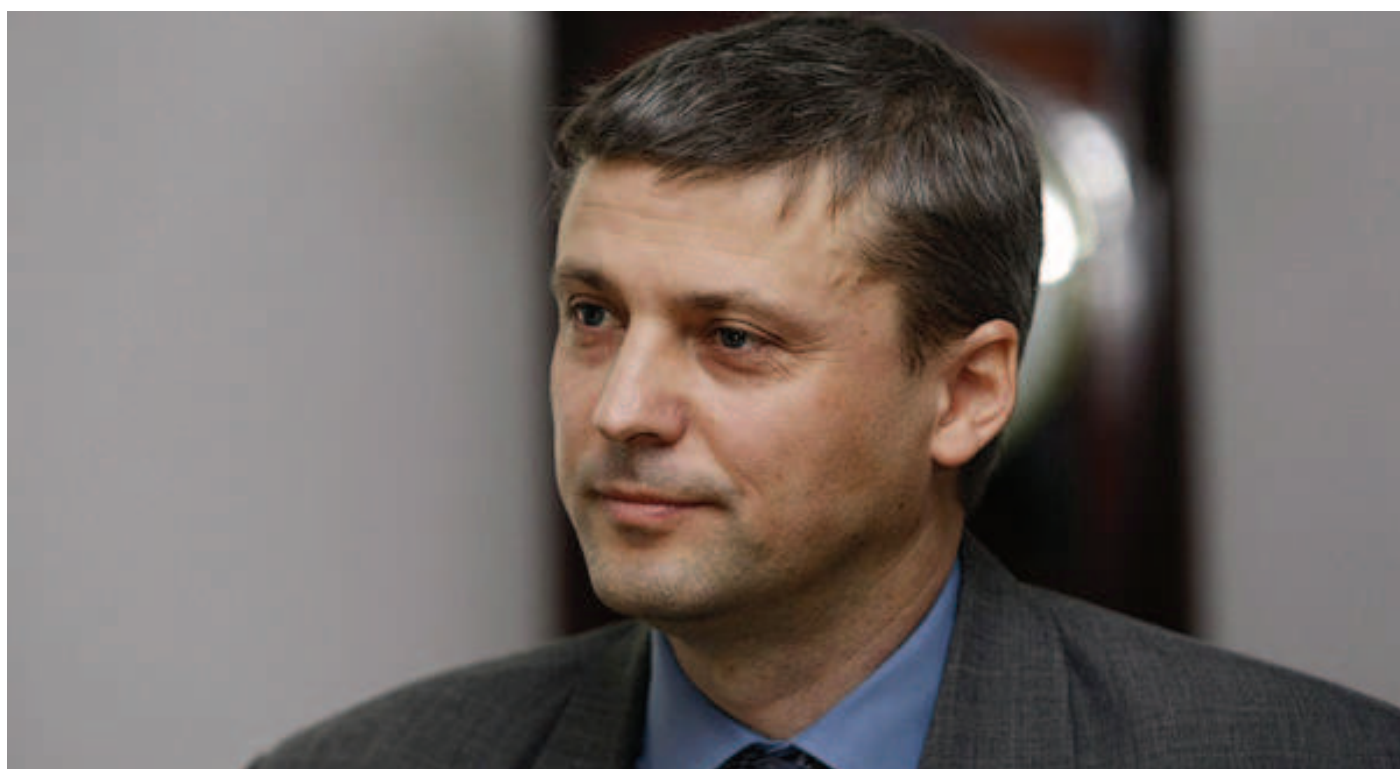
Roman Pekárka; www.rovninky.cz

[1] Bahýlová, L. a kol. Ústava České republiky. Komentář . Praha: Linde, str. 398.