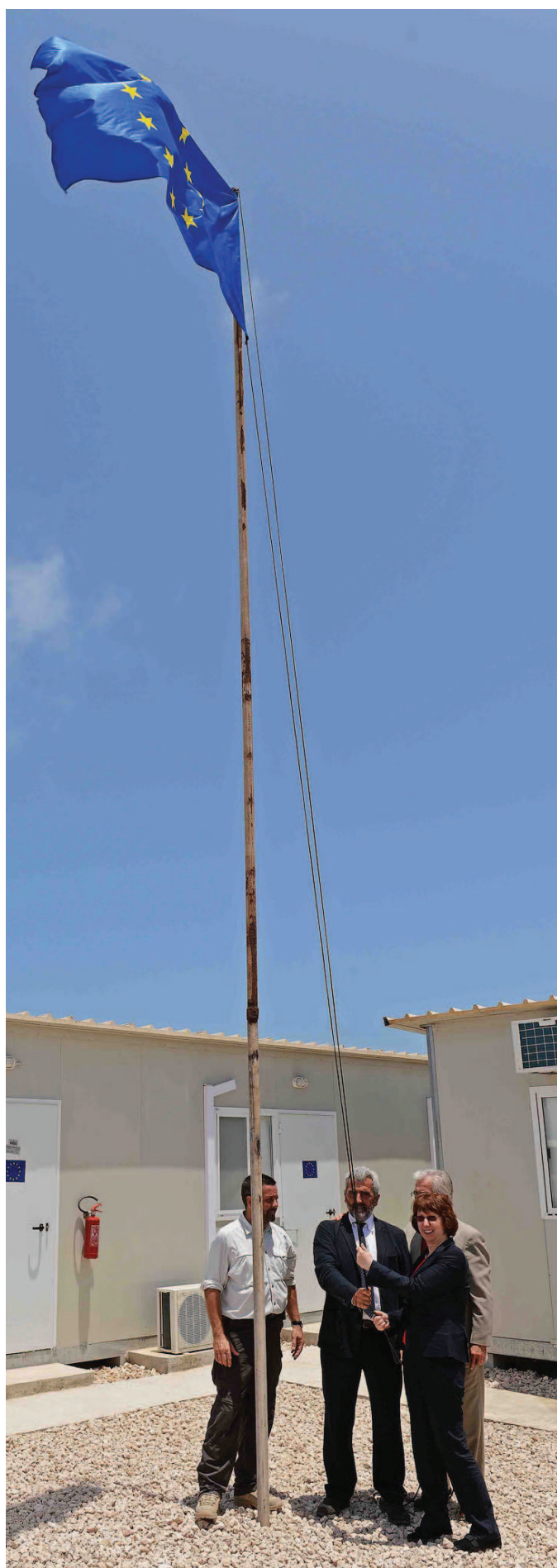
Catherine Ashtonová v Somálsku

Klíčovou roli v nastavení unijního kormidla směrem k vytvoření END sehrála iniciativa pod záštitou polského předsednictví Rady EU. Zejména nevalná lidskoprávní situace v Bělorusku a radikální politické změny v severoafrických zemích v první polovině 2011 přiměly polského ministra zahraničí Radosława Sikorskeho předložit návrh k vytvoření evropské nadace podporující demokratické změny za unijními hranicemi. Ač debata o podobné iniciativě probíhala v bruselských kuloárech již po několik let, nikdy nedostala reálnější obrysy. Zelenou získala až s posvěcením od Catherine Ashtonové, vysoké představitelky pro zahraniční věci a bez-