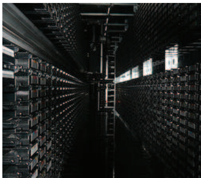
Zasedání Rady v síle lidských práv.

Právo být zapomenut v praxi znamená, že bude možné požádat například o odstranění kompromitující fotografie umístěné na internet v podroušeném stavu a zároveň o její „zapomenutí“ všemi, kdo již fotografii stihli zveřejnit na svých stránkách či profilech. Problematická je však otázka, na kterou upozornil poradce Googlu v oblasti ochrany soukromí Peter Fleischer, tedy zda by měli provozovatelé sociálních sítí mazat inkriminovaný obsah z dalších profilů i bez souhlasu jejich majitelů. Nevyústí to v orwellovské určování budoucnosti skrze vhodné upravnování minulosti? Nebude pro společnosti jedinou technicky dostupnou možností, jak se vyhnout vysokým sankcím, vyhledávání dotyčné osoby či informace pro jistotu zcela zakázat a tedy významně cenzurovat internet? Tyto a další obavy jsou samozřejmě za situace, kdy internet představuje globální úložiště a zdroj informací, jež si už lidé nepovažují za nutné pamatovat, zcela pochopitelné.