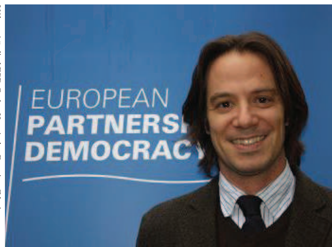
Výkonný ředitel EPPD Carlos Hernández Ferrero.

Možnými příjemci pomoci jsou také samotné vlády, které procházejí bolestmi spojenými s opouštěním minulého režimu směrem k demokratickým základům. Pokud by asistence šla nad rámec tradiční podpory parlamentních a prezidentských voleb, mohla by se END posunout o krok vpřed a financovat také projekty na podporu legislativních a volebních reforem.