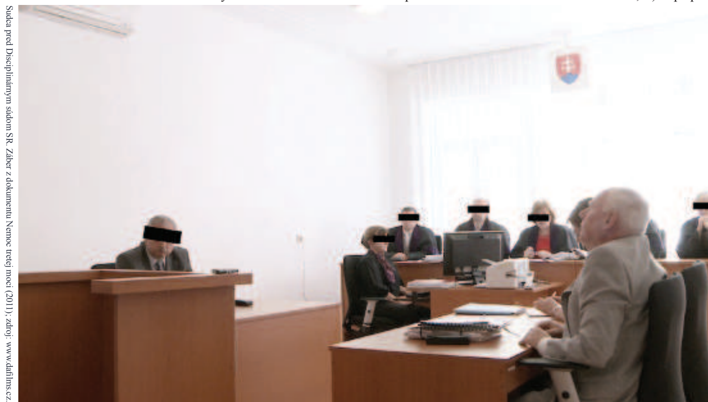
Sudca pred Disciplinárnym súdom SR. Záber z dokumentu Nemoc tretej moci (2011)

Nezáleží na tom, či kritika prostredníctvom karikatúr, článkov, reportáží alebo inej autorskej tvorby mieri na očividné prešľapy sudcov alebo na ich nezávislosť, dôležitou sa javí neschopnosť sebareflexie súdnej moci. Pokým sa sudcovia budú brániť proti akýmkoľvek výrokom na ich adresu, pokým budú umelo vytvárať zdanie ich nezávislosti, spoločnosť zrejme nebude plnohodnotne dôverovať právu a súdom. Usudzujem tak, pretože transparentné a kritike otvorené systémy nepochybne vytvárajú zdanie (a niekedy skutočne aj také sú), že spoločnosť môže otvorene pozorovať a kontrolovať, čo sa deje v zákulisí. Netransparentné a kritiku nereflektujúce systémy neprejavujú snahu o poznanie spoločenskej spätnej vazby a uzatvárajú sa pred ňou. Napokon i z výsledkov prieskumu Eurobarometer 74 plynie, že až 65 % opýtaných respondentov považuje slovenské sudy za nedôveryhodné. V porovnaní s priemernou nedôverou v sudy v členských krajinách EU (48 %) nedôvera v slovenské sudy dosahuje alarmujúcu hodnotu.[10] Dôvera v sudy môže byť zvýšená aj ak: 1) budú sudcovia schopní reflektovať na nich cieľnú kritiku, 2) v prípa-