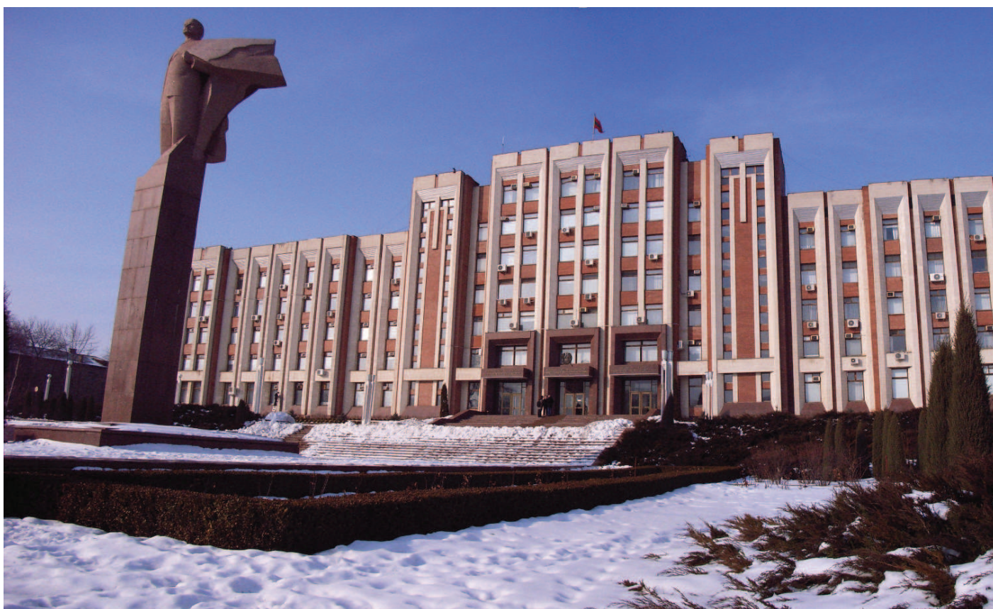
Vládní budova v Tiraspolu, Podněstří; zdroj: Flickr (inzech)

Školáci a jejich rodiče se obrátili na Evropský soud pro lidská práva v prosinci 2004, bohužel trvalo plných osm let, než se dočkali verdiktu. Velký senát se jednomyslně shodnul, že Moldávie se nedopustila porušení práva na vzdělání (čl. 2 Protokolu 1 k Úmluvě), naopak poměrem 16 ku 1 bylo shledáno vinným Rusko, které musí zaplatit každému stěžovateli 6 tisíc eur za nehmotnou újmu a dohromady 50 tisíc eur za náklady řízení. Štrasburský soud již v problému Podněstří rozhodoval v případě Ilaşcu a další proti Moldávii a Rusku , kdy konstatoval, že Podněstří spadá pod moldavskou jurisdikci, protože je součástí jeho území, nicméně vzhledem k ruské vojenské a hospodářské přítomnosti byla zodpovědná i Moskva.