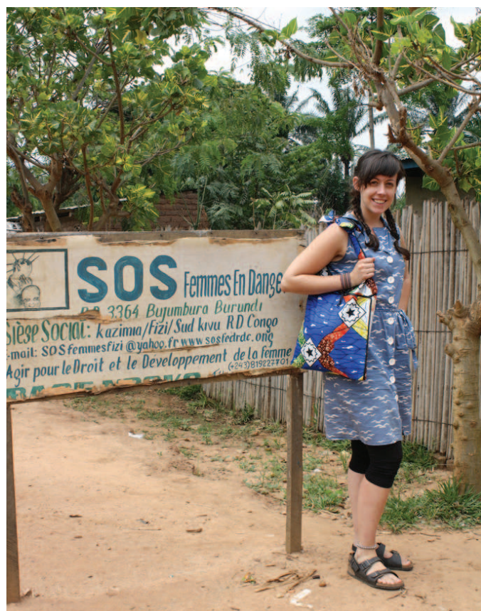
Sídlu projektu AHADI pro pomoc ohroženým ženám v DRK.

Vraždění žen kvůli příslušnosti k jejich pohlaví neboli také femicide či feminicide představuje jednu z forem tzv. gendercide, tedy selektivního masového vyvraž- ďování na základě pohlaví. Jedná se o pojem vytvoře- ný s cílem označit diskriminační a systematické násilí na ženách, které často skončí smrtí. Jako násilné skut- ky páchané na ženách se označují svévolné zadržová- ní; mučení nebo kruté, nelidské či ponižující zacháze- ní nebo trestání; mimosoudní popravy; sexuální násilí, včetně znásilnění, sexuálního zneužívání a pohlavního vykořisťování a jiné formy násilí [1]. Dle zmiňované