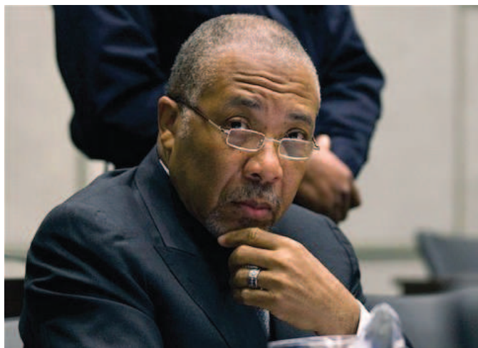
Charles Taylor: Zdroj: www.examiner.com

Ve stanovisku Sowa se jasně odráží dlouhodobé napětí mezi soudci. První vážnější rozpory zřejmě započaly v únoru 2011, kdy se ugandská soudkyně Julia Subetinde odmítla účastnit disciplinárního řízení proti jednomu z hlavních obhájců Taylora – Courtenay Griffithsovi, neboť s tímto postihem nesouhlasila. [2] Náhradní soudce Sow namítal, že po odchodu soudkyně Subetinde z disciplinárního řízení nesplňuje panel (složený ze dvou soudců a jednoho náhradního soudce) podmínky pro své fungování. Předsedající soudkyně nakonec došla k závěru, že Sow nemůže být brán jako plnohodnotný soudce panelu, a proto slyšení odročila. Jenže otázka statusu alternativního soudce Sowa zůstala evidentně nevyřešena, jak je patrné z dalšího vývoje.