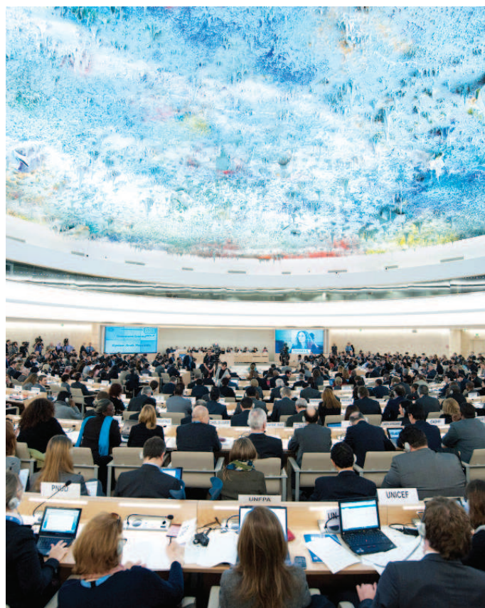
Zasedání Rady v sále lidských práv. Autor: Jean-Marc Ferré Zdroj: UN Photo, www.unmultimedia.org

Amnesty International, Human Rights Watch a další nevládní organizace každoročně vydávají podrobné zprávy o stavu lidských práv v kandidátských zemích a snaží se apelovat na státy, které nesplňují standardy ochrany lid-