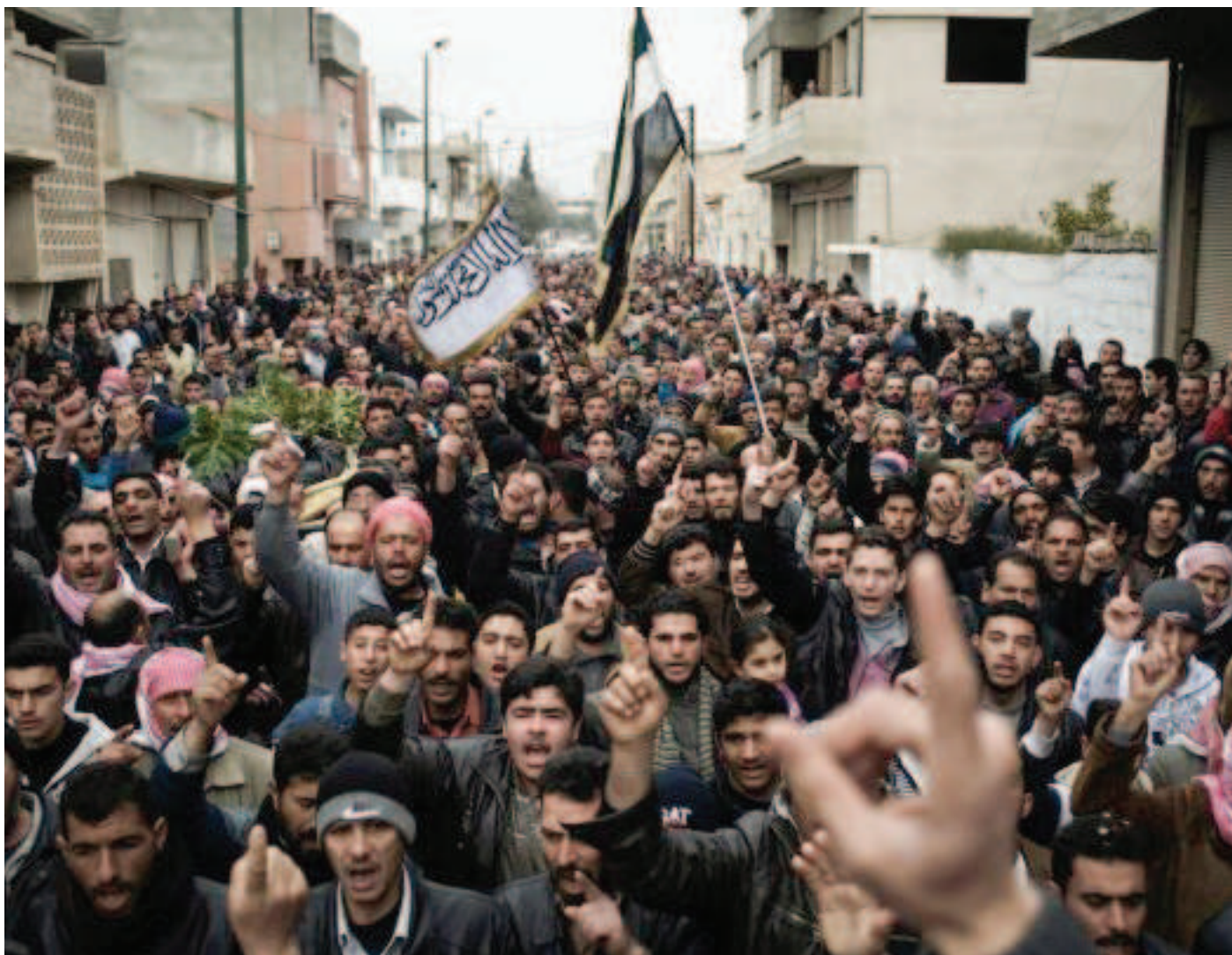
Tisíce lidí se účastní pohřbu v al-Qsair v Sýrii.

V minulých číslech Bulletinu jsme několikrát informovali o situaci v Sýrii, a to především o možném páchání válečných zločinů syrskou armádou či provládními milicemi a nebo o bojích na poli diplomatickém (viz Bulletin 12/2011, 2/2012, 7-8/2012). Na přelomu října a listopadu se ovšem na internetu objevilo video zobrazující (pokud se potvrdí jeho věrohodnost) syrské rebely vraždící provládní ozbrojence, které potvrzuje rostoucí obavy z páchání válečných zločinů i opozicí. Video, které rebelové údajně sami natočili a zveřejnili na internetu, zachycuje skupinu několika povstalců, jak nejprve zajaté vojáky na zemi kopou a pak je všechny se slovy „Allah Akhbar“ zastřelí. Krveprolití se podle všeho odehrálo na vojenském checkpointu Hamcho ve městě Saraqeb na severu Sýrie.