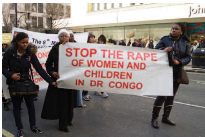
Protest proti násilí na ženách v DRK.

Dle závěrů Rashidy Manjoo vede cesta k ukončení násilí páchaného na ženách skrze proměnu dané společnosti, kultury a tradic. Její návrh vyžaduje řešení založené na úplném dodržování mezinárodních standardů lidských práv. Všechny státy vyzývá k uskutečnění společenské transformace a k zajištění přístupu ke spravedlnosti, v konkrétních případech pak ke stíhání a potrestání trestných činů, jež byly na ženách spáchány, k ochraně obětí a k jejich odškodnění.