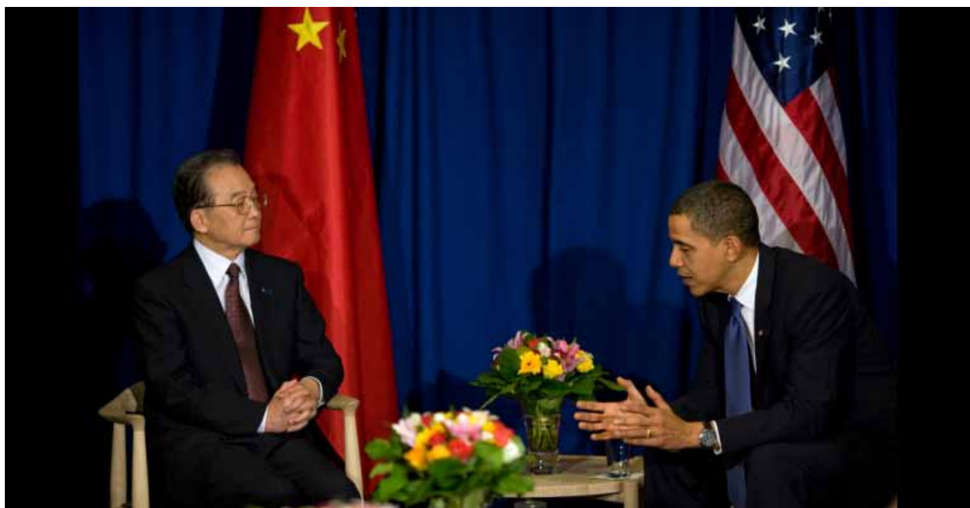
Barack Obama a Wen Jiabao