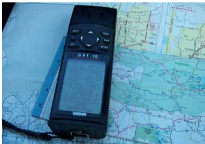
GPS, foto: archiv

Európsky súd pre ľudské práva (ďalej „ESLP“) vydal svoj historicky prvý rozsudok vo veci sledovania podozrivej osoby pomocou globálneho polohového systému GPS. Toto sledovanie je podľa neho primerané. Rozhodnutie z 2. septembra 2010 (sťažnosť č. 35623/05) padlo vo veci Uzun proti Nemecku , v ktorom bol sťažovateľ sledovaný pomocou GPS pre podozrenie zo spoluúčasti na teroristických útokoch.