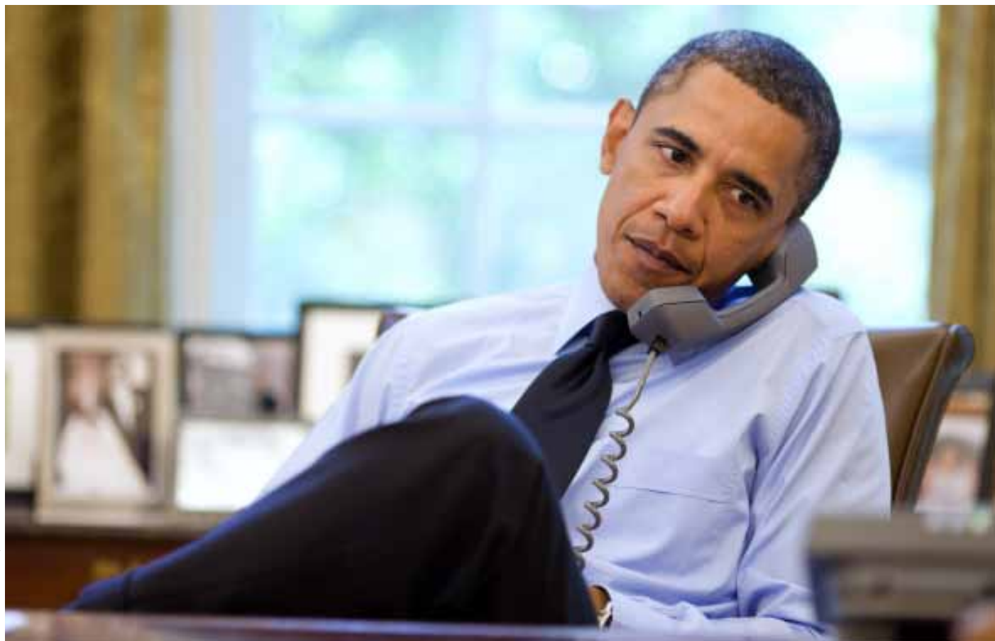
Barack H. Obama

S ohledem na takto silnou pozici USA si Obamova administrativa mohla stanovit v otázce prosazování lidských práv vysoké cíle. Formálně tomu tak skutečně je. Ministryně zahraničí Hillary Clintonová na konci roku 2009 tématu lidských práv věnovala celý svůj proslav na Georgetownské univerzitě ve Washingtonu. V řeči nazvané „Lidskoprávní agenda v 21. století“ představila čtyři body Obamovy politiky v otázkách lidských práv. Zaprvé, principy lidských práv jsou univerzální a všichni, včetně USA, by měli mít zodpovědnost za dodržování těchto principů. Zadruhé, USA se při prosazování lidských práv musí chovat pragmaticky. Zatřetí, USA musí podporovat snahy o změnu vzešlé od občanů a místních komunit. A začtvrté, USA musí rozšířit rozsah ochrany lidských práv. Proslav nenabízí konkrétní politiku, ale výše zmíněné principy ilustruje příklady z poslední doby. Je zdůrazněn tzv. „pricipiální pragmatismus“ v otázce lidských práv, především při jednání s velmocemi jako Čína a Rusko.