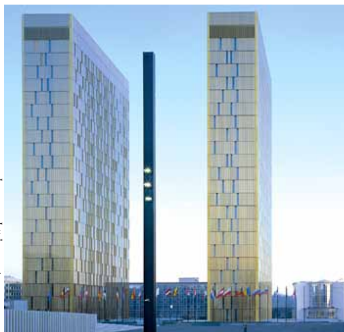
Soudní dvůr EU, foto: http://spfaust.wordpress.com .

Výbor pro Evropskou unii předně dospěl k závěru, že „období líbánek“, tedy období, jež následovalo po východním rozšíření a které přineslo výrazný nárůst počtu soudců, díky němuž se Soudní dvůr EU mohl vypořádat s řadou nedodělků z let minulých, definitivně skončilo (body 40 a 41 zprávy). Výrazná expanze pravomocí Soudního dvora po vstupu Lisabonské smlouvy v platnost, zejména v oblasti prostoru svobody, bezpečnosti a práva, pak podle autorů zprávy znatelně ovlivní schopnost lucemburského soudu nadále zvládat své pracovní zatížení (bod 44). Nejpalcivější je pak situace v případě činnosti Tribunálu, kde podle Výboru pro Evropskou unii bude nezbytné urychleně nalézt zásadní systémové řešení.