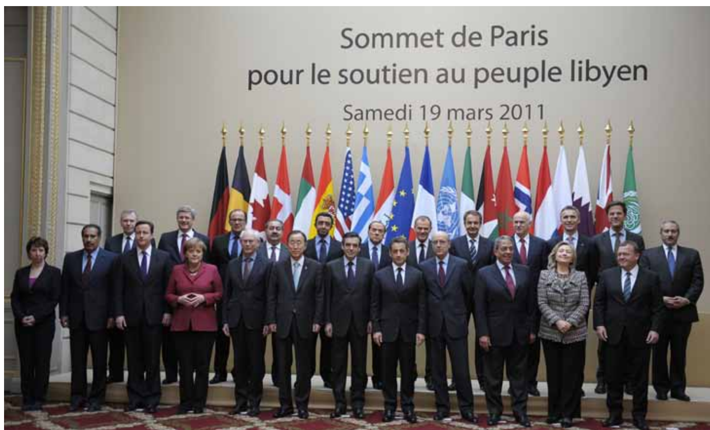
Pařížský summit na podporu obyvatel Libye, foto: Rada EU.

Závěrečné bilancování – všichni ti, kteří tvrdili, že s Lisabonskou smlouvou přichází jakýsi evropský superstrát, si mohou oddychnout. Místo bruselského diktátu se množí komentáře o konci společné zahraniční politiky. Unie bude tak silná, jak jí členské státy dovolí. V oblasti zahraniční politiky se evropské tváře ztrácely a jasně dominovaly tváře národní. Těžko říct, co si třeba v Egyptě myslí, když je navštěvují aktivní mi-