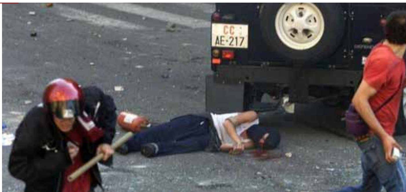
Džíp prešiel telo demonstranta

- Európsky súd pre ľudské práva. 2011. Giuliani a Gaggio proti Taliansku. Sťažnosť č. 23458/02, rozsudok z 24. marca 2011.