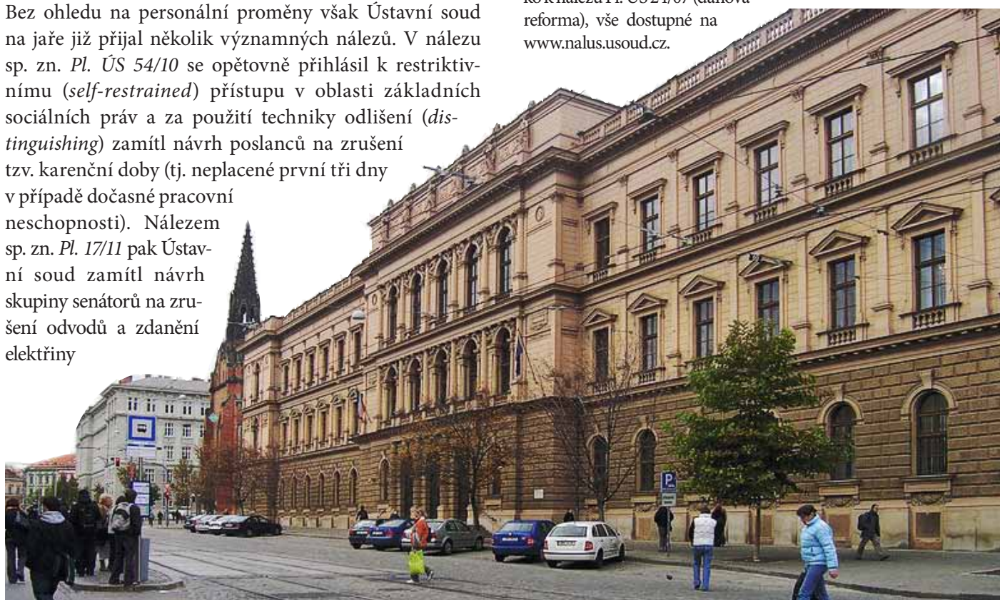
Ústavní soud v Brně

[4] Srov. např. nálezy sp. zn. Pl. ÚS 77/06 (přílepkový) či odlišné stanovisko k nálezu Pl. ÚS 24/07 (daňová reforma), vše dostupné na www.nalus.usoud.cz .