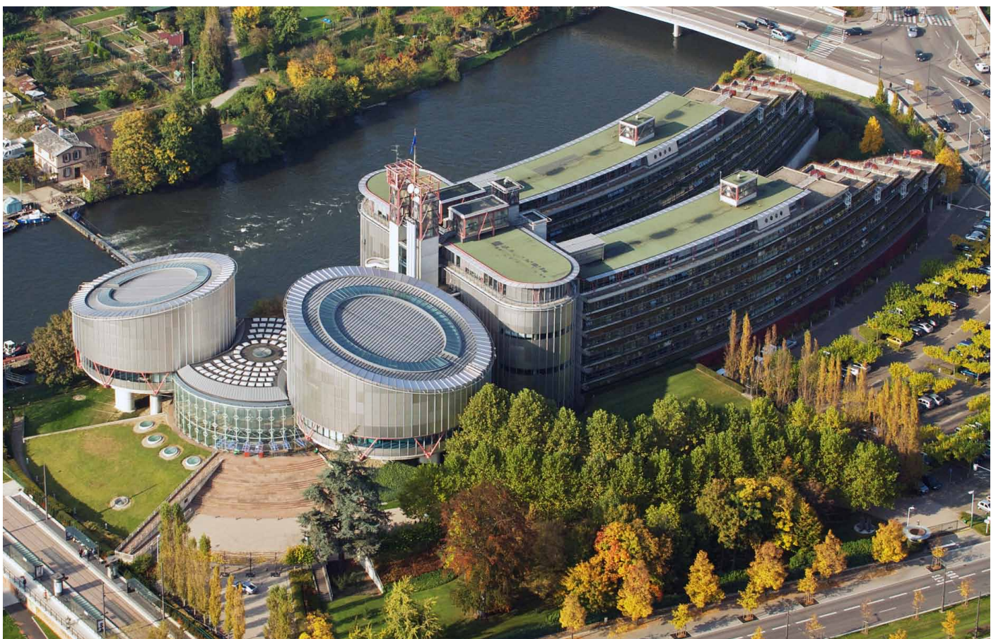
Budova Evropského soudu pro lidská práva