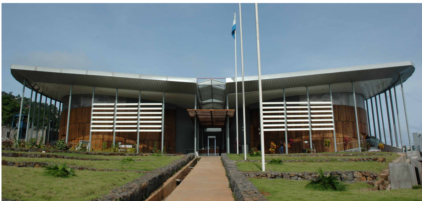
Budova tribunálu Sierra Leone

Zajímavý životní příběh válečného vůdce však tímto neskončil. Zvláštní tribunál pro Sierra Leone totiž Taylora obvinil a exprezidentovi nezbyvalo nic jiného než utéct ze země. Po tři roky nad ním držela ochrannou ruku vláda Nigérie. Poté však na něj Spojené státy vypsal dvoumilionovou odměnu a Interpol vydal zatykač. Na žádost nové liberijské prezidentky Ellen Johnson Sirleafové se ho nigérijská vláda rozhodla vydat. Taylor byl zřejmě varován,