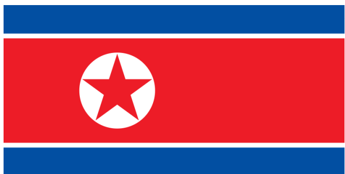
Vlajka Severní Koreje

- Simon Wiesenthal Center: Wiesenthal Center Annual Report Points to Importance of Demjanjuk Conviction as Precedent for the Prosecution in Germany of Additional Nazi War Criminals; Three New Names on Center's Latest Most Wanted List, April 18, 2012 ( http://www.wiesenthal.com/site/apps/nlnet/content2.aspx?c=lsKWlBpJLnF&b=7929811&ct=11716097 ).