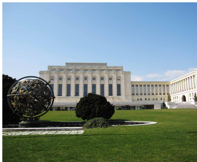
Palais des Nations, Ženeva

Podrobnější informace o stážích v OHCHR naleznete na: www.ohchr.org/EN/AboutUs/Pages/InternshipProgramme.aspx .