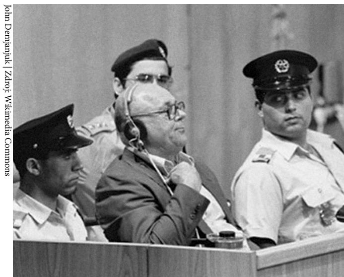
John Demjanjuk | Zdroj: Wikimedia Commons

V polovině března pak zemřel jiný dlouhodobě hledaný nacistický zločinec, John Demjanjuk (rodným jménem Ivan Mykolajovyč Demjaňuk), v loňském roce nepravomocně odsouzený za napomáhání k vraždám více než 28 tisíc Židů ve vyhlazovacím táboře Sobibor. Řízení se Demjanjuk snažil původně vyhnout kvůli špatnému zdravotnímu stavu. Ten se ale neprokázal a před soudem se ze svých činů zodpovídal od listopadu 2009 (Bulletin 5/2011). Po roce a půl nad ním byl vynesen rozsudek. Proti pětiletému trestu, jenž mu byl uložen, se odvolal a s ohledem na vysoký věk zůstal až do rozhodnutí o odvolání na svobodě. Případ je důležitý zejména proto, že stanoví precedens, neboť to bylo poprvé v německé historii, kdy byl nacistický zločinec odsouzen bez konkrétního důkazu či oběti. Tento spor by tak mohl vést k znovuotevření vyšetřování bývalých dozorců v nacistických koncentračních táborech a dalších osob podezřelých z nacistických zločinů.