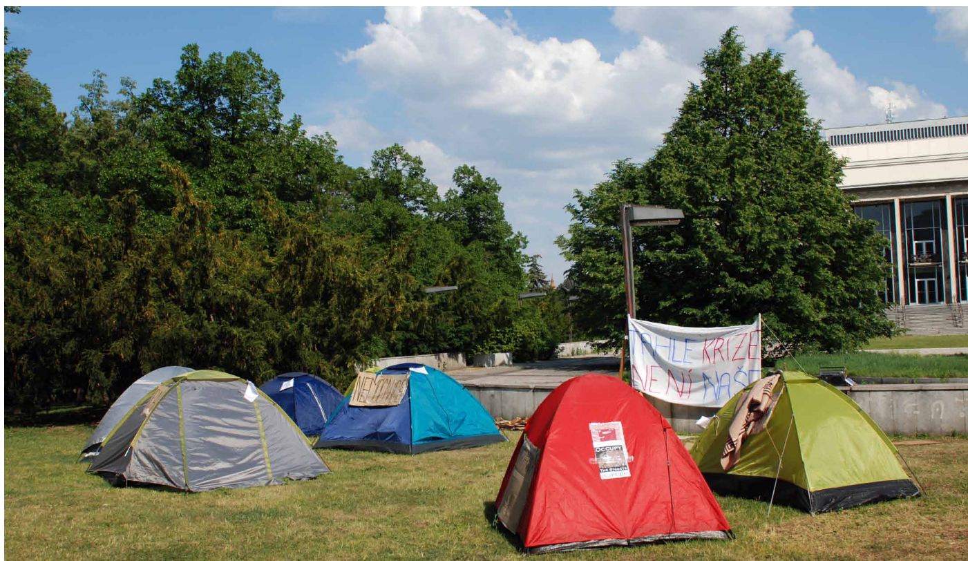
Protestující před Janáčekovým divadlem v Brně

Samotní protestující podle svých slov nenabízejí jediné „správné“ řešení či alternativu. Do jejich diskuze se aktivně připojil i kolemjdoucí, který „prezentoval nápad vytvořit občanskou skupinu, která by monitorovala nakládání s veřejnými financemi v Brně s cílem ztížit korupci“. Přes všechny pochybnosti o možnosti vymýcení korupce, považuje Strmiska nápad za vyústění jejich snahy podnitit