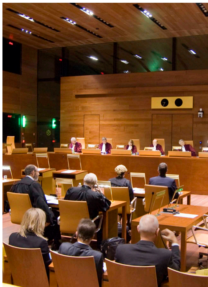
Jednání Soudního dvora

Další zajímavá předběžná otázka byla podána ve věci C-396/11 Radu , která se týká evropského zatýkacího rozkazu a čl. 48 Listiny stanovícího presumpci nevinu a právo na obhajobu. Rovněž v tomto případě se bude ochota Soudního dvora zodpovědět jednotlivé otázky odvíjet od toho, nakolik budou nacházet odůvodnění ve skutkovém stavu věci samé. Předběžná otázka rumunského soudce díky svému obsahu osciluje mezi zjevnou nepřipustností z důvodu své vágnosti a velkým senátem z důvodu své závažnosti. Rumunský soudce v podstatě zpochybňuje základní principy, na nichž rámcové rozhodnutí o evropském zatýkacím rozkazu stojí. Obdobné problematiky se týká rovněž španělská věc C-399/11 Melloni .