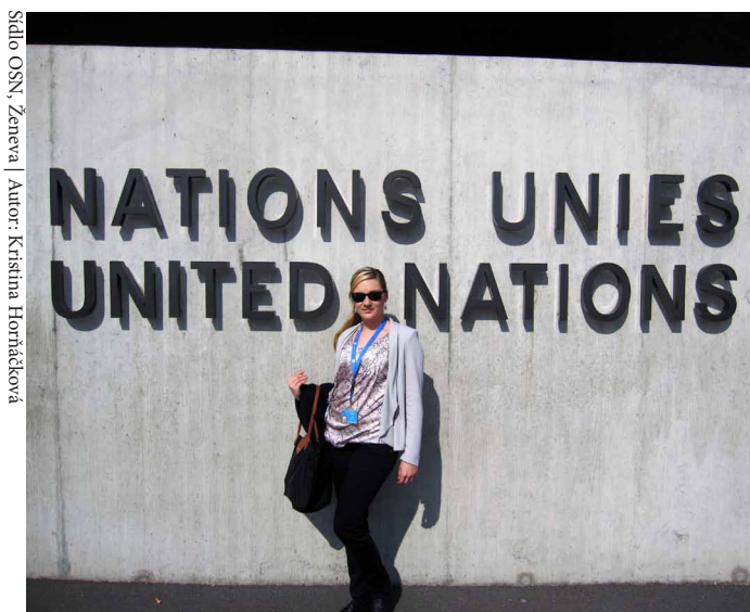
Sídlo OSN, Ženeva | Autor: Kristina Hornáčková

Po prvním setkání se supervizorem a vstupním pohovoru, který by měl vyústit ve vytvoření plánu stáže, je každý