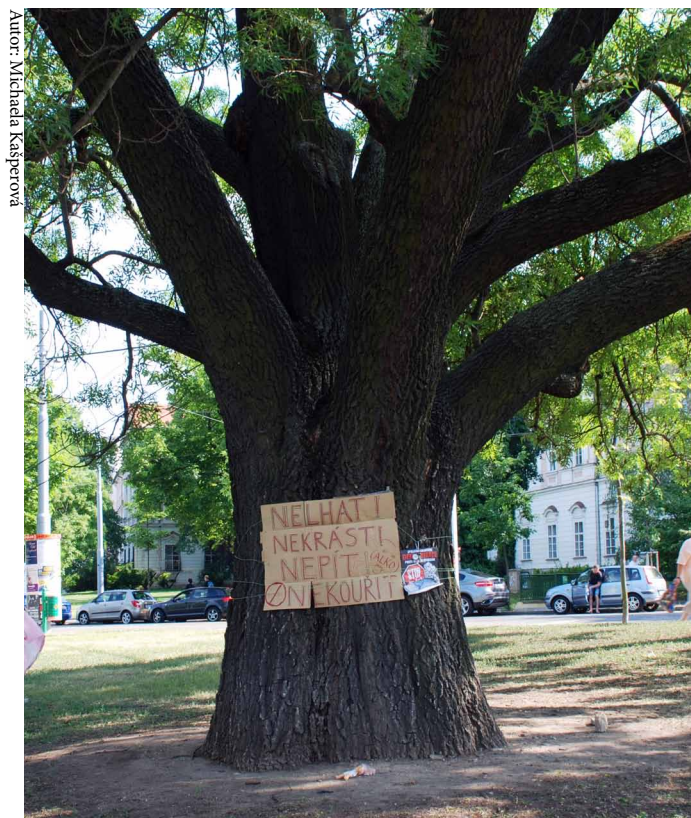
Autor: Michaela Kašperová

v lidech úsilí se svou nespokojeností něco dělat. Protestující však podle jeho slov nepovažují za pravděpodobné, že by postavení několika stanů ihned vyvolalo reakci politické reprezentace.