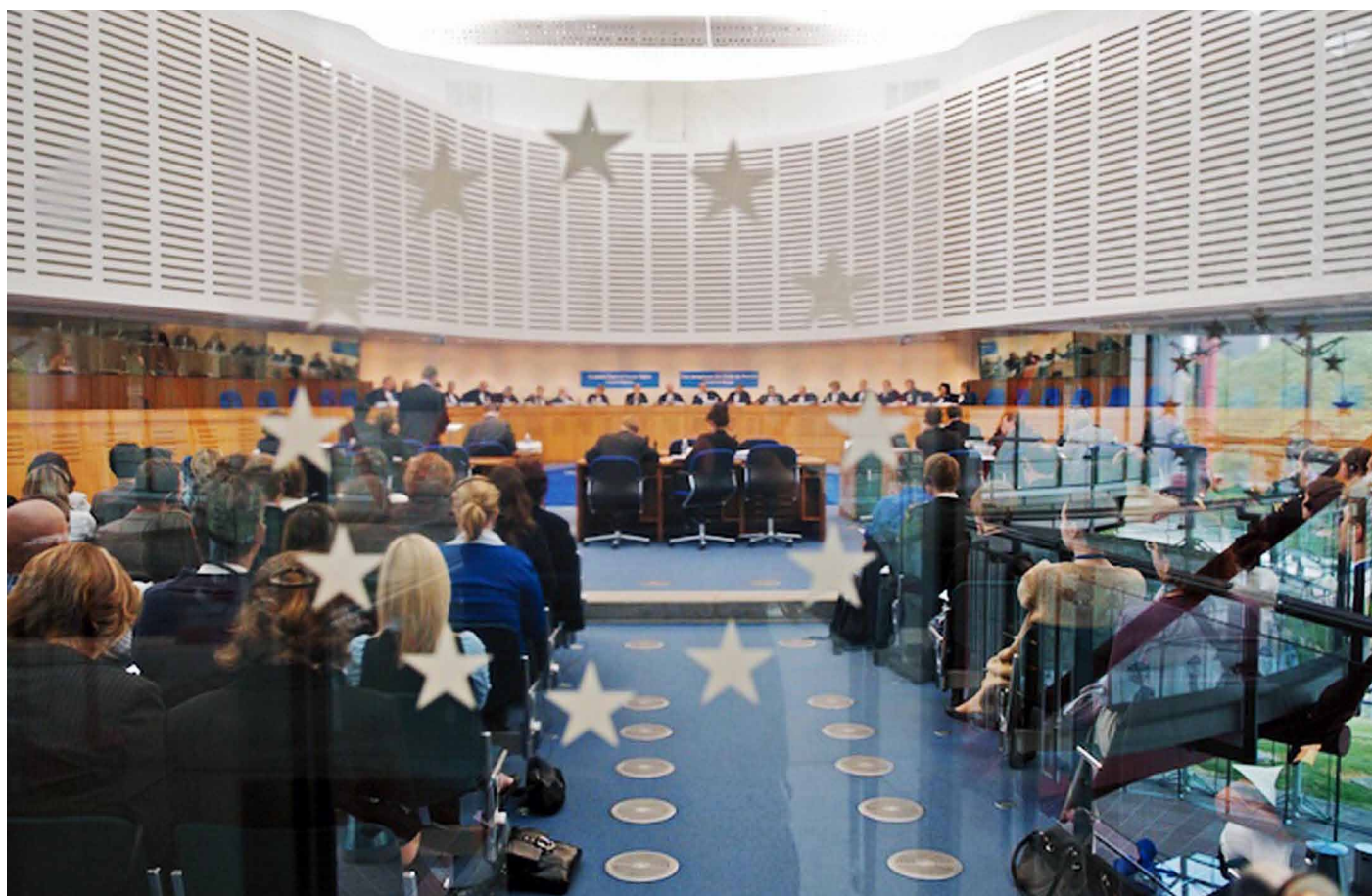
Soudní místnost ESČP

Po letech beze změny až Evropský soud pro lidská práva seznal porušení jejich svobody projevu (čl. 10 Evropské úmluvy). Kritiku směřoval také proti Rumunsku v tom smyslu, že měl projevit větší účast a poskytnout větší součinnost snaze stěžovatelů domoci se pravomocným rozsudkem přiznaného práva. Stát má nejen povinnost respektovat svobodu projevu jednotlivců (většinou vůči státu), ale musí být schopen vytvořit navíc takový systém ochrany svobody, který bude účinný mezi jednotlivci navzájem. V konkrétním rumunském případě navíc soud poukázal na neschopnost státu chránit nezávislost médií vůči ekonomickým a politickým tlakům, jejichž existence je evidentní.