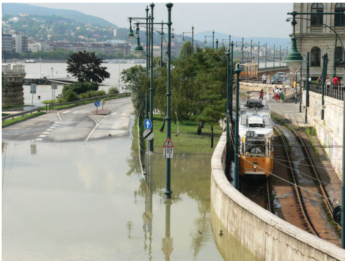
Budapešti tečú do bot. Autor: Hubert Snekal.

[18] KOMÁREK, Jan. Může Evropská unie zasáhnout proti Maďarsku? Blog Jiné právo, 25. marec 2013 ( http://jine-pravo.blogspot.cz/2013/03/muze-evropska-unie-zasahnout-proti.html ).