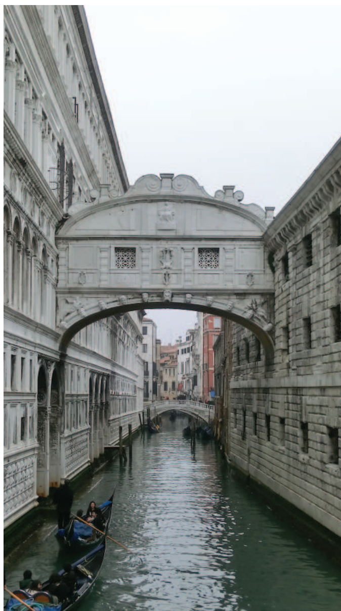
Benátky, foto: Veronika Bílková

Amicus curiae ( Opinion 697/2012 ), na jehož vypracování se podílela i česká členská Benátské komise Veronika Bílková, konstatuje, že zákon č. 192/2012 Sb. porušuje svobodu slova a svobodu shromažďování, které je Moldávie povinna garantovat na základě Evropské úmluvy o ochraně lidských práv (i dalších instrumentů). Evropská úmluva obecně státům nezne-