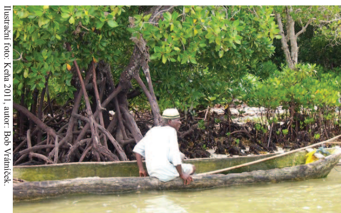
Ilustrace foto: Keňa 2011, autor: Bob Vrátníček

Výše zmíněná kritika není jediným problémem, s nímž je třeba se vyrovnat. Výsledek řízení tak bude záležet nejen na tom, jak se k dané věci postaví MTS, ale také na schopnosti obžaloby vypořádat se s těžkostmi, jež „keňské případy“ provází a prokázat u obviněných vinu nade vše pochybnost. Zatím se to jako příliš snadný úkol nejeví.