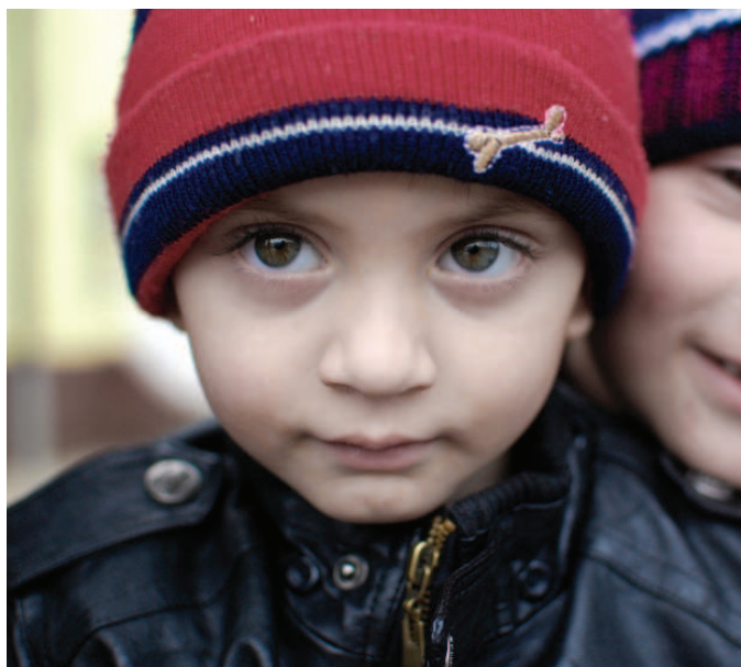
Ilustraci foto. Zdroj: www.commons.wikimedia.org.

Evropský soud pro lidská práva konstatoval, že snaha vlády snížit disparitní rozdíly mezi romskými a neromskými dětmi je plně v souladu s mírou uvážení, kterou státům Úmluva v rámci článku 14 garantuje, nicméně nesmí vést k diskriminační praxi. ESLP uznal komplikovanou situaci v případě řecké vesnice, kritizoval však nedostatek aktivity a zájmu na straně státních orgánů, jež se nesnažily situaci dostatečně ře-