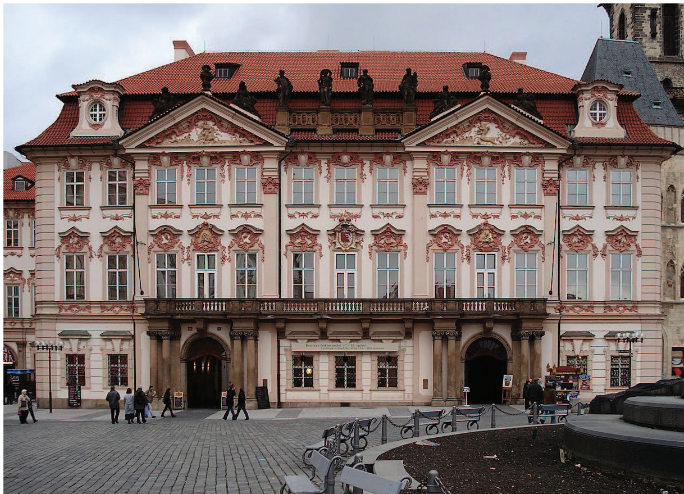
Palác Kinských – jedna z nemovitostí, o kterou se vede spor.