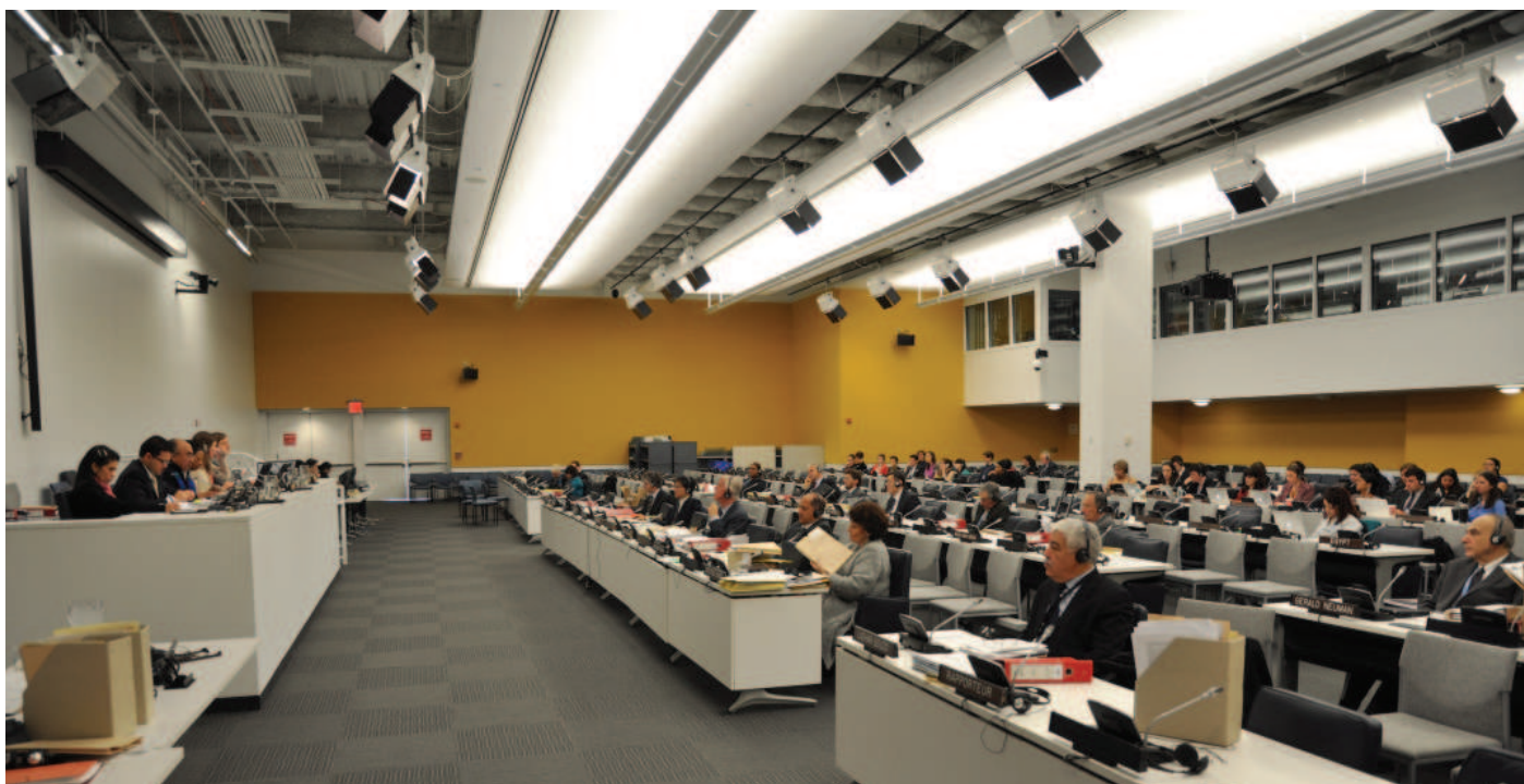
Jednání Výboru pro lidská práva.

Druhou ze základních pravomocí výborů je hodnocení individuálních stížností ( communications ). Tak jako v případě štrasburského soudu může být stížnost jednotlivce projednána až po vyčerpání vnitrostátních opravných prostředků. Výbory však mohou vydat pouze rozhodnutí ve formě názoru ( view ). To není z formálního hlediska právně závazné, a tak není divu, že státy tyto závěry smluvních výborů ve vy-