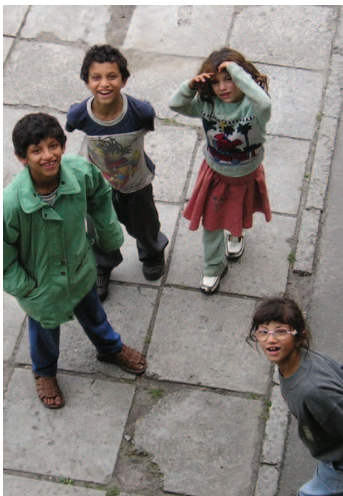
Ilustrace foto, Zdroj: www.commonswiki.org

zdůraznil, že státy mají v oblasti organizace veřejného vzdělávání pozitivní závazek zajistit dodržování lidských práv a zabránit přetrvávání diskriminace a diskriminujících praktik, byť ukrytých v podobě na první pohled neutrálních testů. Stát musí zajistit, aby tyto testy spravedlivě a objektivně odpovídaly skutečným znalostem a schopnostem dětí (odst. 106–107). Příklad rovněž potvrzuje praxi využívání statistického důkazu jako vhodného prostředku na zjištění přítomnosti diskriminační praxe a obrácení důkazního břemene na stranu vlády, proti níž je stížnost podána.