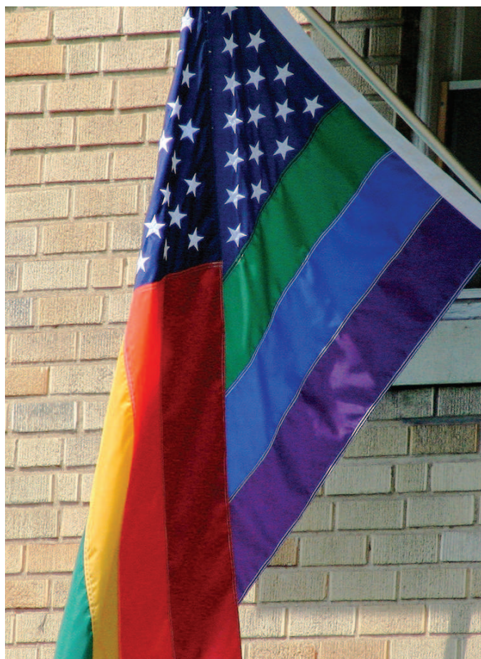
Ilustraci foto: duhová vlajka.

Klíčovou roli v případě X a ostatní sehrála jednak poměrně ojedinělá právní úprava osvojení v Rakousku a jednak precizní a vyargumentovaný výběr komparátora. Ojedinělost právní úpravy osvojení spočívá v tom, že Rakousko jako jeden z mála států Evropy umožňuje osvojení dítěte partnera/partnerky nesezdaným párům, a to výlučně v rámci párů opačného pohlaví. Nachází se tak ve skupině pěti států Rady Evropy, které mají takovouto právní úpravu.[3] Jádrem případu je námitka stěžovatelů, že takováto právní úprava je diskriminační ve vztahu k nesezdaným párům stejného pohlaví , kterým je přístup k osvojení odepřen. Komparátorem pro situaci nesezdaného stejnopohlavního páru v případě X a ostatní tedy není heterosexuální manželská dvojice, ale nesezdaný heterosexuální pár.[4] Stěžovatelé takto uznávají ustálenou judikaturu Soudu, která například v posledním rozsudku Gas a Dubois [5] potvrdila výsadní postavení manželství, jehož ochrana plyne z čl. 12 úmluvy, a to i v souvislos-