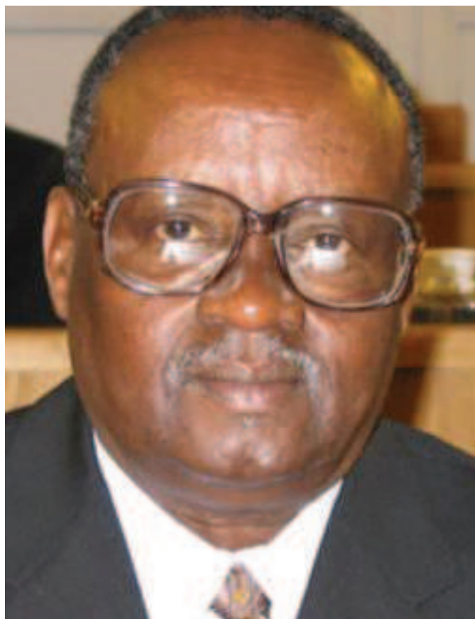
Justin Mugenzi.

V roce 2011 byli oba senátem prvního stupně odsouzeni ke 30 letům vězení za napomáhání a podněcování ke spáchání zločinu genocidy na základě konceptu společného zločineckého plánu. Tribunál je shledal vinnými, neboť se v roce 1994 účastnili schůze, na níž se přijalo rozhodnutí o odvolání tutsijského prefekta provincie Butare Jean-Baptiste Habyarimana, jenž v oblasti bránil provádění masakrů Tutsijů. Kromě toho se oba politici následně zúčastnili veřejného vystoupení prozatímního prezidenta Theodora Sindikubwaba [1] dne 19. dubna 1994, který v něm pobízel obyvatele Rwandy k vraždění Tutsijů. Podle obžaloby Mugenzi a Mugiraneza nesli zodpovědnost za podněcování ke spáchání genocidy, když svou účastí na mítinku podpořili (byť tacitně) prezidentův štvavý projev.