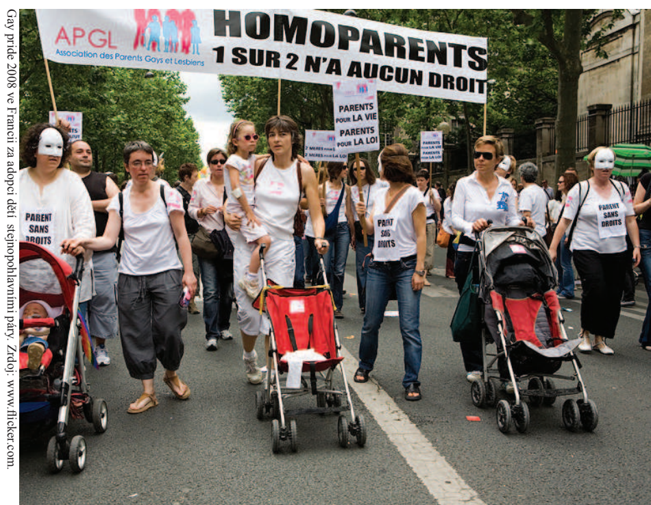
Gay pride 2008 ve Francii za adoptí dětí stejnopohlavními páry.

[16] Společné částečně disentanční stanovisko soudců Casadevall, Ziemele, Kovler, Jočiené, Šikuta, De Gaetano a Sicilianos.