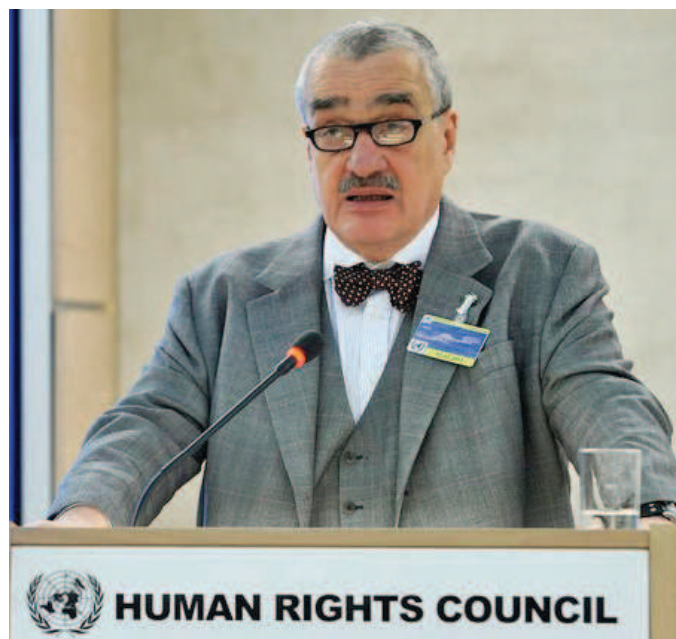
Karel Schwarzenberg na zasedání Rady.

Autorka tohoto textu se celého zasedání Rady v Ženevě účastnila v rámci své stáže v Kanceláři Vysoké komisařky OSN pro lidská práva.