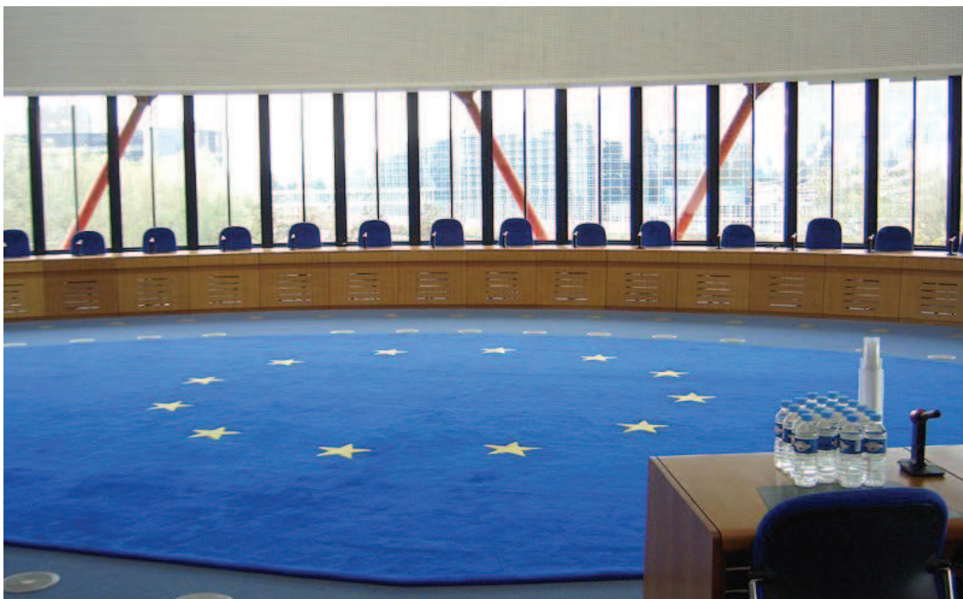
Exterior: ECHR.