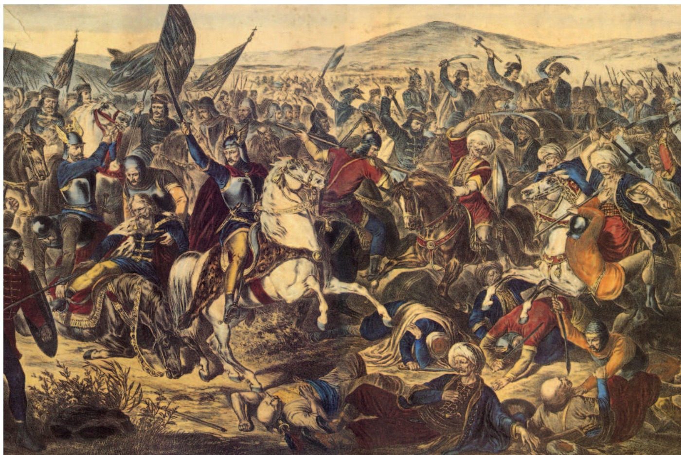
Bíva o Kosovo (1389).

Generální advokát, opíraje se zejména o čl. 47 Listiny, který stanoví právo na účinnou soudní ochranu, dospěl k závěru, že dvouměsíční lhůta měla plynout nikoliv od okamžiku, kdy byly sporné akty zveřejněny v Úředním věstníku EU, nýbrž od okamžiku, kdy se žalobci o jejich přijetí dozvěděli. Jak uvedl generální advokát, právní akty zveřejňované v Úředním věstníku EU nejsou zamýšleny k vyhlášení urbi et orbi , a proto je domněnka jejich znalosti u osob mimo EU problematická. Neomluvenou absencí na veřejném jednání zapříčiněnou zástupci navrhovatelů generální advokát překvapivě navrhnul nepřičítat žalobcům k tíži, neboť by tím mohla být způsobena závažná újma na jejich právech, a vyslovil se pro zrušení usnesení Tribunálu. Velký senát Soudního dvora nicméně již tak benevolentní nebyl. Ačkoliv dospěl ke stejnému