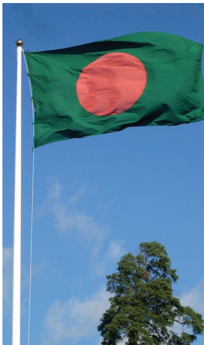
Vlajka Bangladéše.