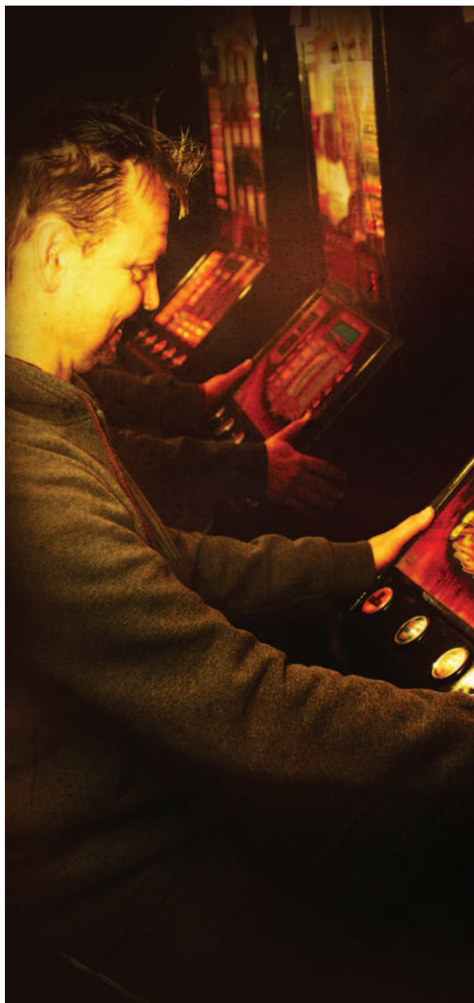
Ilustrační foto: Hazard.

Odvrácenou stranou rušení hazardu v obcích jsou ovšem značné dopady na obecní rozpočty. Na některých místech České republiky tak dochází k zpětnému navracení výherních automatů do obcí a měst (např. Děčín), neboť příjem plynoucí z těchto zařízení chybí nejen v rozpočtech příslušných podniků provozujících herny, ale rovněž v obecních kasách, které z nich běžně poskytují finanční prostředky na kulturní a sportovní akce. Boj s hazardem v ČR tak stále není uzavřenou kapitolou a rozhodnutí nyní leží na bedrech obecních zastupitelstev a jejich volby, jakou cestou budou obce ochotny se při svém budoucím rozvoji vydat.