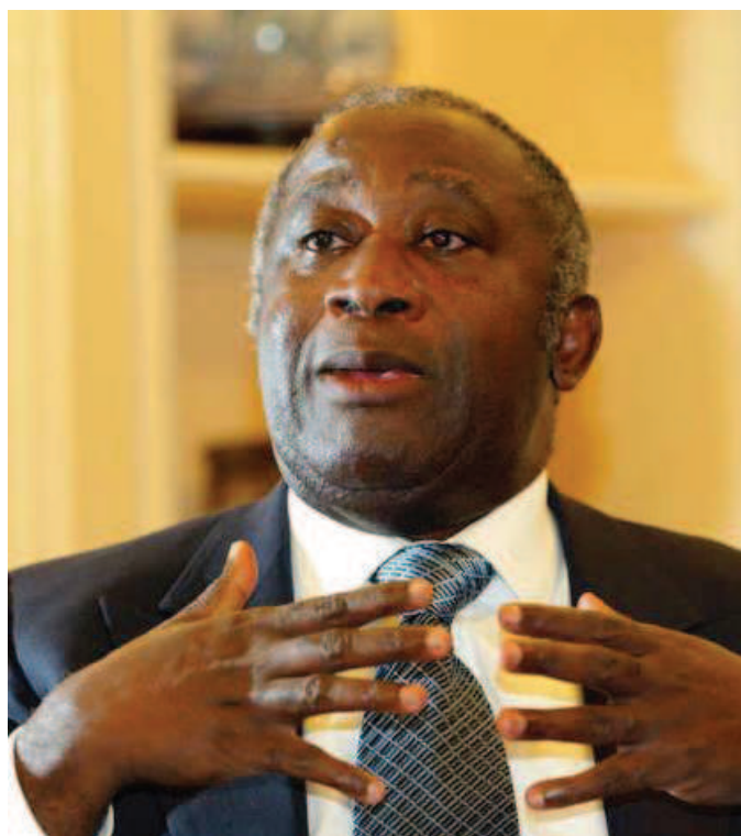
Laurent Gbagbo, bývalý prezident Pobřeží slonoviny.