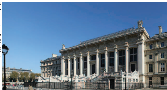
Budova soudu v Paříži.

Francouzský vyšetřující soudce potvrdil 2. dubna 2013 obvinění z podílu na genocidě ve Rwandě proti Pascalu Simbikangwovi a rozhodl, že bývalý kapitán rwandské armády stane před pařížským trestním soudem (Cour d'assises). Simbikangwa, jenž stál v čele rwandské zpravodajské služby, měl během genocidy dodávat zbraně hutuským milicím a podněcovat je k páchání masakrů; je proto obviněn ze spolupachatelství genocidy a zločinů proti lidskosti. V roce 2008 byl zatčen na francouzském ostrově Mayotte v Indickém oceánu a následujícího roku proti němu byla vznesena obvinění. Simbikangwa svou vinu popírá, avšak proti rozhodnutí vyšetřujícího soudce se neodvolal, čímž je otevřena cesta k hlavnímu líčení. To s největší pravděpodobností začne již koncem tohoto roku.