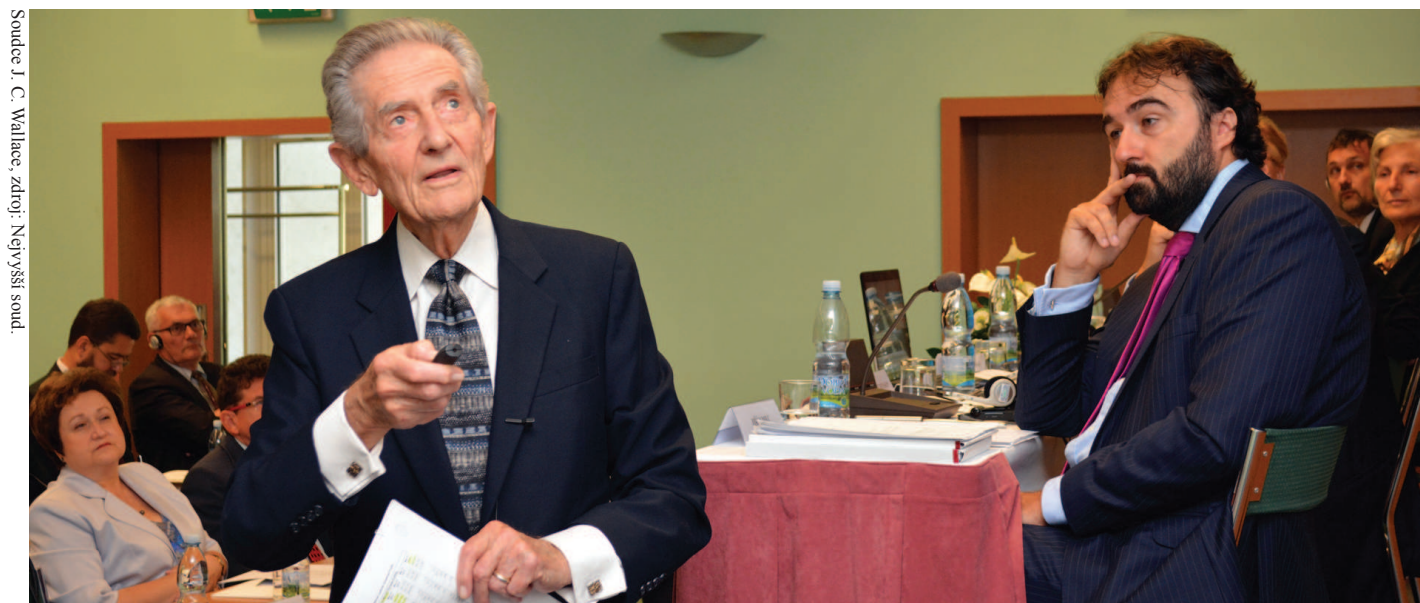
Soudce J. C. Wallace, zdroj: Nejvyšší soud.

[2] Rozsudek Evropského soudu pro lidská práva ze dne 27. 5. 2014, Baka proti Maďarsku , stížnost č. 20261/12.