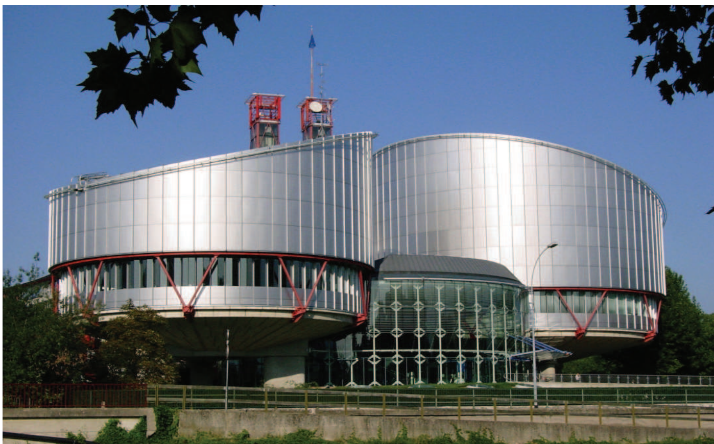
Budova ESLP, zdroj: Council of Europe.

V daném případě chorvatské soudy nedostály standardům, které pro ně plynou z lidskoprávních závazků. ESLP jim zejména vytkl, že své rozhodování založily převážně na znaleckém posudku. Přestože lékařská dokumentace hraje v obdobných případech zásadní