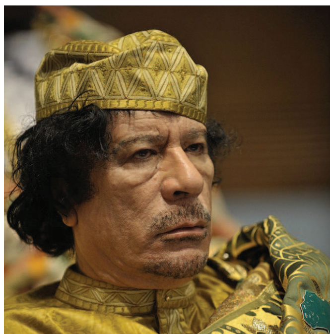
Muammar Kaddáfí

[3] V době rozhodování přípravného senátu byl Kaddáfí zadržován místními milicemi v Zintanu. Libye nebyla schopná zajistit jeho transfer do státního zařízení v Tripolisu. Kaddáfí je držen v Zintanu od listopadu 2011 do současnosti.