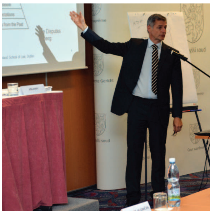
Brian Hutchinson, zdroj: Nejvyšší soud.

Zajímavé byly rovněž jeho postřehy ohledně tzv. soudního aktivismu. Podle názoru soudce Wallace rozdíl mezi soudním aktivismem a soudní zdrženlivostí spočívá ve víře v demokracii. Soudní aktivisté jsou přesvědčeni o tom, že demokracie má řadu nedostatků, a ty se