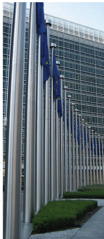
Budova Evropské komise v Bruselu