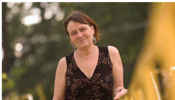
Anna Šabatová

Je v podstatě jisté, že problematika soužití s muslimkou menšinou bude v českém veřejném prostoru rezonovat stále. Stanovisko veřejné ochránkyně práv bude velmi významným odborným příspěvkem do této debaty, doufáme tedy, že neujde patřičné pozornosti odborné obce a dočká se odpovídající reakce. Problém nošení náboženských symbolů ve veřejném prostoru si odbornou pozornost dozajista zaslouží a bylo by škoda, pokud by se celá komplexní problematika redukovala na komunikaci prostřednictvím bulvárních titulků a jednovětých politických proklamací.