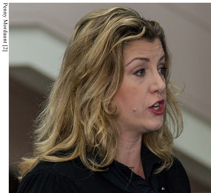
Penny Mordaunt [2]

[2] Penny Mordaunt