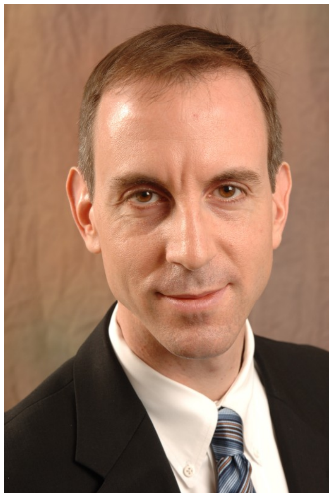
Eric Posner [1]

Na to navazuje část zabývající se tím, proč státy vůbec přistupují k lidskoprávním úmluvám. Posner se domnívá, že to není proto, že by se skutečně chtěly zavázat ke zlepšení lidskoprávního standardu. Podle něj je státy podepisují buď tehdy, pokud už požadovaný standard jejich země naplňuje. Anebo je podepisují, aniž by měly v úmyslu své chování změnit, a to