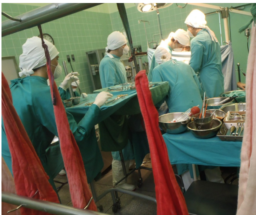
Transplantace orgánů [1]

Se zdravotním aspektem se úzce pojí aspekt finanční, jelikož právě na penězích závisí poskytovaná zdravotní péče. Protože zprostředkovatelům však záleží mnohem více na finančním prospěchu z obchodu než na zdraví poskytovatelů a objednatelů, financí na solidní zdravotní péči se nedostává. V kapsách zprostředkovatelů zůstává zpravidla více než 50 % z celkové částky zaplacené objednateli. Dále se část peněz přerozdělí mezi další osoby, které mají na realizaci obchodu nějakou