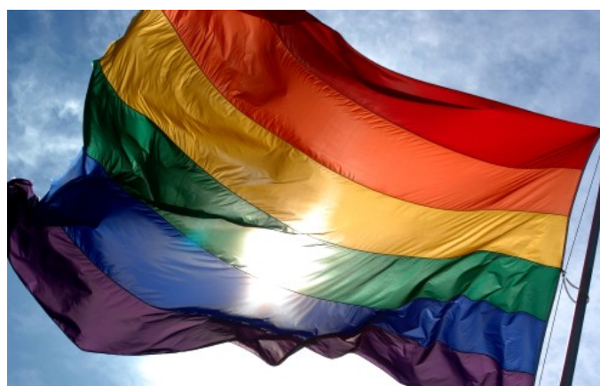
LGBT vlajka [1]

ESLP odkázal na provedené výzkumy, které naznačují, že italská společnost je na uzákonění registrovaného partnerství připravena a že takovou právní úpravu vítá. Zdůraznil pak zejména, že po uzákonění takové možnosti opakovaně volá italský ústavní soud, avšak jeho doporučení nebyla nikdy vyslyšena parlamentem, který je jediný příslušný k přijetí odpovídající úpravy.