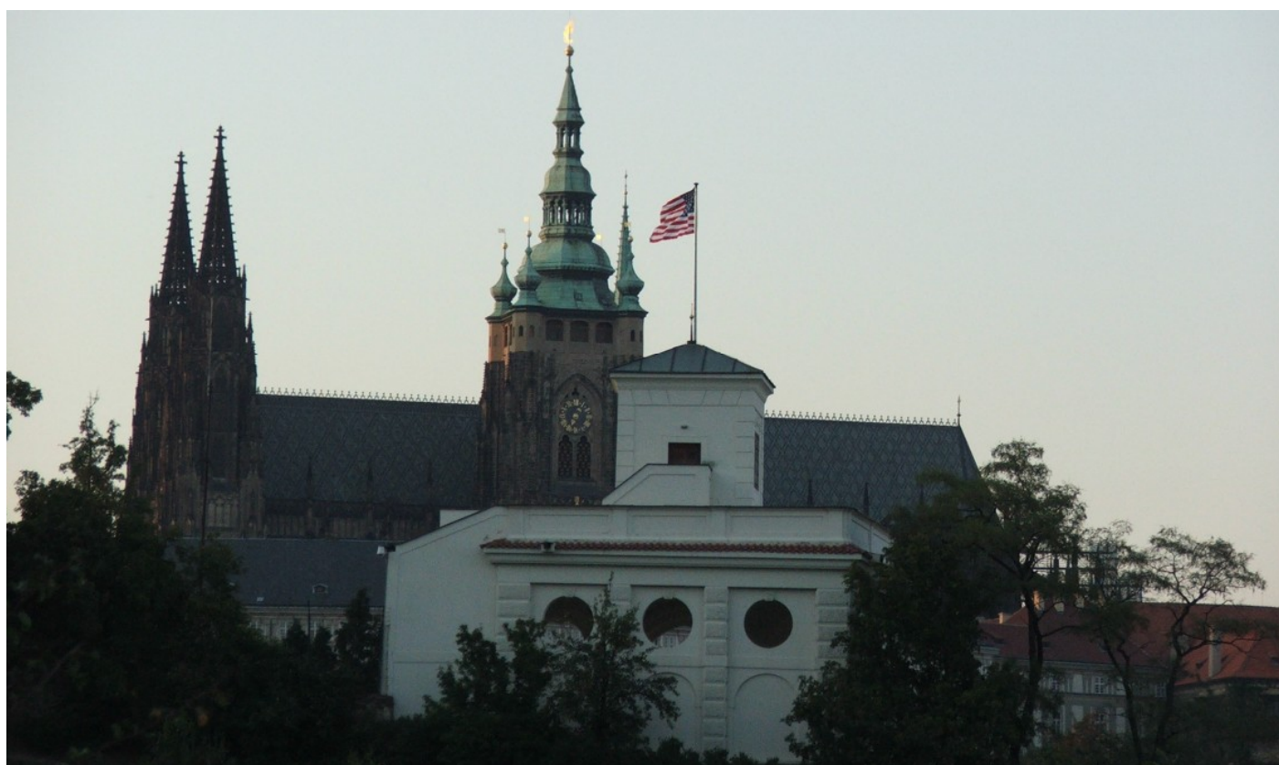
Americká ambasáda v Praze [1]

[1] Americká ambasáda v Praze (pohled z Petřína).