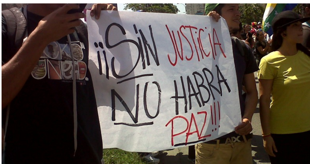
Demonstrace ve Venezuele [3]