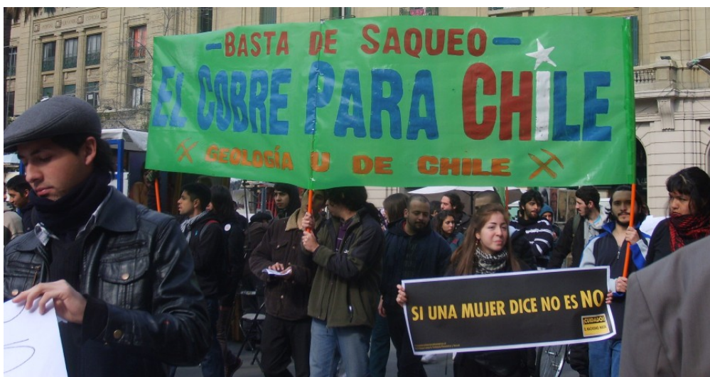
[2] Protesty proti těžbě mědi v Chile.

[3] Demonstrace ve Venezuele.