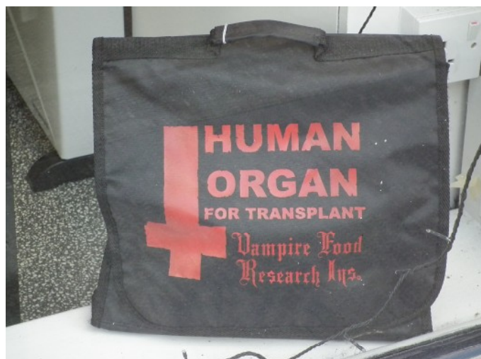
Orgány k transplantaci [2]

Kromě řady dokumentů, které slouží jako směrodatné instrukce např. lékařům apod., vznikly také právně závazné dokumenty založené na ochraně lidské důstojnosti. Úmluva o lidských právech a biomedicině z dílny Rady Evropy výslovně stanovuje, že z lidského těla ne-