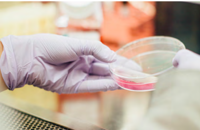
Ilustrační foto [2]

hodovací praxi ESLP jej ÚS podřadil pod součást práva na soukromý život (čl. 8 Evropské úmluvy o lidských právech).