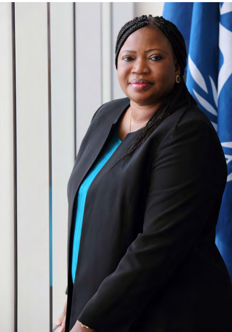
Prokurátorka MTS Fatou Bensouda [3]

soudu podle počtu případů, které skončí odsouzením. Dopad na kredibilitu soudu je také nejasný: na straně jedné může rozsudek soudu uškodit, neb dokazuje jeho neschopnost stíhat nejvyšší státní představitele, na stranu druhou však může pomoci kredibilitě soudu v očích afrických národů, které si dlouhodobě stěžují na zaujatost MTS.