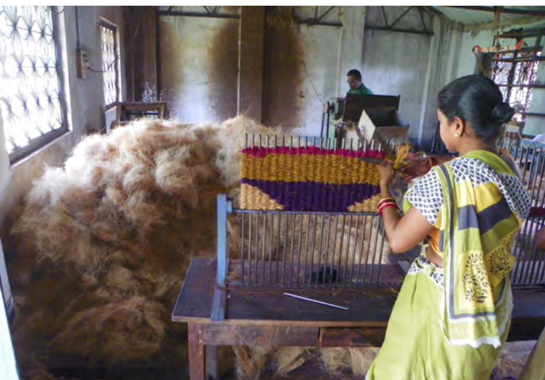
Spracovanie bavlny [2]

najčastejšie vyskytujúce sa patria zrakové problémy, chronické bolesti chrbtice či infekcie spôsobené drobnými poraneniami. Keďže ženy pracujúce z domu sa zvyčajne zároveň starajú o chod domácnosti, často trpia nespavosťou, psychickými problémami a nedostatkom sociálneho života.