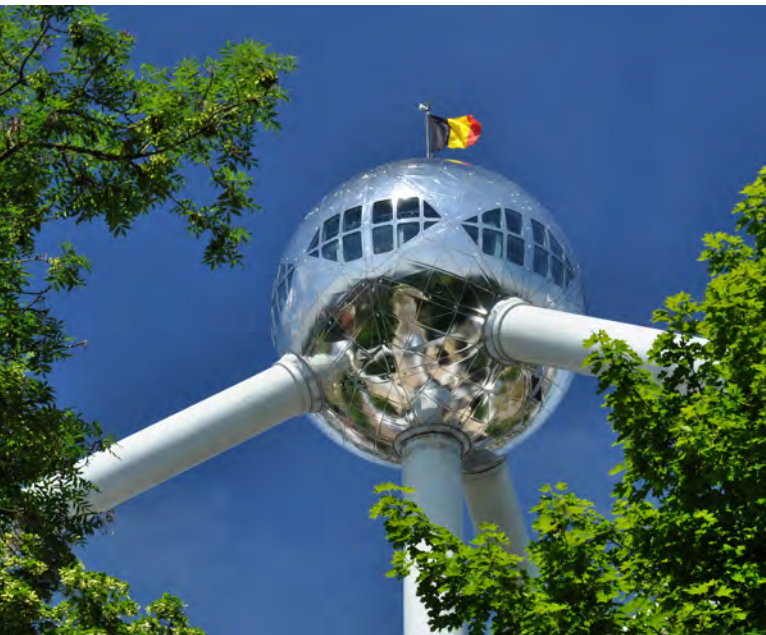
Atomium v Bruselu [6]

spory, která umožní obětem řádění „šmejdů“, aby se spojili, šli k soudu a vysoudili kompenzaci. Takéž v oblasti dvojí kvality potravin se poprvé řeklo, že se něco může dělat na úrovni Evropské unie. A v oblasti lidských práv je to nekonečná práce. Ta tendence ve státech k tomu, že demokracie je diktát většiny bez ohledu na potřeby menšin, je značná.