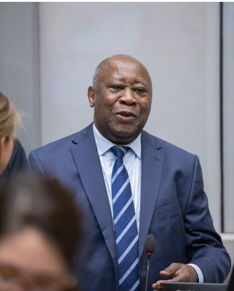
Bývalý prezident Laurent Gbagbo [2]

16. prosincem 2010 a 12. dubnem 2011. Gbagbo byl MTS předán již v roce 2011, zatímco Blé Goudé byl zatčen až zkraje roku 2013 a převezen do Haagu o rok později. Oba případy byly sloučeny a soudní proces začal v roce 2016. Bývalý prezident Gbagbo se tak stal první někdejší hlavou státu souzenou před MTS.