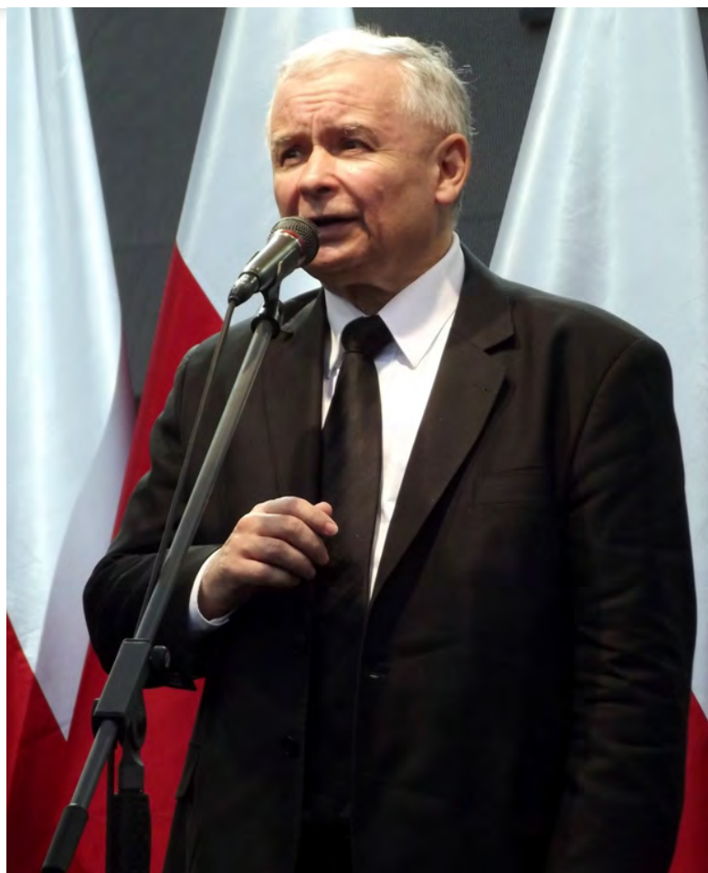
Lídr strany PiS Jarosław Kaczyński [1]

I v Evropě tak můžeme ocenit práci demokratických institucí, snažících se účinně potlačit rozmáhající se populismus a zneužívání politické moci některých politiků. Evropský parlament se snaží zamezit