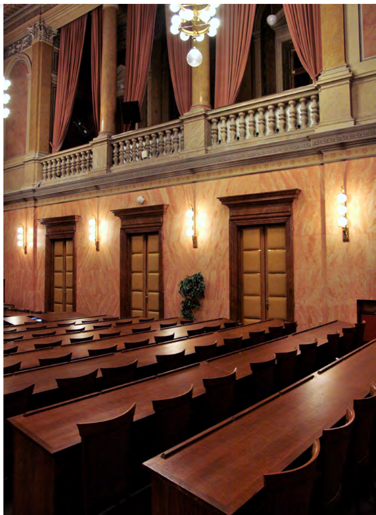
Sněmovní sál Ústavního soudu [1]

Tímto však zásahy do fungování justice ze strany kancléře prezidenta republiky neskončily. V roce 2016 zaslal dopis v té době úřadujícím předsedovi Nejvyššího správního soudu Josefu Baxovi, jenž se týkal právě projednávaného případu Plzeňské teplárenské. Ta začala stavět v roce 2013 spalovnu komunálního odpadu, na níž bylo, kvůli tvrzenému nezákonně vydanému stavebnímu povolení, podáno několik žalob. Krajský soud v Plzni v roce 2015