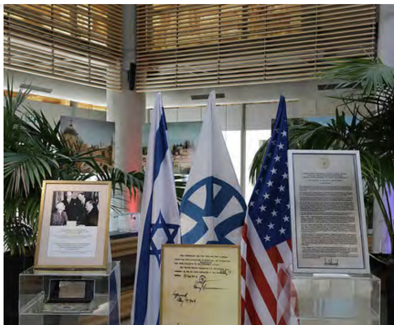
Oslavy presunu veľvyslanectva USA do Jeruzalema [1]

Uvedené predbežné šetrenie je už tretím v poradí. Prvé predbežné šetrenie bolo reakciou na izraelskú