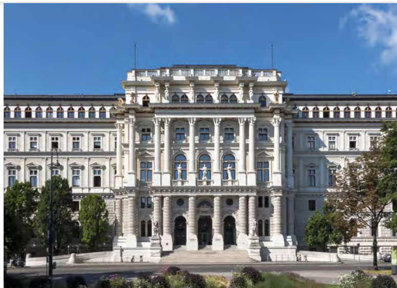
Justiční palác ve Vídni, sídlo rakouského Nejvyššího soudu [1]

Kromě zmíněných třinácti svátků ale zákon přichází ještě se čtrnáctým svátkem, který však přísluší pouze zaměstnancům z řad příslušníků evangelických církví augsburského a helvetského vyznání, starokatolické církve a evangelicko-metodistické církve. Pro tyto zaměstnance je svátkem, za nějž přísluší náhrada mzdy, též Velký pátek. Pro ostatní rakouské zaměstnance, tedy ty s jiným než výše zmíněným vyznáním, nebo případně bez vyznání, je Velký pátek obyčejným pracovním dnem.