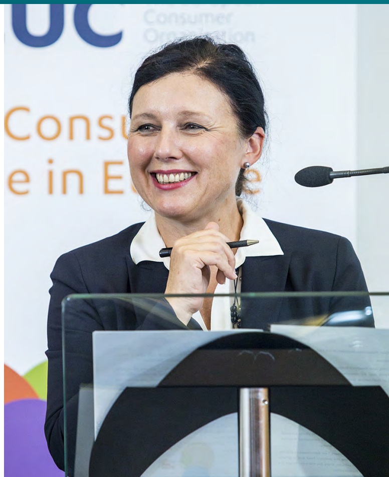
Věra Jourová na konferenci Evropské organizace spotřebitelů [1]

Druhá oblast se týká bezpečnosti. Soustředím se na oblast trestního práva. Jde mi o to zajistit, aby neměli zločinci v Evropě jednoduchý život a nezne-