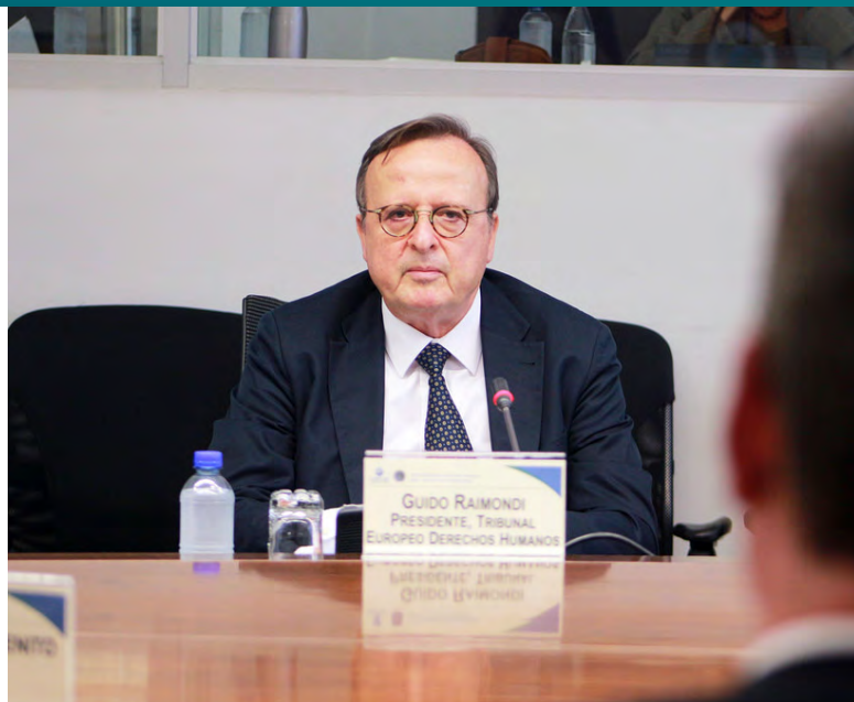
Guido Raimondi [1]

Největší nárůst stížností Soud zaznamenal z Ruska – o téměř 35 %. Zatímco v roce 2017 bylo podáno necelých 8 tisíc stížností, v roce 2018 už šlo o více než 12 tisíc stížností. Oproti tomu stížností proti Turecku výrazně ubylo, necelých 7 tisíc za rok 2018 znamená sedmdesátiprocentní pokles oproti zhruba 26 tisícům stížností z roku 2017. Je ale třeba si