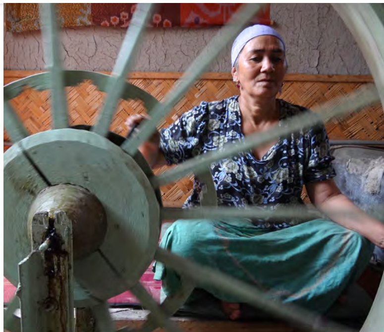
Žena pri práci [1]

Až 85 percent indických žien, ktoré pracujú z domu, vyrába oblečenie či iný textilný materiál výlučne pre firmy z vyspelých častí sveta. Ostatné ženy pracujú