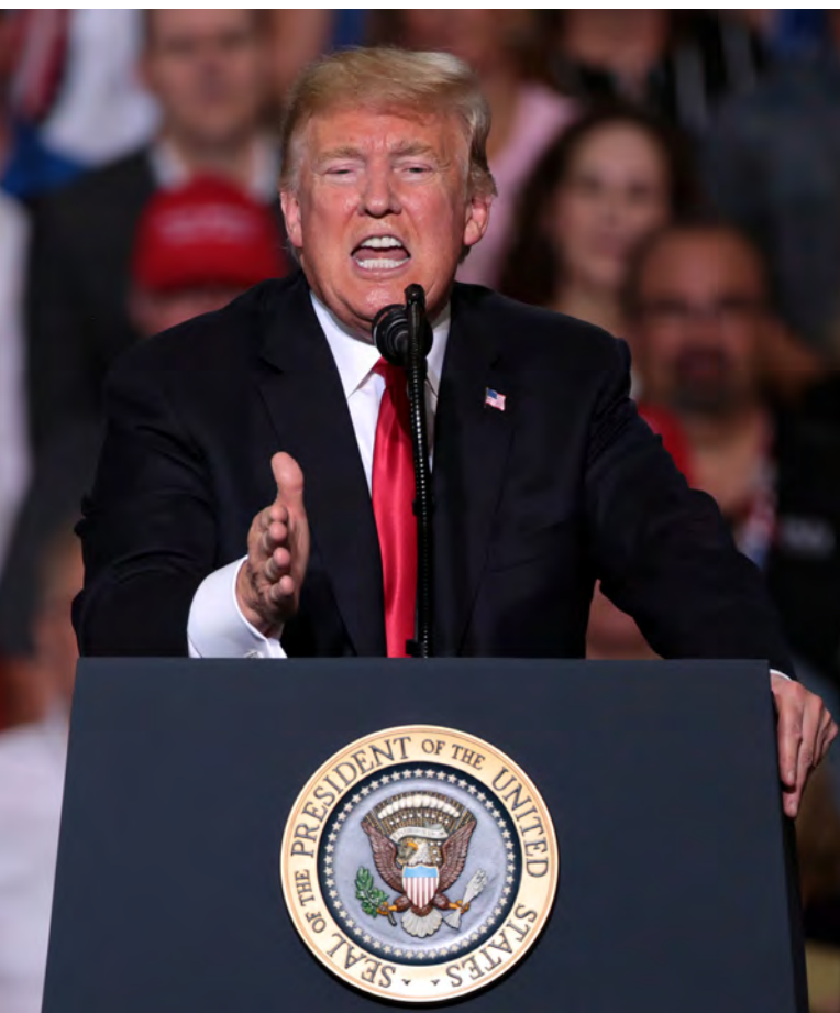
Prezident Donald Trump

mi soudy a na jakékoli finance, které v USA mají, budou uvaleny sankce. V prohlášení John Bolton pronesl, že Spojené státy americké nebudou s MTS spolupracovat, nebudou MTS poskytovat žádnou asistenci a k MTS se nepřipojí.