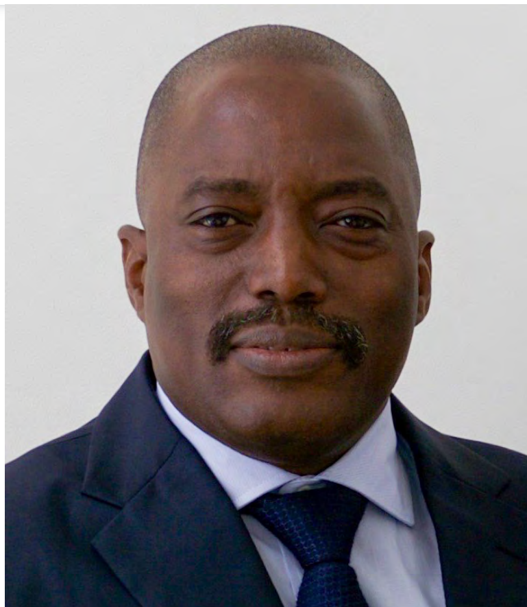
Bývalý prezident Demokratické republiky Kongo Joseph Kabila [1]

Volby sice vyhrála opozice, ale i tak výsledky voleb provází spekulace a pochybnosti. Politologové specializující se na africký kontinent upozorňují na to, že volby mohly být zmanipulované současnou vládou ve prospěch opozičního kandidáta s cílem udržet svůj vliv, ale navenek ukázat změnu. Neúspěšný opoziční kandidát Martin Fayulua se obrátil na ústavní soud s žádostí o přepočítání hlasů. Ústavní soud žádosti nevyhověl s odůvodněním, že mu nebyly předloženy žádné věrohodné důkazy o pochybnostech ohledně výsledků voleb. Evropská unie stejně jako Africká unie vyjádřily pochybnosti nad závěry ústavního soudu.