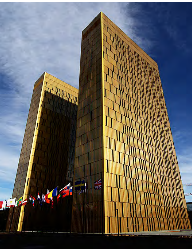
Budova Soudního dvora EU v Lucemburku [2]

zí méně příznivě, než se zachází nebo zacházelo nebo by se zacházelo s jinou osobou ve srovnatelné situaci na základě jednoho z důvodů uvedených v článku 1“, tedy na základě náboženského vyznání či víry, zdravotního postižení, věku nebo sexuální orientace.