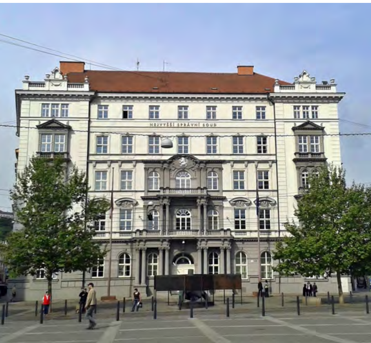
Budova Nejvyššího správního soudu [2]