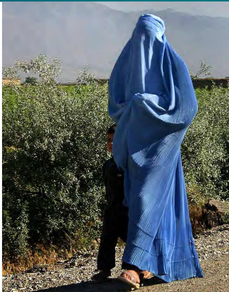
Afghánská žena v burce [1]

Americký zástupce Zalmay Khalilzad se tak na konci ledna sešel se zástupci hnutí Tálibán v katarském Dauhá, kde spolu dojednali tzv. dohodu o dohodě. Strany se shodly na tom, že chtějí uzavřít mírovou dohodu, která by obsahovala závazek odchodu amerických vojsk z afghánského území, uznání hnutí Tálibán za legitimní a také zákaz poskyto-