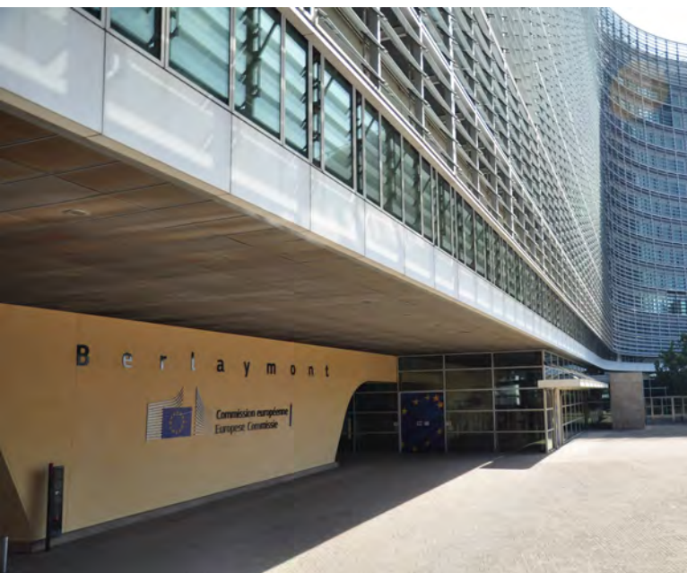
Berlaymont, sídlo Komise EU v Bruselu [5]

o tabu a spousta z těch dívek o tom nechce mluvit, přitom je potřeba o tom nejen mluvit, ale i proti tomu aktivně zasahovat.