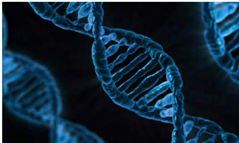
Detail molekuly DNA (dvojšroubovice) [1]

Podle názoru stěžovatelky bylo nutné zvážit všechny okolnosti daného případu, přičemž pouhé trvání