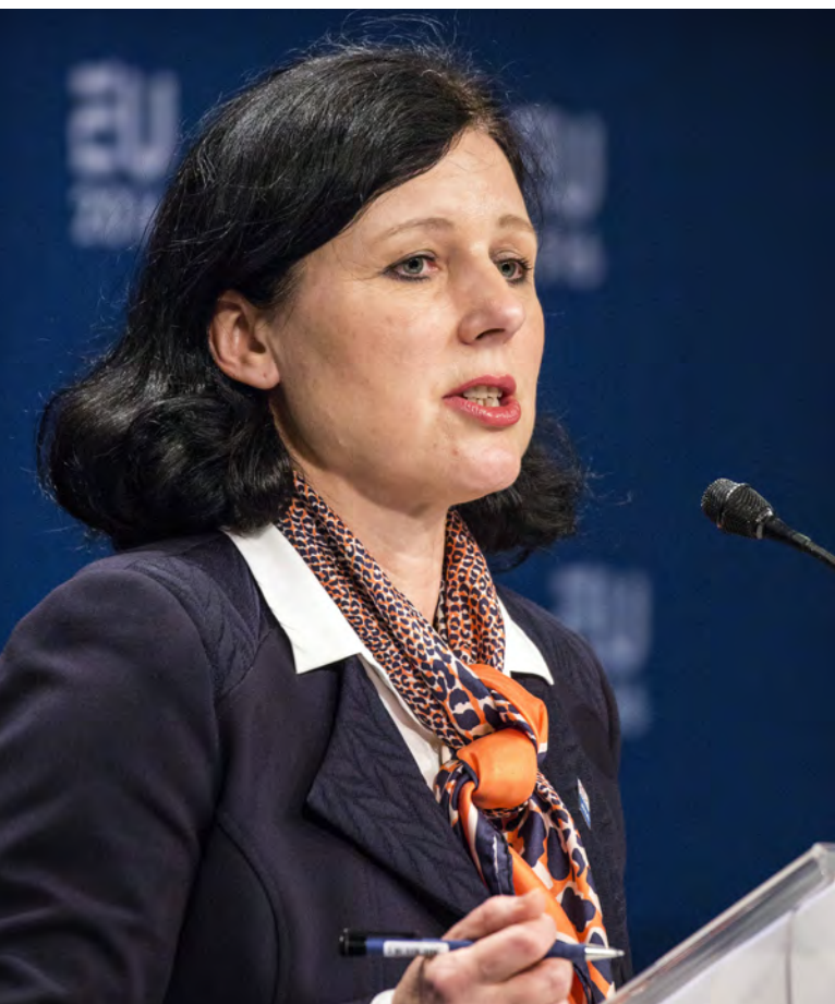
Věra Jourová na tiskové konferenci [3]

nem. Dezinformace jsou úplně jiná kategorie a my jsme opatrní, protože nechceme cenzuru. Mluvíme s členskými státy o tom, aby existovaly kapacity, které se budou prokazatelně falešnými nebo zavádějícími informacemi zabývat. Zde se ale pohybujeme na úrovni faktů. Nechceme, aby se napravovaly něčí politické názory, ale aby se upozornilo na lži a manipulace.