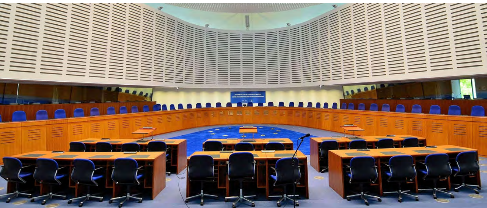
Jednací síň Evropského soudu pro lidská práva [3]