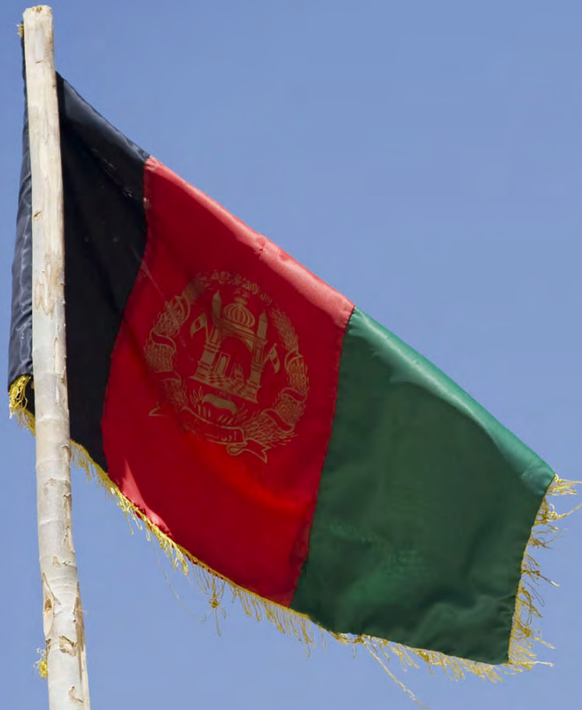
Afghánská vlajka [2]