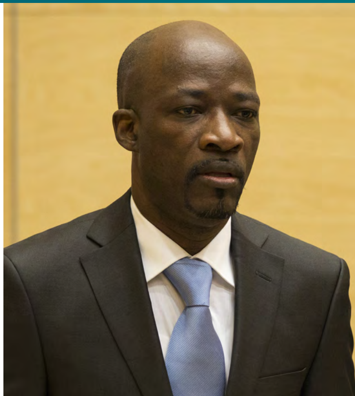
Charles Blé Goudé před MTS [1]

Přes snahy mezinárodní komunity o ukončení konfliktu se stabilní mírovou dohodu podařilo uzavřít až v roce 2007. Nové volby proběhly po četných odkladech až v roce 2010 a utkal se v nich prezident Gbagbo a jeho rival Ouattara. Dle výsledků uznaných mezinárodním společenstvím se vítězem voleb stal Ouattara, Gbagbo však odmítl odstoupit.[2] Pobřeží slonoviny zachvátila nová vlna násilí mezi přívrženci prezidentských kandidátů, která si vyžádala na