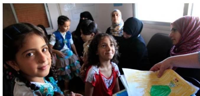
Syrští uprchlíci [1]

Eurostat se ve své zprávě nezabýval pouze počtem a občanstvím uprchlíků, ale také věkem a pohlavím.