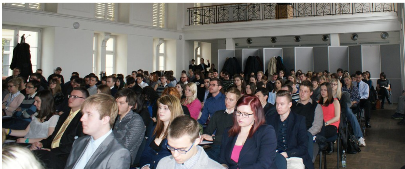
Aula FSS byla po celý den konání plná posluchačů [1]

Ve „zlatých dobách“ studené války byly pevně dané metodiky, dle kterých se postupovalo. Dnes se situace