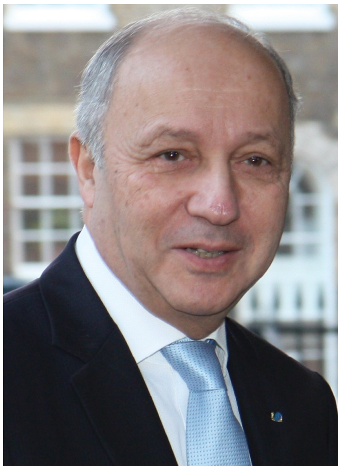
Laurent Fabius, ministr zahraničních věcí Francie [2]

V březnu 2015 vysoký komisař OSN pro lidská práva Zeid Ra'ad Al-Hussein vydal zprávu, ve které shrnuje podezření o spáchaných mezinárodních zločinech Islámským státem v Sýrii a Iráku (dále též „Islámský stát“ nebo „ISIS“) [1]. Představitelé ISIS se měli dopustit zločinů proti lidskosti ve formě vraždy, zotročování, mučení, znásilnění, a také válečných zločinů, mimo jiné ve formě ničení historických památek, plenění měst a náboru dětských vojáků. Ve zprávě se uvádí, že ISIS je podezřelý i ze spáchání genocidy vůči Jezidům, národnostní a náboženské menšině v Iráku. V závěru své zprávy vysoký komisař uvádí, že Rada bezpečnosti OSN by měla zvážit, zda celou situaci neoznámí Mezinárodnímu trestnímu soudu [dále též „soud“ nebo „MTS“; tzv. Security Council referral dle čl. 13 písm. b) Římského statutu]. Možnost předání Islámského státu k vyšetřování MTS podpořil i ministr zahraničních věcí Francie Laurent Fabius.