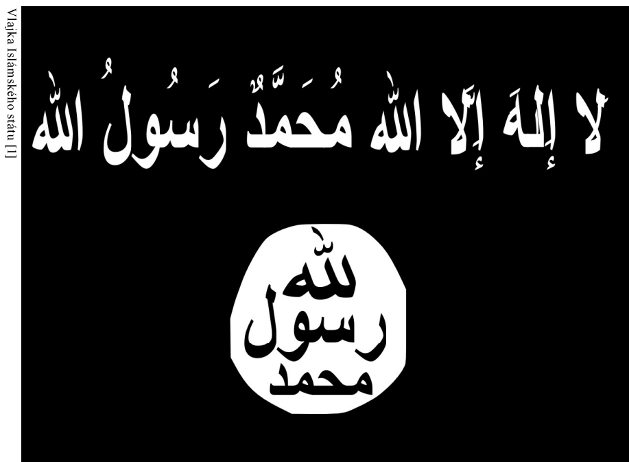
Vlajka Islámského státu [1]

Římský statut hovoří o oznámení situace, ať už smluvním státem, nebo Radou bezpečnosti OSN, nikoli o oznámení konkrétního pachatele. Vyšetřování žalobce tak probíhá nezávisle a zahrnuje všechny strany konfliktu za předpokla-