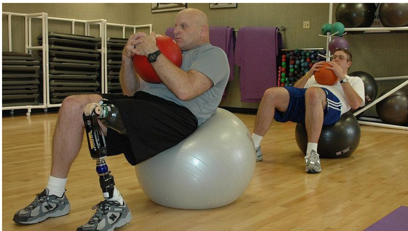
Ilustrační foto [2]

[2] Ilustrační foto, foto: Hanah Cohen, Flickr.com, CC BY-SA 2.0.