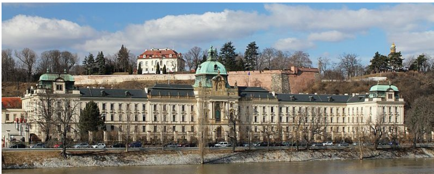
Strakova akademie [1]

Co tedy bude Ústavní soud posuzovat? Jádrem přezkumu bude otázka, zda je zákaz osvojení registrovanými partnery diskriminační. Při zjišťování, zda se jedná o diskriminaci, se posuzuje, zda dochází (1) k přímému vyčlenění srovnatelného jednotlivce nebo skupiny, (2) ze zakázaného důvodu, které (3) je mu k tíži uloženo břemeno nebo odepření dobra, a (4) vyčleňování není možné ospravedlnit, tj. nesleduje žádný legitimní důvod a je nepřiměřené.[2]