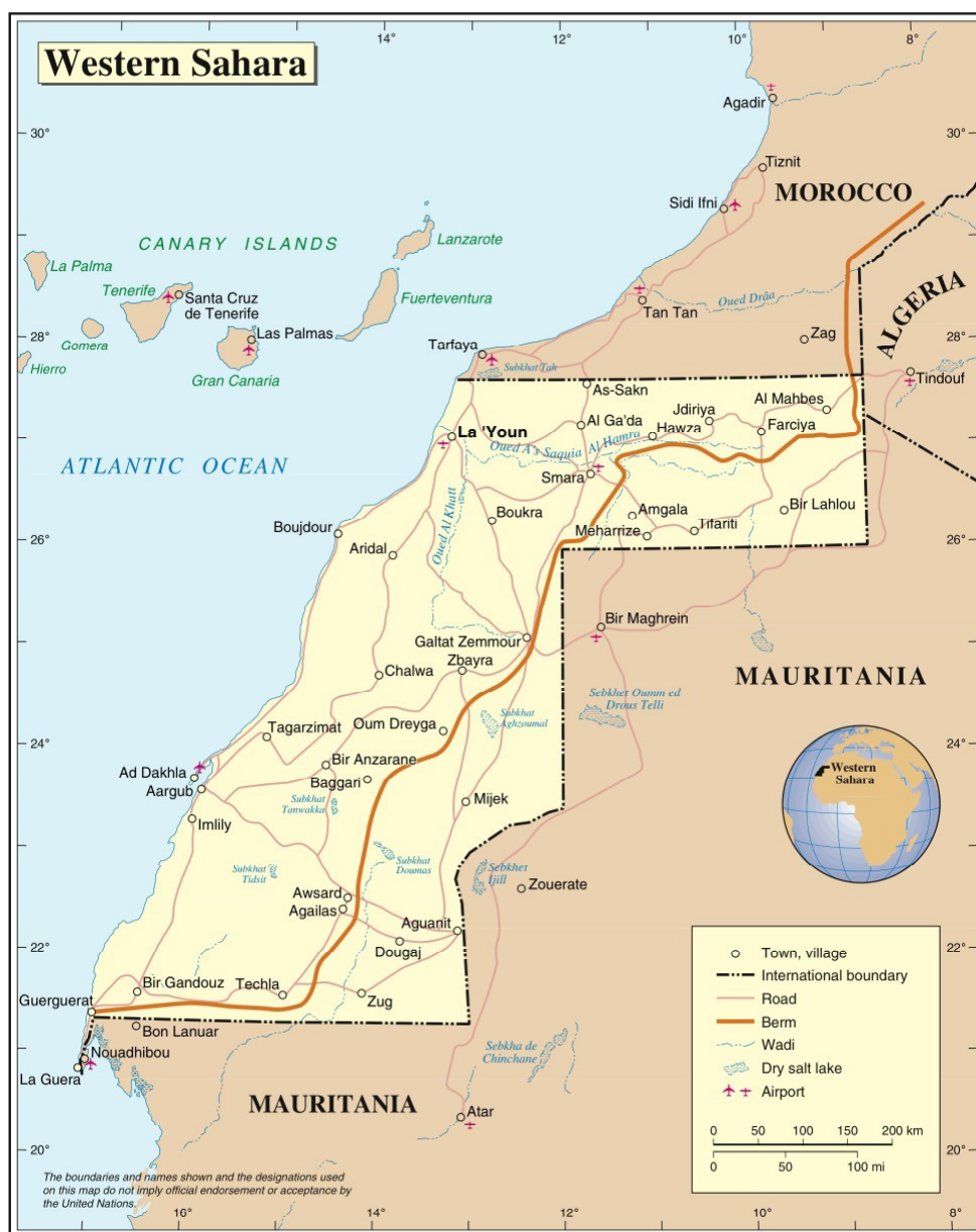
Mapa Západní Sahary [1]

[1] Mapa Západní Sahary, autor: Nick Brooks, 1 December 2005, Flickr, CC BY-NC-ND 2.0.