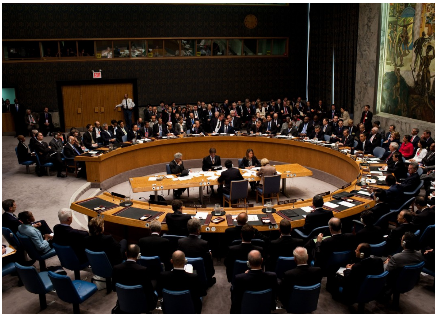
Jednání Rady bezpečnosti OSN [3]

Oznámení Radou bezpečnosti s sebou navíc nese několik problémů. Především jde o to, jak podezřelé osoby dopadnout a zadržet během stále probíhajícího konfliktu a předvést je k soudnímu řízení. Podobně problematická je rovněž situace se shromažďováním důkazů. V neposlední řadě je zde i otázka peněz, a to konkrétně