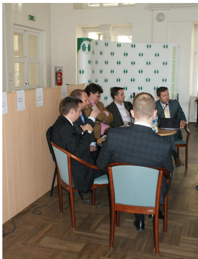
Účastníci diskuzního panelu [2]

Hodulák hovořil o nedávné světové finanční krizi zahraničního zadlužení z pohledu reakce ČR v rámci prizmatu teorie racionální volby. Také se věnoval kritice reakce EU, jež se rozhodla s krizí vyrovnat přenesením nákladů na její řešení na dlužníky.