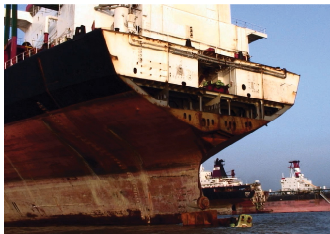
Dostupující lodě [1]

V červnu 2013 se Rada EU s Evropským parlamentem usnesly na kompromisu znění nového nařízení, které bylo následně podpořeno Environmentální komisí Evropského parlamentu. Nařízení nakonec přijal Evropský parlament i Rada EU a 30. prosince 2013 tak mohlo vejít v platnost. Účinnost bude nařízení nabývat postupně – některá ustanovení ohledně pravidel pro lodě a ohledně vytváření seznamu recyklačních společnos-