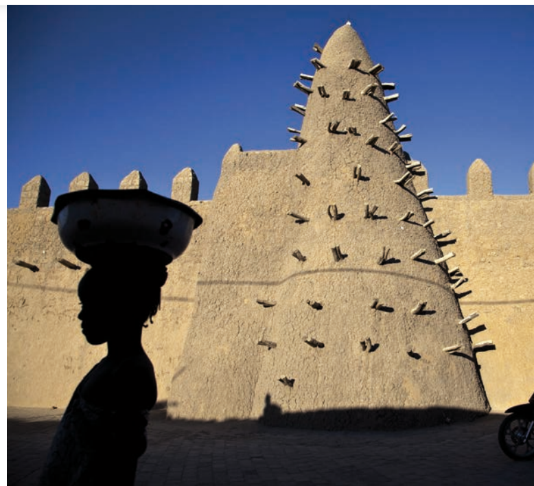
Mešita v historickém centru Timbuktu [2]

[1] Trosky zničeného mauzolea v Timbuktu, autor: United Nations Mission in Mali, 6. prosince 2013, CC BY-NC-SA 2.0.