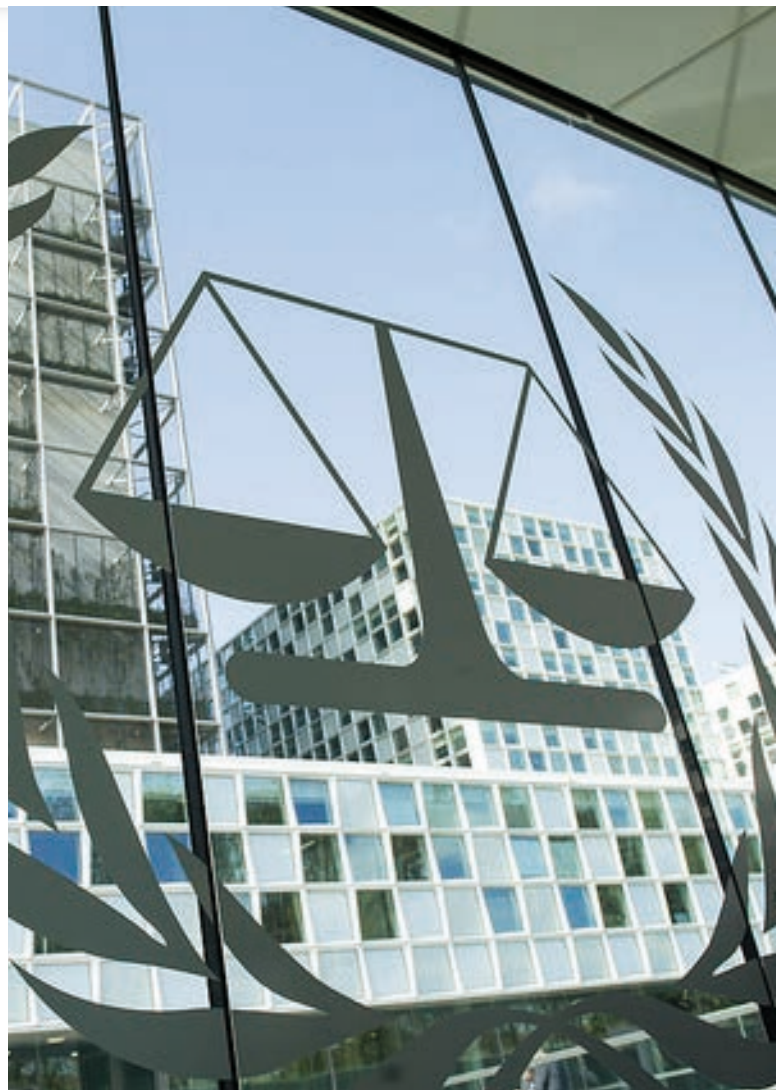
Sídlo Medzinárodného trestného soudu [1]

je taktiež povinný získavať a zhromažďovať „dôkazy proti ako aj v prospech potencionálnych páchatelov“ v rámci jednotlivých situácií a prípadov.