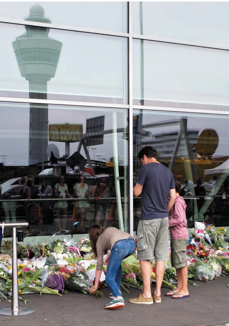
Památník obětem tragédie na amsterdamském letišti Schiphol [3]

váno asi 100 podezřelých osob, přičemž objasněno musí být nejen to, kdo vykonal samotný skutek, ale zda tak činil na něčí rozkaz. V takovém případě bude nutné rozkrýt danou organizační strukturu.