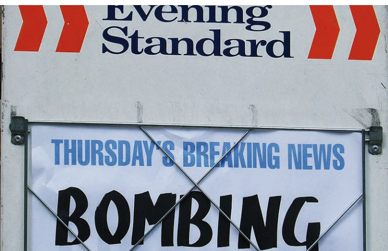
Novinová reakce na Londýnské útoky [2]

a poučení nedávají. Výpověď byla následně jedním z hlavních důkazů před soudem, kde byl Abdulrahman odsouzen, ačkoliv žádal o její nepoužití.