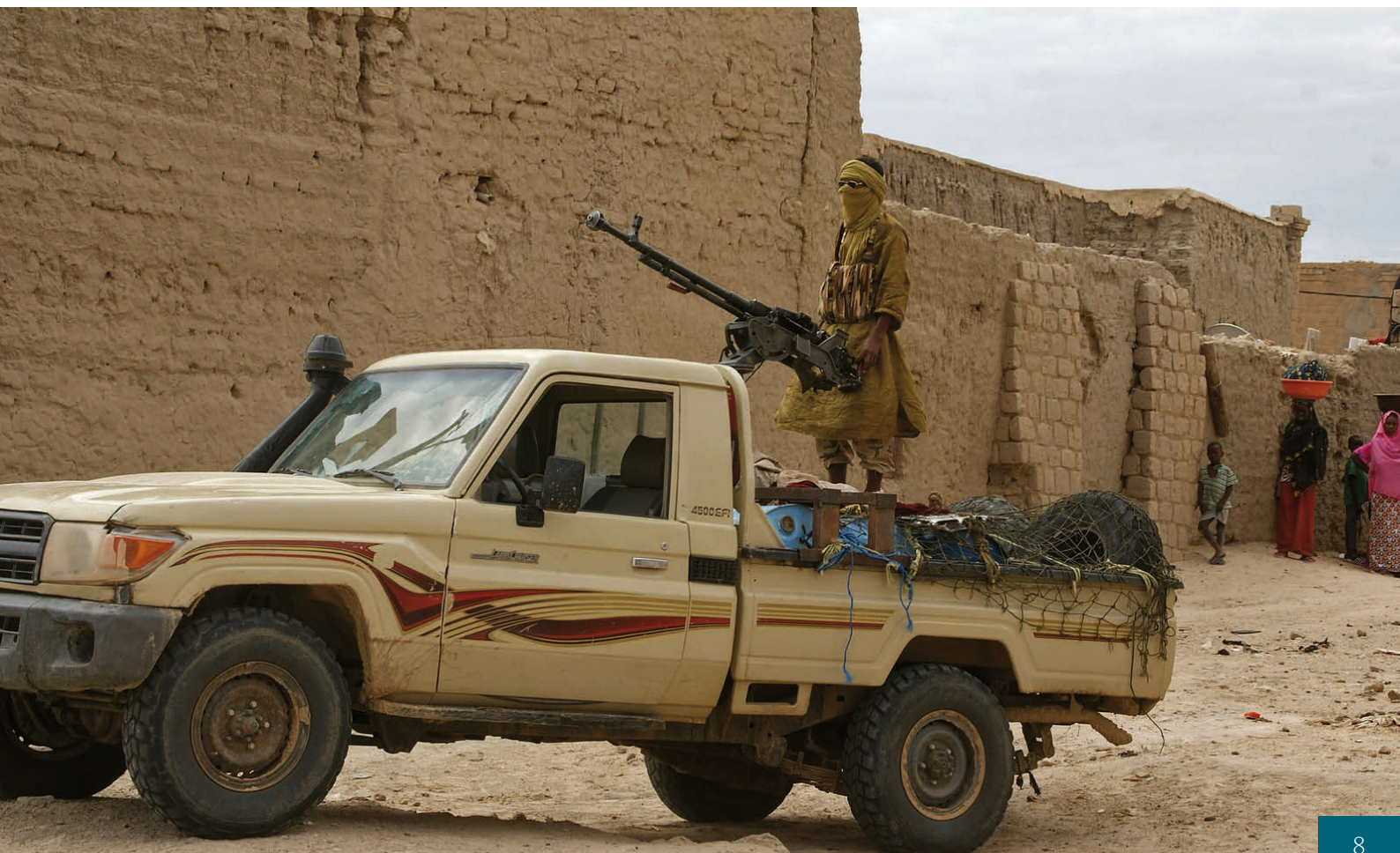
Bojovník organizace Ansar Dime v Timbuktu [3]

[3] Bojovník organizace Ansar Dime v Timbuktu, autor: Magharebia, zdroj: Flickr, CC BY 2.0.