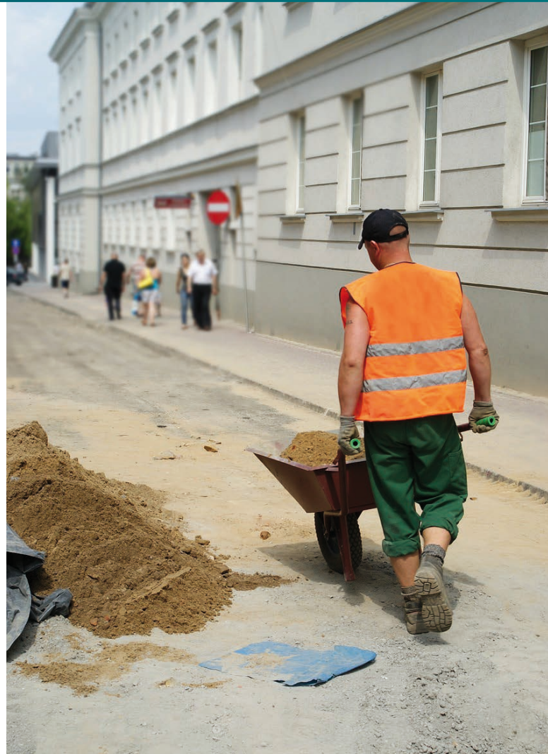
Stavební dělník [1]

Dohled nad dodržováním pracovních předpisů je podle zákona o inspekci práce v České republice svěřen Státnímu úřadu inspekce práce (dále "Úřad") a poté oblastním inspektorátům prá-