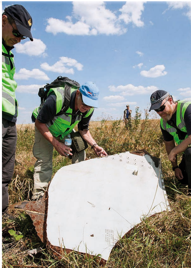
Vyšetřování na místě havárie letu MH-17 [1]

Aktuální rozruch v celé kauze byl způsoben zveřejněním předběžných závěrů společného vyšetřovacího týmu dne 28. září 2016. Již v této fázi je rozsah vyšetřování obrovský. Tým se skládá až z 200 vyšetřovatelů a expertů, kteří prověřili tisíce kusů trosek letadla, 500 tisíc videí a fotografií, více