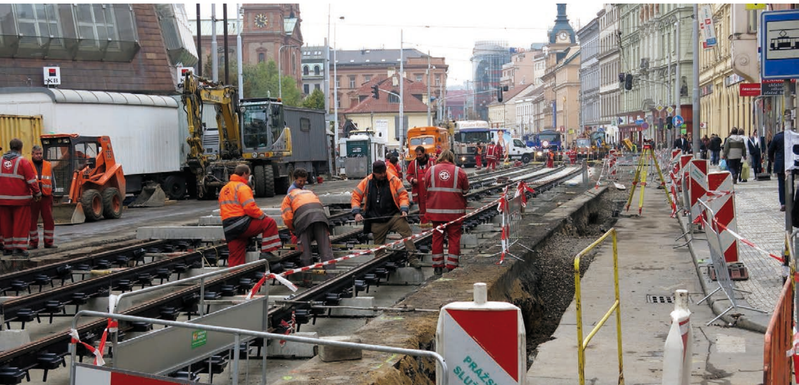
Stavební práce v Praze [2]

ním vztahu vázán, uložit povinnost učinit opatření k odstranění těchto porušení v přiměřené lhůtě. Případně je možné udělovat i finanční pokuty, a to jak přímým zaměstnavatelům, tak i pracovním agenturám. Právě agenturní zaměstnávání, kdy je odpovědnost za důstojné pracovní podmínky zmlžena existencí zprostředkovatele práce, je pro cizince pracující v České republice typické. Výše uvedené však platí i pro další skupiny osob – například pro ženy na mateřské dovolené či zdravotně postižené.