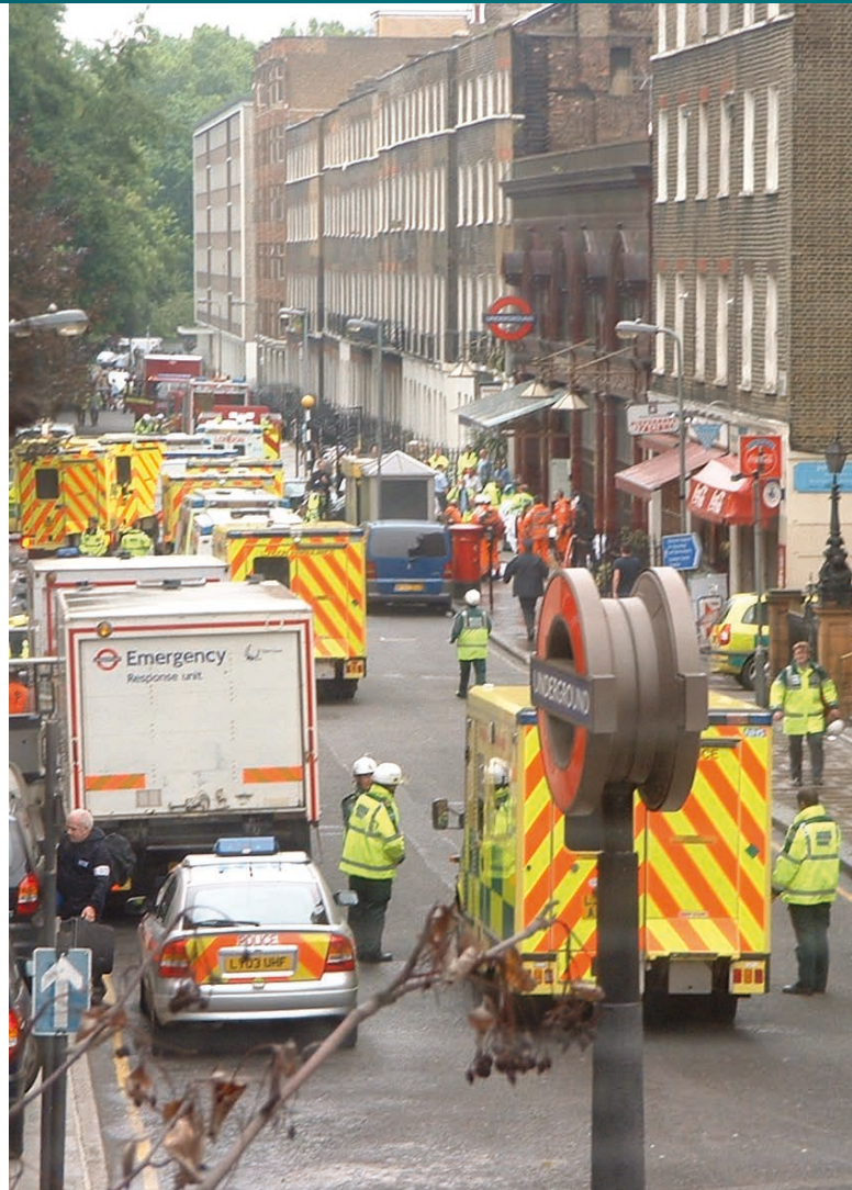
Bezpečnostní složky na místě útoku [1]

Období po teroristických útocích bylo časem usilovného pátrání a vyšetřování. Bezpečnostní složky nakonec zadržely Muktara Saida Ibrahima, Ramziho Mohammeda a Yassina Omara jako podezřelé z atentátů a jako s takovými s nimi nakládaly. Nicméně u prvních výsledků neměli přístup k odbor-