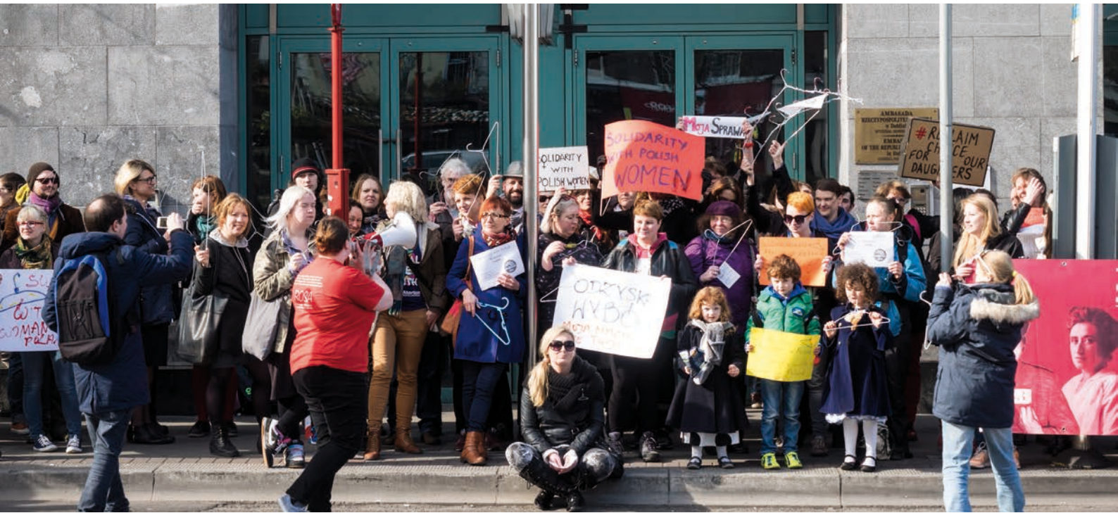
Černý protest [2]

který oproti prvnímu čtení zcela obrátil, když dne 6. října 2016 proti návrhu hlasovalo 352 z 428 přítomných poslanců, přičemž jen 58 bylo pro jeho přijetí.