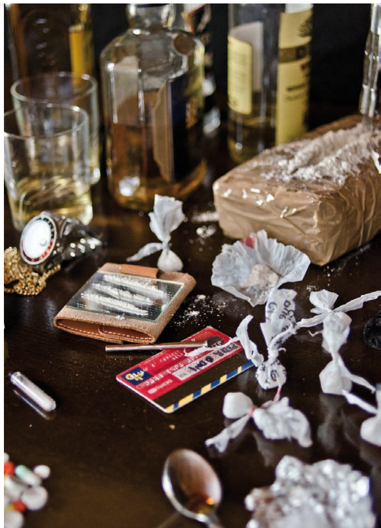
Drogy legální i ilegální [1]

Pokud hrozí, že osoba má být vydána z členské země EU do země, kde jí hrozí trest smrti, případně mučení, nelidské, ponižující zacházení nebo trestání, došlo by tím k porušení Evropské úmluvy. Taková osoba nesmí být tedy do dané země vydána, byť se může jednat o uživatele drog či obchodníka s drogami, neboť lidská práva všech jsou chráněna stejně. Ačkoliv lidská práva všech jsou chráněna stejnou měrou, neznamená to, že by snad uživatelé drog a obchodníci s nimi měli právo na jejich brání.