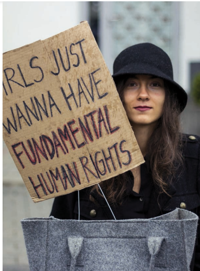
Jedna z účastnic černého protestu [1]

Přísná právní úprava interrupcí, stejně jako aktuálně v Polsku, panuje také v Irsku, Severním Irsku, San Marinu, Lichtenštejnsku nebo Andoře. Přijetím takového návrhu by se však Polsko prakticky přiraďovalo po bok Maltý a Vatikánu, tedy nejkonzervativnějším států Evropy v této otázce, kde jsou potraty zcela zakázány přímo ze zákona.