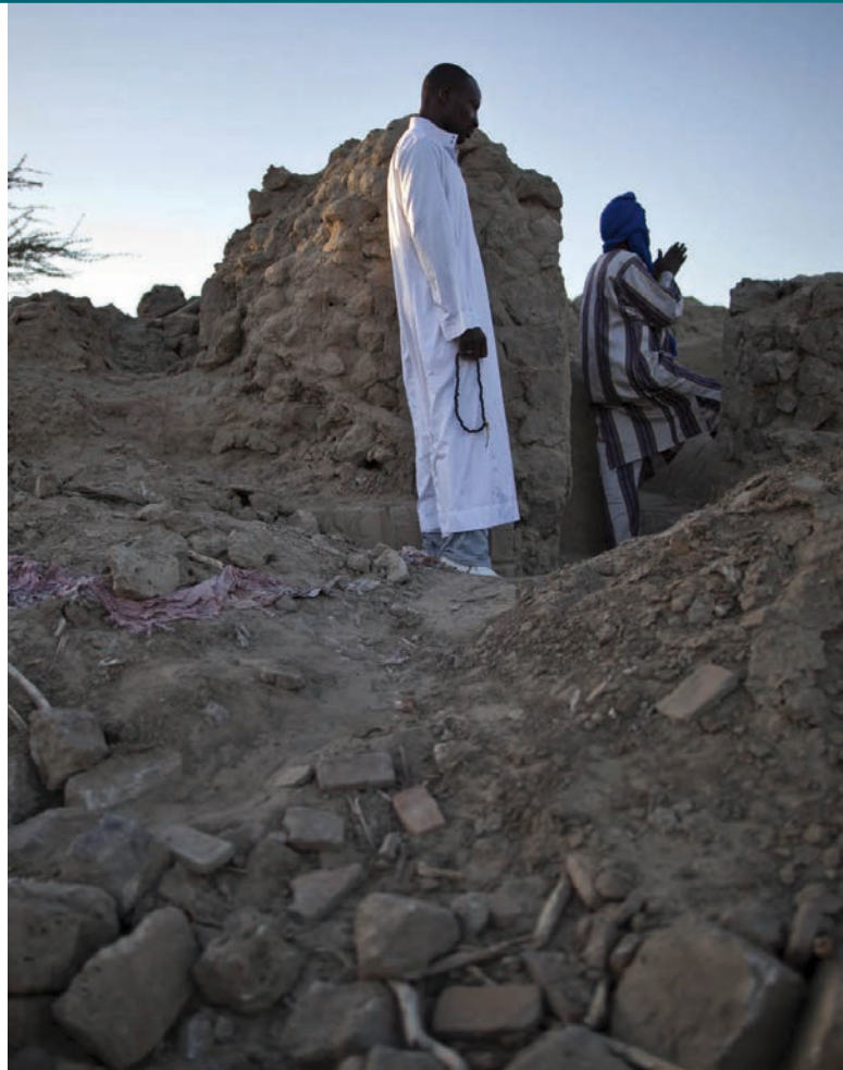
Trosky zničeného mauzolea v Timbaktu [1]

Soud měl situaci do určité míry usnadněnou tím, že al-Mahdí se ke svým činům přiznal a vyšetřova-