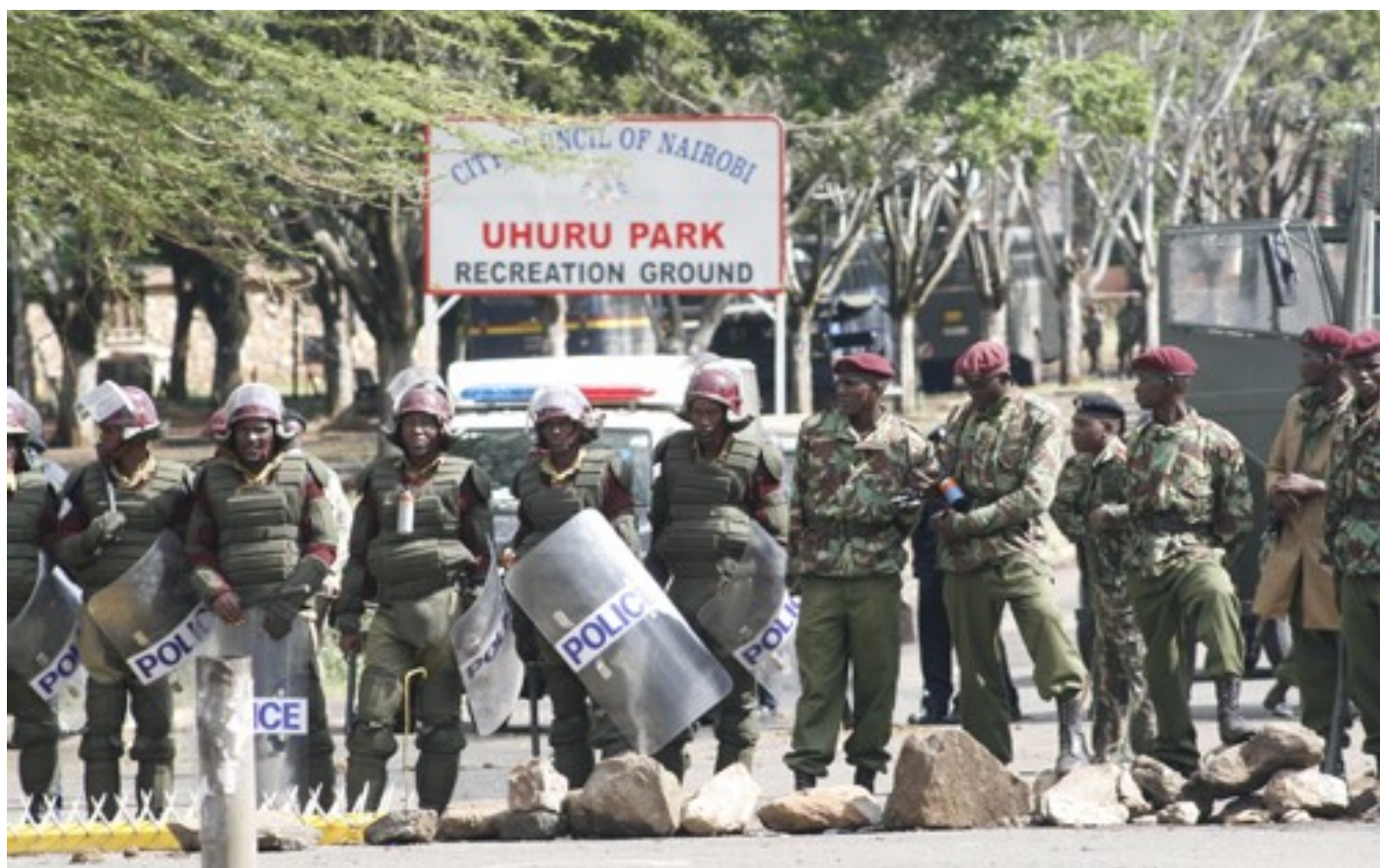
Police u Uhuru park v Keni brání opozičnímu protestnímu shromáždění [1]

Působení EU v rizikových zemích se zaměřuje na práci s veřejností, na niž lze účinně působit zejména skrze média. S tímto vědomím probíhal v letech 2008-