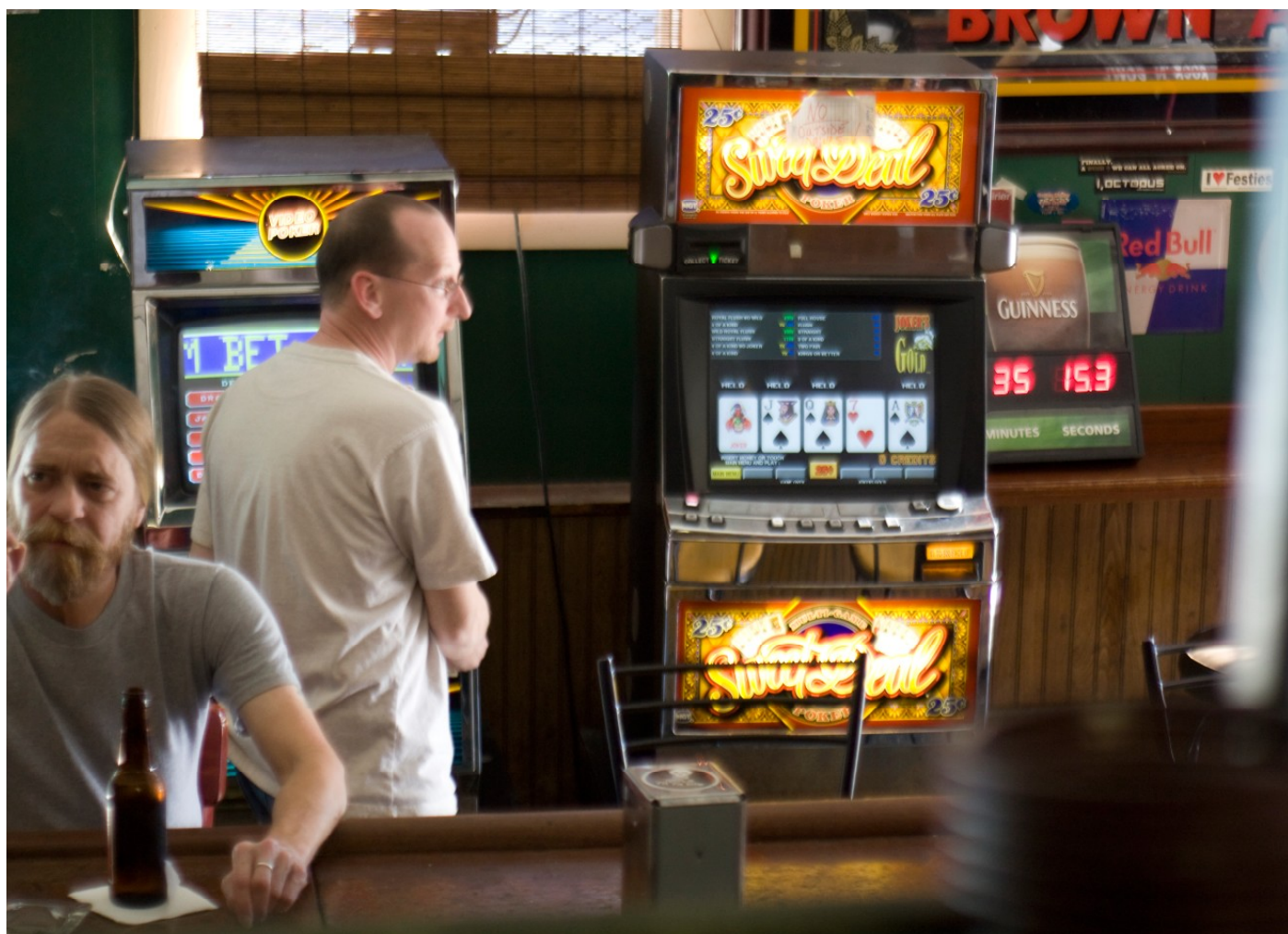
Výherní hrací přístroje [2]

[1] Výherní hrací přístroje, Autor: Kent Wang. CC-BY-SA 2.0. [2] Hazard, Autor: Pcb21. CC-BY-SA-3.0.