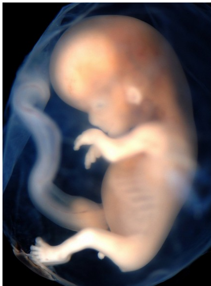
Ľudský plod [1]