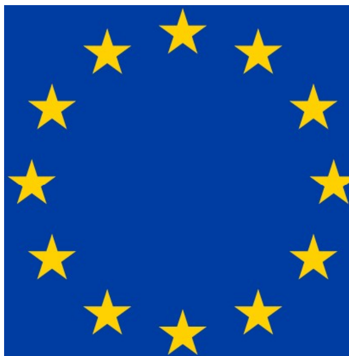
Vlajka Evropské unie [1]

Od nové úpravy si EIOÚ slibuje, že nebude zbytečně zabíhat do detailů tak, aby poskytovala prostor pro další rozvoj technologií a přitom je zvládla stále dostatečně regulovat. Dále doufá v upuštění od nesrozumitelných formulací a složitých právních konstrukcí.