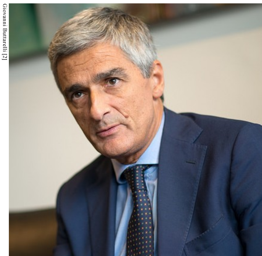
Giovanni Buttarelli [2]

[2] Giovanni Buttarelli.