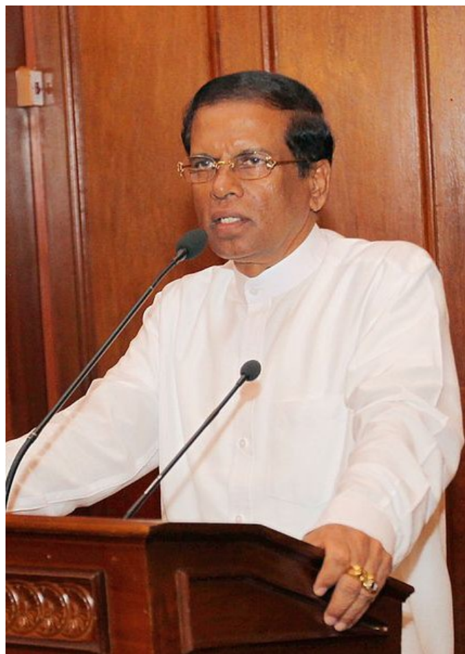
Prezident Maithripala Sirisena

V lednu 2015 však na Srí Lance proběhly prezidentské volby, které velmi překvapivě nevyhrál úřadující prezident Mahinda Rajapaksa, nýbrž s 51 procenty hlasů bývalý ministr zdravotnictví v Rajapaksově vládě