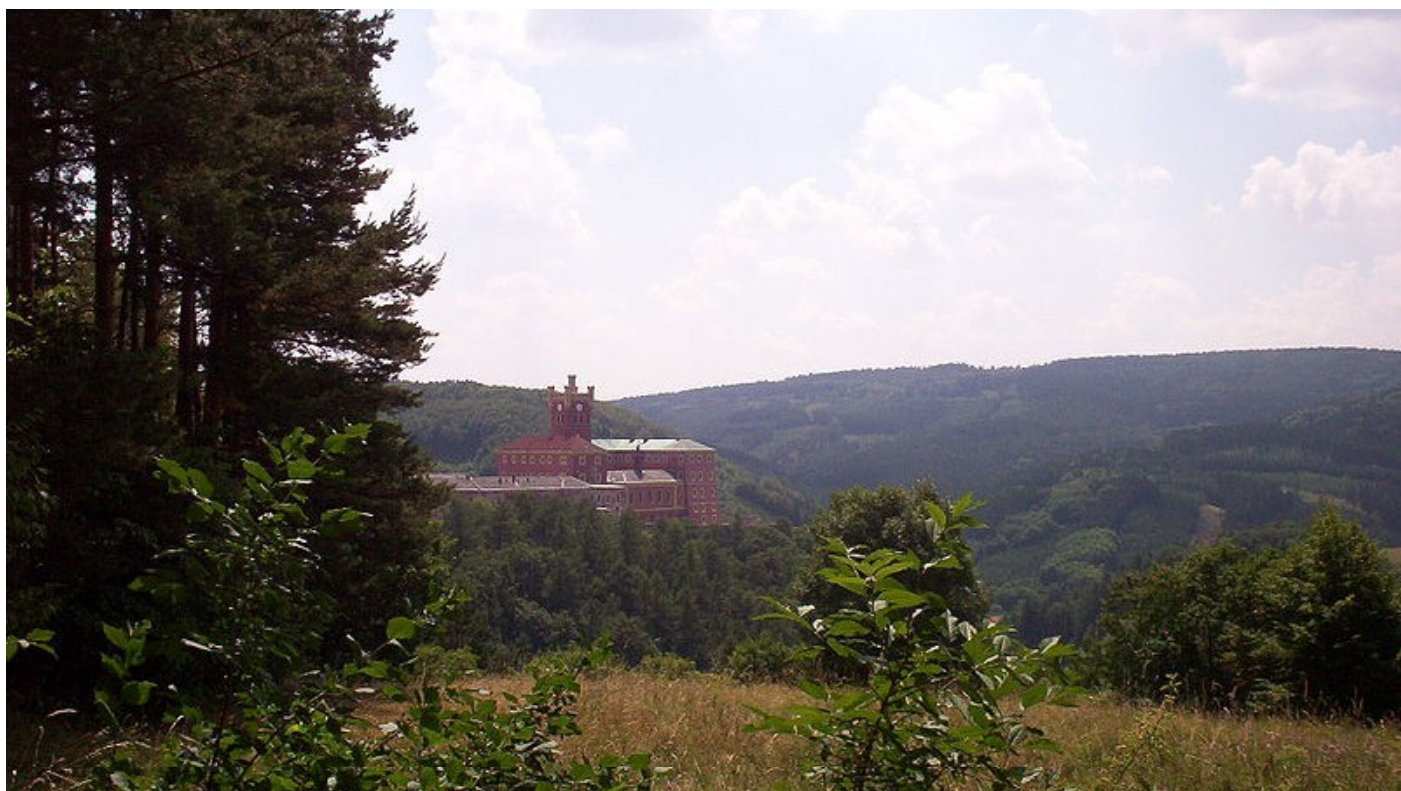
Věznice Mírov - odsouzenec ICTY budou možná i zde vykonávat svůj trest. [1]

[1] Věznice Mírov - odsouzenec ICTY budou možná i zde vykonávat svůj trest.