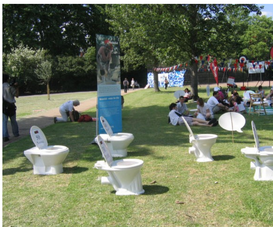
Kampaň pro zlepšení hygieny v rozvojových zemích [2]

[2] Kampaň pro zlepšení hygieny v rozvojových zemích.