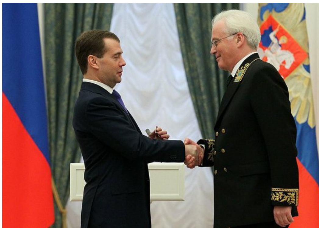
Tajemník Mezinárodního trestního soudu Herman von Hebel [1]

Některé světové watchdog organizace a think-tanky zabývající se lidskoprávní problematikou opětovně vyzývají ukrajinskou vládu, aby ratifikovala Římský sta-