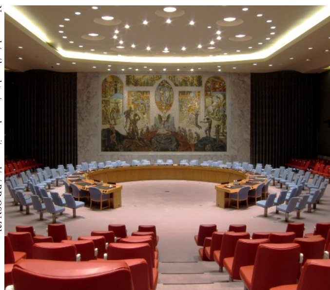
Newyorský sál, ve kterém se konají zasedání RB OSN [2]

[2] Newyorský sál, ve kterém se konají zasedání RB OSN, foto: Neptuul, Wikimedia Commons, CC-BY-3.0