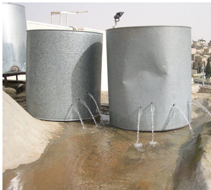
Zničené vodní nádrže v Palestině [1]

Vypořádat se s těmito výzvami lze podle expertů Světové banky posílením vládního sektoru, občanské participace a technické infrastruktury, což by mělo vést k celkovému zlepšení dodávaných služeb. Za jistých okolností může posílení lokálních vlád a jejich vztahu k občanům být důležitým krokem k zajištění přístupu k potřebným službám. Lokální politika bývá zpravidla méně ideologická, což by u praktických témat jakým jsou například dodávky vody mohlo být rozhodující.