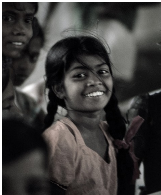
Tamilská dívka [3]