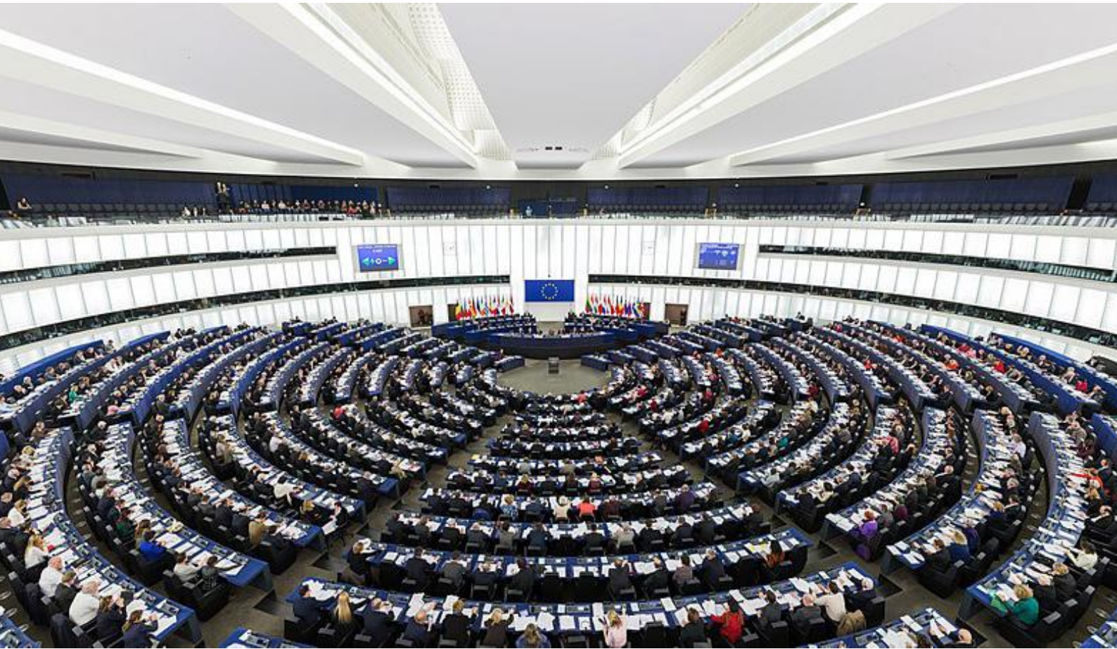
Sál Evropského parlamentu ve Štrasburku [2]