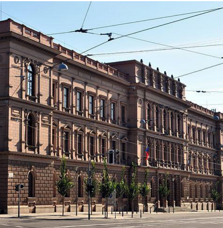
Ústavní soud [2]