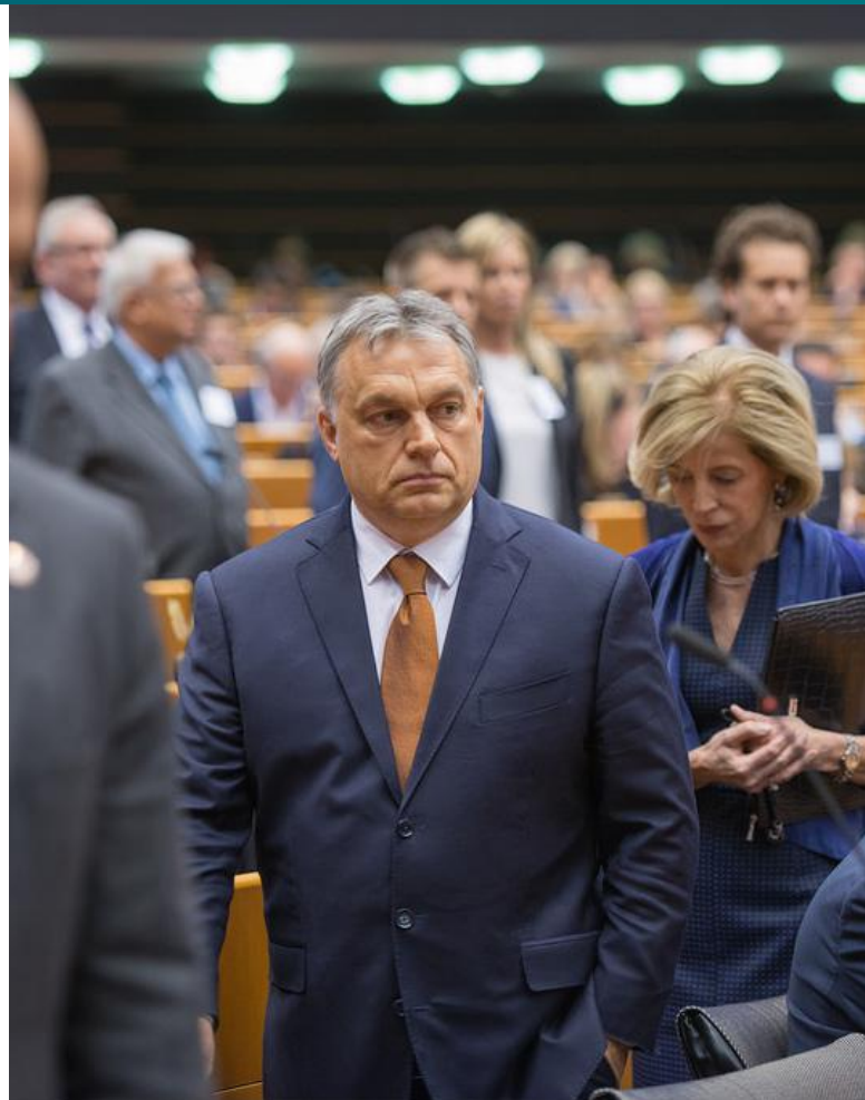
Maďarský premiér Viktor Orbán [1]

Mediální zákony však nejsou jedinou kritizovanou legislativní změnou v Maďarsku. V roce 2012 vstoupily v platnost taktéž kontroverzní úpravy maďarské ústavy, které silně omezují pravomoci centrální banky a ústavního soudu, jež již dříve některé ze