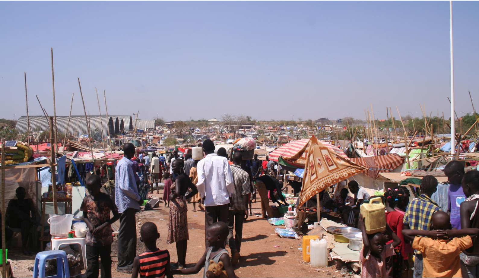
Humanitární krize v Jižním Súdánu [2]

ku a zhárství. Častým motivem bývá příslušnost k etnické skupině. Na základě informací Komise OSN a organizace Human Rights Watch existují důkazy o spáchání válečných zločinů a zločinů proti lidskosti.