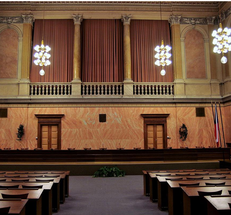
Ústavní soud ČR [3]

vykonání dvaceti let tohoto trestu. Odsouzený v době podání žádosti vykonal pouze 16,5 roku trestu, a proto obecné soudy jeho žádost považovaly za předčasnou, a tudíž ji ani meritorně nezkoumaly.