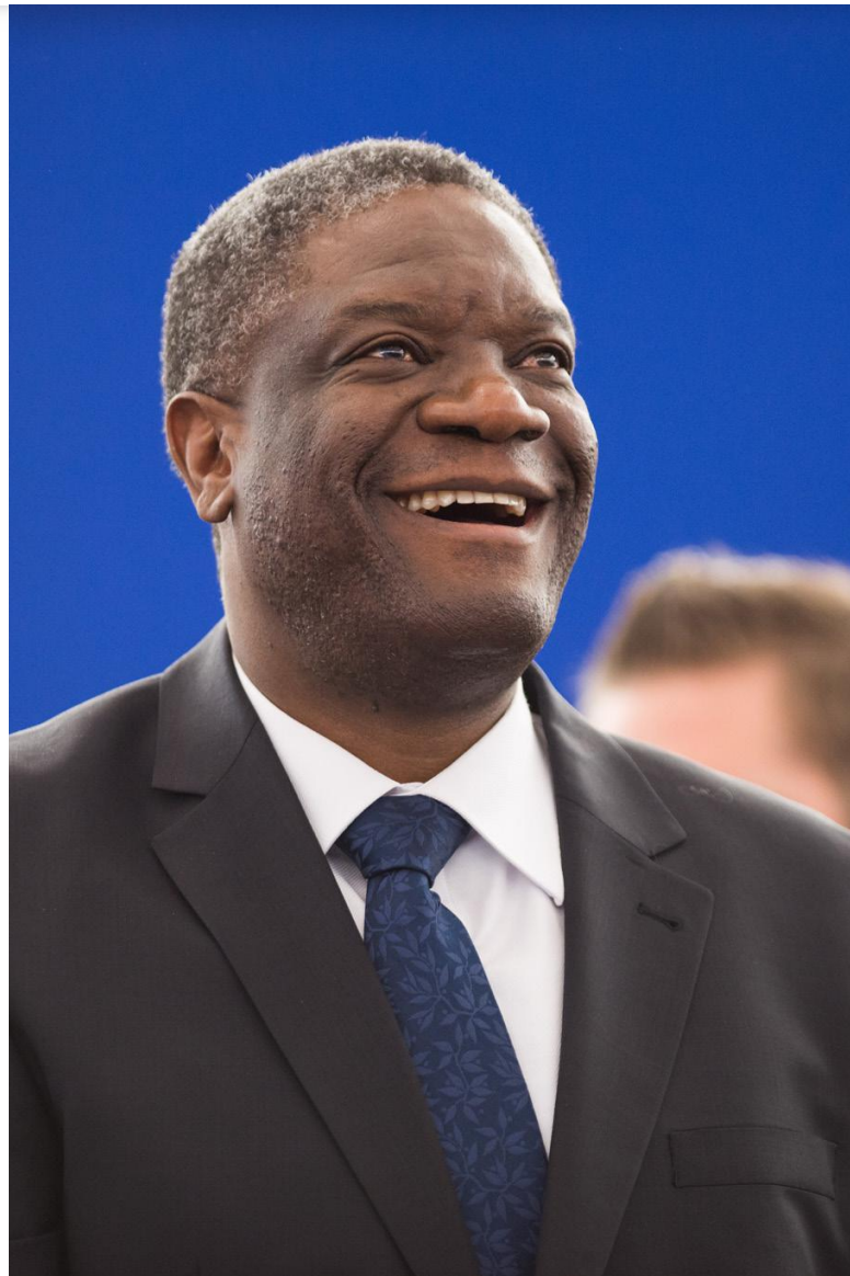
Doktor Denis Mukwege [1]

Když roku 1996 vypukla v DRK občanská válka, značnou část obětí tvořili i jeho pacienti. Mukwege sám na čas uprchl do Keni, poté se opět vrátil. Za pomoci švédské charitativní organizace a církevních příspěvků roku 1999 založil nemocnici Panzi ve městě Bukavu (v provincii Jižní Kivu, která byla jednou z nejvíce postižených válkou). Hlavním cílem bylo, a nadále je, vytvořit zázemí pro pomoc a léčbu ženám, na nichž bylo spácháno sexuální násilí. Jeho výskyt během války totiž značně vzrostl, stejně jako úmrtí žen během porodu, a to i několik let po válce. Válečná zranění tohoto typu totiž mnohdy zapříčiní problematický porod, v krajních