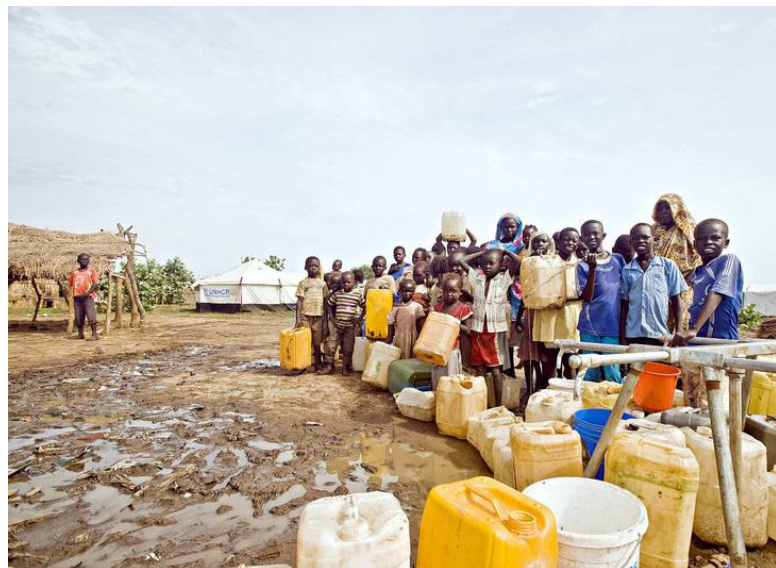
Fronta na vodu v uprchlickém táboře [3]

Hybridní soud předpokládá jak mírová dohoda z roku 2015, tak mírová dohoda letošní. Soud má být vytvořen Africkou komisí, výkonným orgánem Africké unie. Cílem ustanovení soudu je vyšetření a stíhání pachatelů zločinů podle mezinárodního práva a také podle práva jihosúdánského, které byly spáchány od 15. prosince 2013. Konkrétně zakládají obě mírové dohody věcnou příslušnost soudu pro zločin genocidy, zločiny proti lidskosti, válečné zločiny a další zločiny podle mezinárodního práva a práva Jižního Súdánu, včetně genderově motivovaných trestných činů a sexuálního násilí.