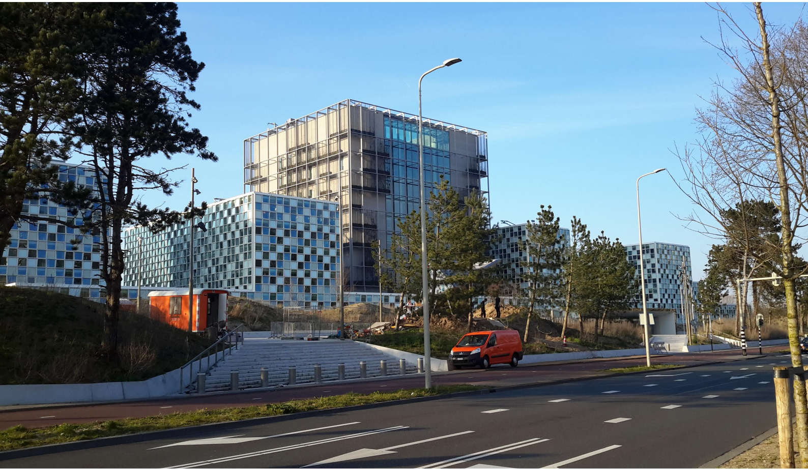
Sídlo Mezinárodního trestního soudu v nizozemském Haagu [2]

vat zločiny podle mezinárodního práva bez ohledu na místo spáchání, ne všechny země Římský statut MTS ratifikovaly. Toto fakticky omezuje možnost vyšetřování, vezmeme-li v potaz, že MTS má jurisdikci pouze nad zločiny spáchanými na území států či nad občany států, jež jsou smluvní stranou Římského statutu.