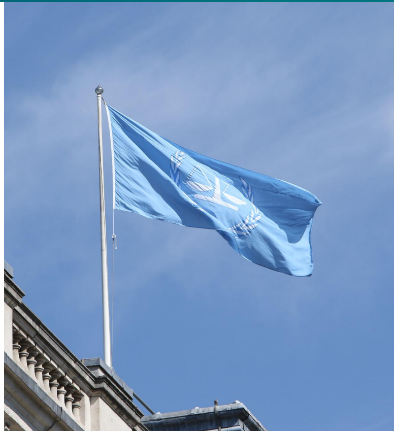
Vlajka Mezinárodního trestního soudu [1]

Dosud bylo před MTS zahájeno řízení ve věci 42 osob. Usvědčeno z nich bylo osm, přičemž v pěti případech se jednalo o ovlivňování svědků. Pouze ve třech případech byli dotyční odsouzeni za činy, které naplnily skutkovou podstatu válečných zločinů či zločinů proti lidskosti – tedy dvou kategorií, které společně se zločinem genocidy a zločinem agrese představují hlavní čtyři typy zločinů podle mezinárodního práva, jejichž potírání si Mezinárodní trestní soud klade za cíl.