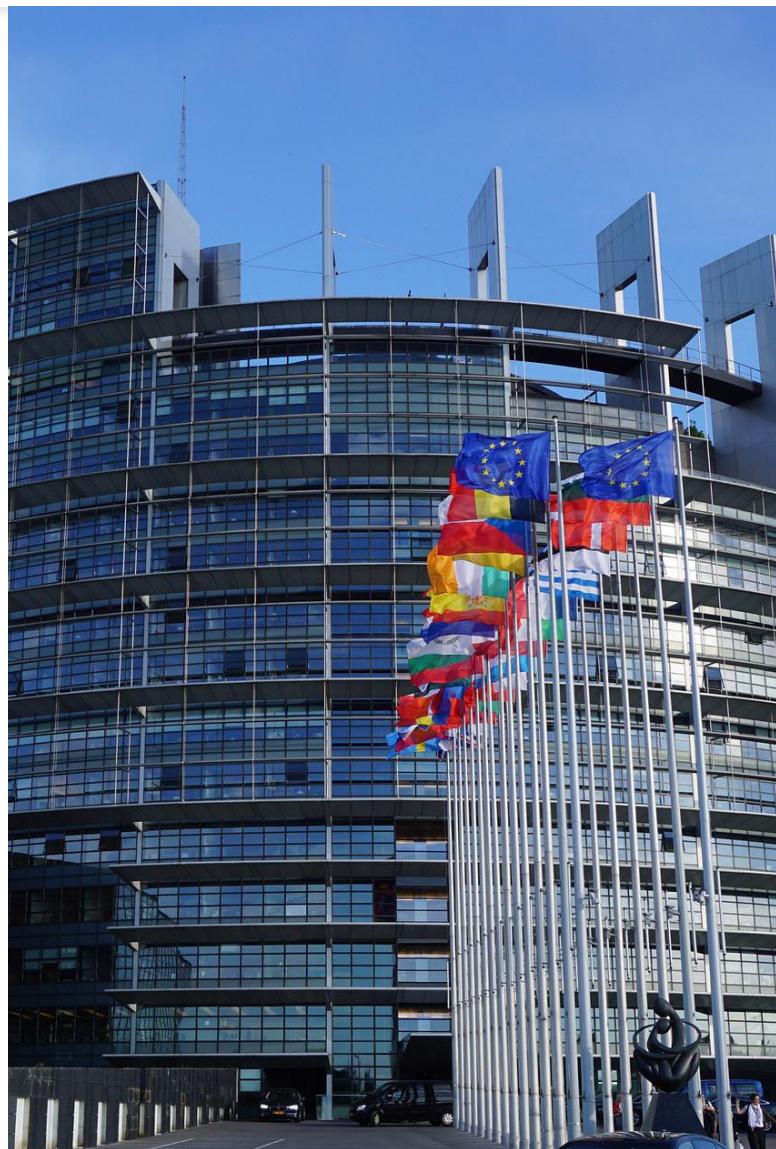
Evropský parlament ve Štrasburku [1]

Evropská suverenita byla jedním z klíčových slov Junckerova projevu. Weltpolitikfähigkeit, tedy schopnost Evropy hrát jakožto Unie roli při utvá-