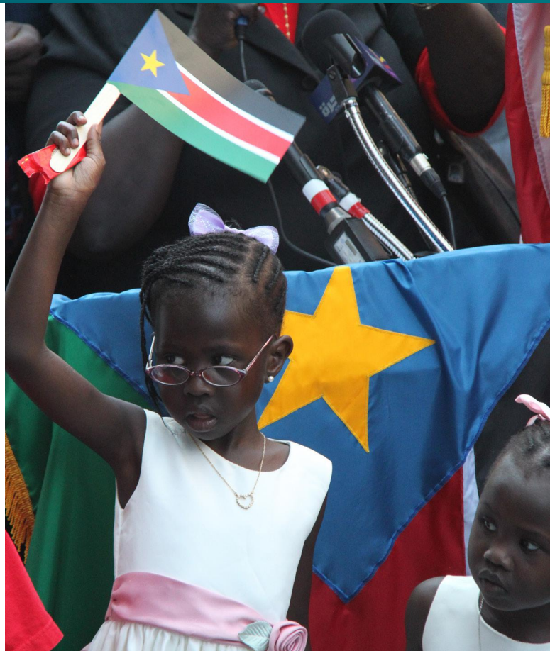
Dívka držící Vlajku Jižního Súdánu

V polovině září tohoto roku byla po 15 měsících vyjednávání uzavřena druhá mírová dohoda. Riek Machar, momentálně žijící v exilu, se má dle dohody vrátit do země a znovu nastoupit na pozici viceprezidenta. Podle vedoucího Mise OSN v Jižním Súdánu je však nejslabším místem mírové dohody nedůvěra mezi stranami, která může komplikovat její implementaci.