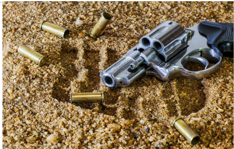
Ilustrační foto [4]

Závěrem je třeba uvést, že případ Františka Müllera se zdá být mezi téměř 50 českými vězni odsouzený-