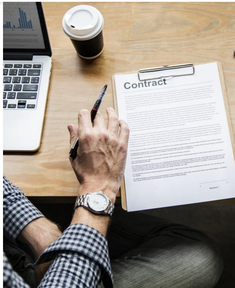
Ilustrační foto [1]

Stěžovatelka odmítla předat advokátovi listinu s nepravdivým údajem, a okresní soud tak její žalobu zamítl. Advokát na pokyn své klientky podal proti rozhodnutí okresního soudu odvolání ke Krajskému soudu v Praze (dále jen „krajský soud“). Opětovně vyzval svou klientku, aby podepsala další antedatovanou smlouvu, podle které by mohla stěžovatelka vymáhat postoupenou pohledávku svým jménem, avšak na účet společnosti, na kterou byla pohledávka postoupená. Stěžovatelka smlouvu nepodepsala, a krajský soud tak kvůli chybějící aktivní legitimaci stěžovatelky potvrdil rozhodnutí okresního soudu.