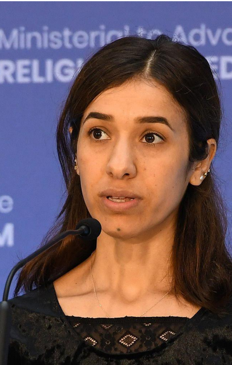
Nadia Murad [3]