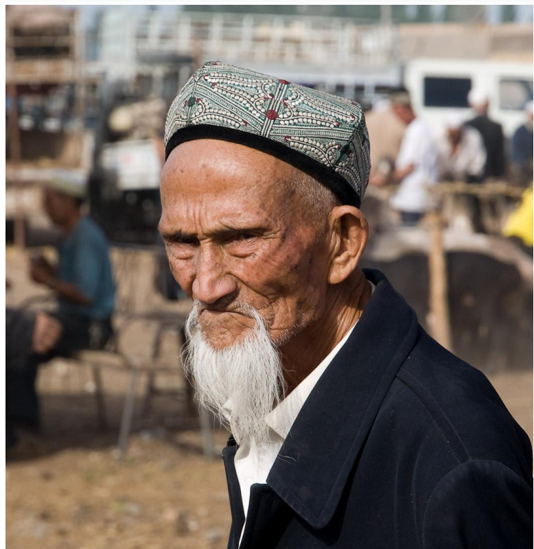
Muž ujgurského etnika [1]

Kritické hlasy proti Pekingu se začaly ozývat poté, co Organizace spojených národů zveřejnila zprávu, podle které se v čínských internačních táborech nachází až 1 milion osob původem ze Sin-ťiang. Mezi těmito internovanými osobami najdeme příslušníky mnoha etnických skupin, které vyznávají převážně islám. Jedná se hlavně o Ujgury a Kazachy, ale najdeme zde i další menšiny. Lidskoprávní aktivisté, výzkumní pracovníci a média dokumentují hromadná zatýkání a pronásledování muslimů, jejichž výsledkem je potlačení kulturního a náboženského života v Sin-ťiang.