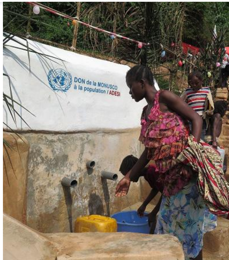
Zdroj pitné vody v provincii Západní Kasai [3]