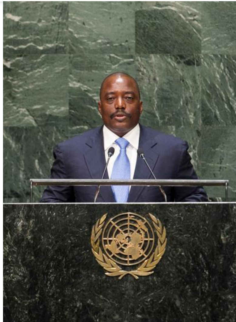
Prezident Joseph Kabila [1]

Vzhledem ke vzdálenosti od centrální vlády v Kinshase se v oblasti projevuje významný společenský vliv lokálních autorit. Pravomoci týkající se místní správy jsou svěřeny klanovým vůdcům, kteří navíc vykonávají řadu soudních a též spirituálních funkcí. Dle tradic jsou vůdci jmenováni bez zásahů ústřední administrativy, bez jejího souhlasu však nejsou za výkon své funkce finančně odměněni. S potřebou formálního potvrzení nicméně postupně mizí politická nezávislost klanových vůdců, kteří jsou nuceni spolupracovat s vybranými politickými stranami, ať už na provinční nebo celostátní úrovni.