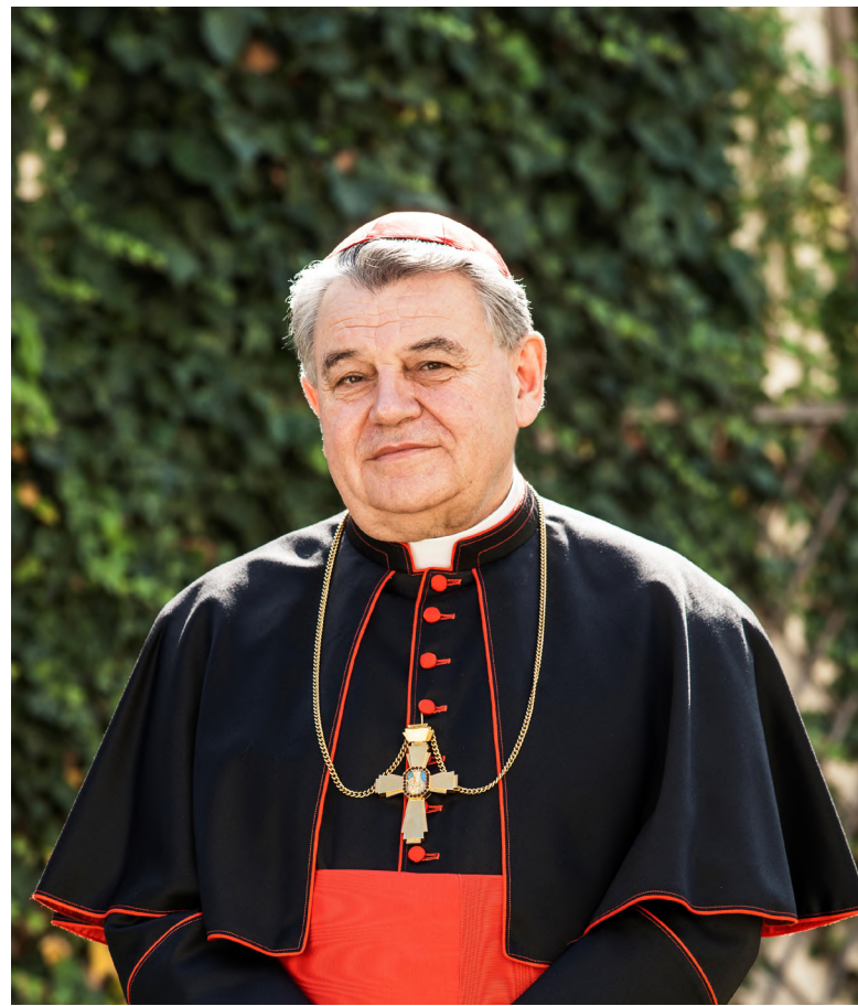
Kardinál Dominik Duka [1]

Na základě trestního oznámení podaného v tomto roce pracovníkem Národního ústavu duševního zdraví policie prošetřuje případ opavské psychiatrické nemocnice, v níž měla být pacientka trpící těžkou formou autismu dlouhé roky kurtována k lůžku. „Chci vědět, zda je na psychiatrii možné dělat komukoliv cokoli, nebo jestli to podléhá trestnímu právu. Když bych tohle udělal psovi, tak je to trestné,“ uvedl oznamovatel.