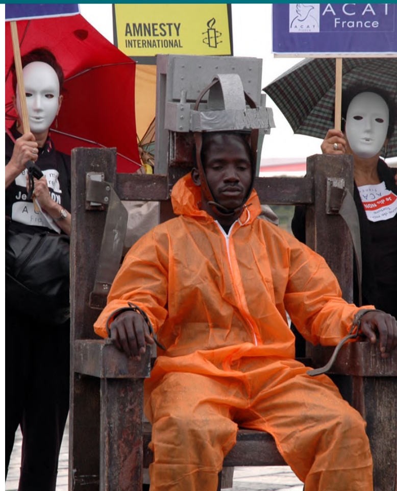
Demonstrace proti trestu smrti [1]

Trestem smrti se rozumí státem nařízená poprava za nejzávažnější trestné činy v rámci daného státu. Dlouhodobým trendem je jejich postupný zákaz napříč zeměmi. Více než 170 států na světě trest smrti již zrušilo. Tento rok tak učinily Papua-Nová Guinea, Středoafrikácká republika a Rovníková Guinea. Navzdory tomuto trendu se v minulém roce