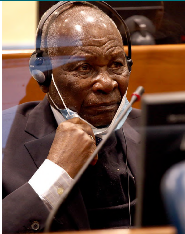
Felicién Kabuga v soudní síni [1]

V roce 1959 propuklo v zemi násilí, při kterém emigrovali statisíce Tutsiů do exilu, Hutuové svrhli tutsijského krále, vyhlásili republiku a tři roky poté schválili v referendu nezávislost, kterou uznala i Belgie. Tím se Rwanda stala suverénním státem. Během následujícího období byli Tutsiové vytlačováni z veřejného života a jejich místo zabírali Hutuové.