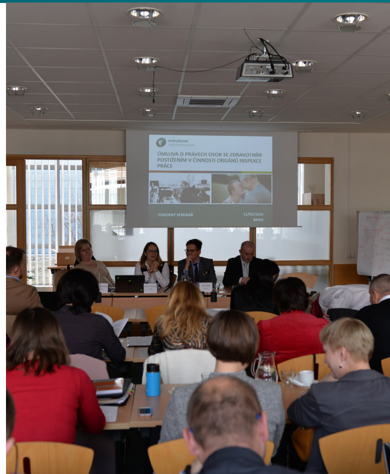
Jednání odboru CRPD [1]

Opční protokol [3] zakládá jednotlivcům možnost obracet se na Výbor OSN pro práva osob se zdravotním postižením (dále jen „Výbor“).[4] Stížnost každého individuálního jedince je následně Výborem přezkoumávána.[5]