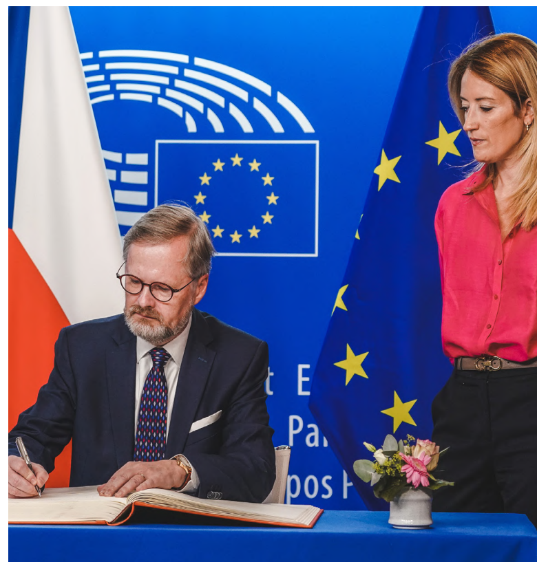
Petr Fiala a předsedkyně Evropského parlamentu Roberta Metsola [5]