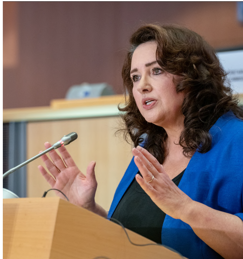
Helena Dalli [1]

Vystoupila jste také na konferenci předsednictví o integraci osob se zdravotním postižením na trh práce. V čem vidíte hlavní překážky v této oblasti? Jaké plány má Evropská komise na řešení diskriminace osob se zdravotním postižením nejen na trhu práce, ale i v každodenním životě?