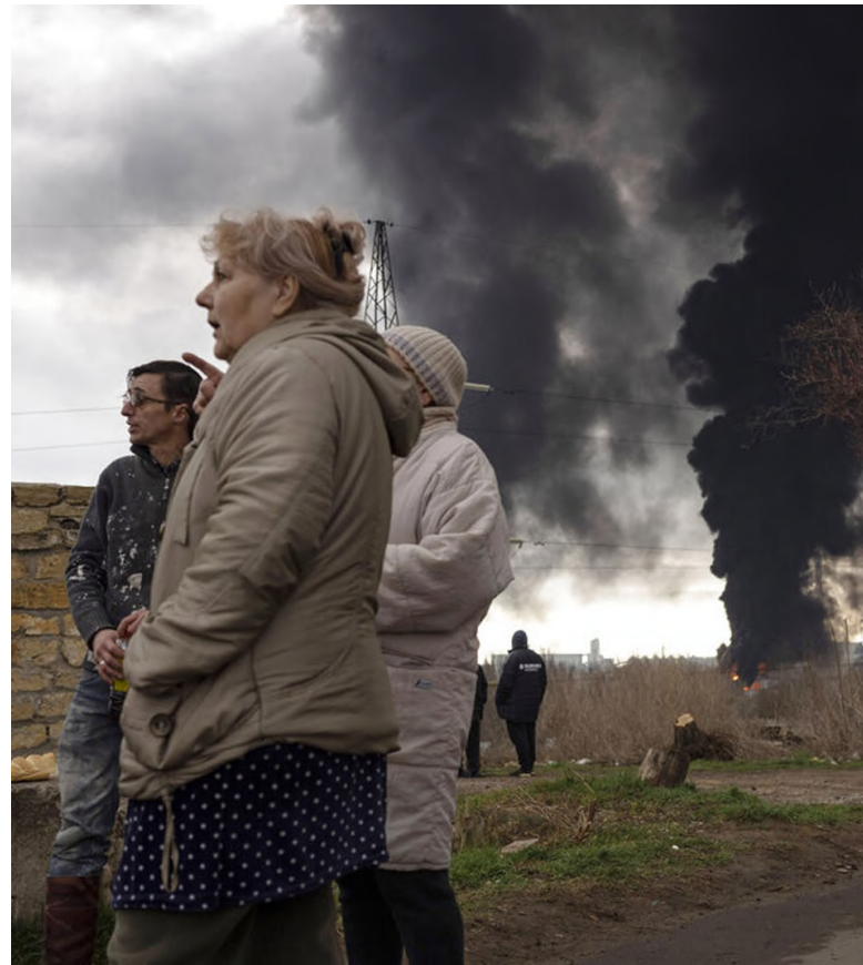
Ostřelování Oděsy [1]

Dochází k zadržováním a násilným mizením zástupců místních orgánů, novinářů či občanských aktivistů. OHCHR zdokumentoval 407 případů nuceného zmizení, které mají na svědomí ruské ozbrojené síly a přidružené ozbrojené skupiny. Z těchto osob bylo nakonec nalezeno 18 mrtvých. OHCHR rovněž zdokumentoval 47 případů svévolného zatčení a 31 případů nuceného zmizení, které lze přičíst ukrajinským orgánům. Oběťmi byly osoby podezřelé z poskytování podpory Rusku.