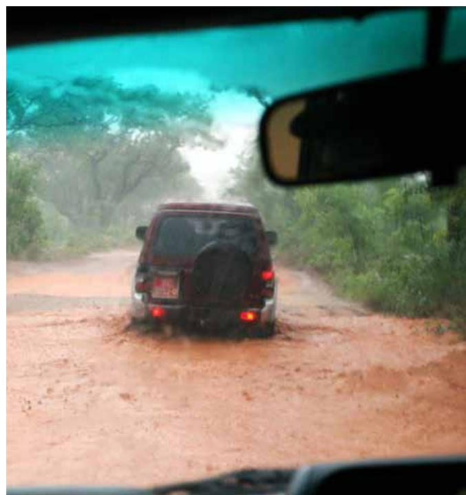
Cestou z Kankan do Mandiana, Guinea

Jenže i samotná OSN uznává, že mnohé rozvojové státy si ve snaze získat mezinárodní uznání svých budoucích vlád volí ty nejdražší metody voleb a ty pak nedokáží financovat. Cena voleb stoupá s každou položkou: vlády mu-