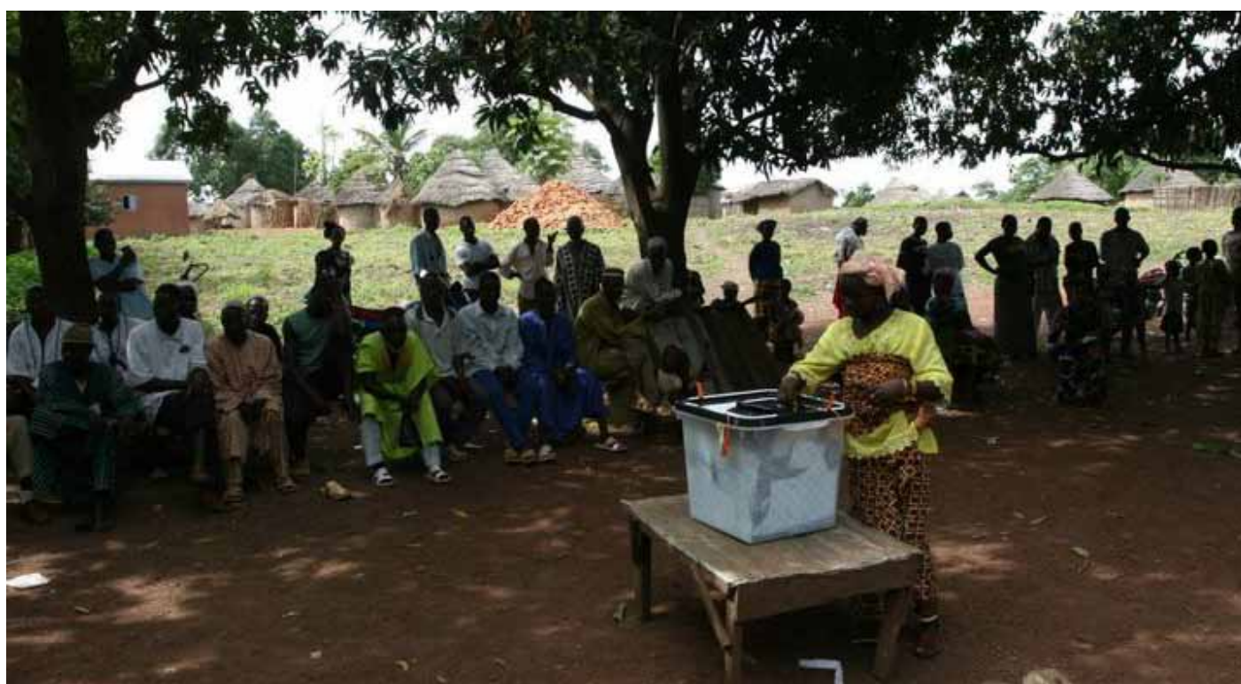
Volby v Guineji