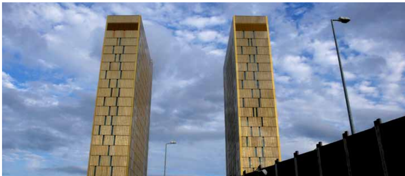
Soudní dvůr EU, Lucemburk