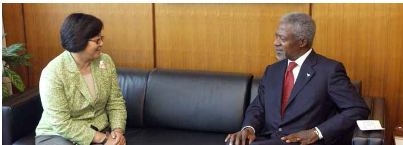
Prezidentka Kyrgyzstánu Roza Otunbajevová a bývalý Generální tajemník OSN Kofi Annan