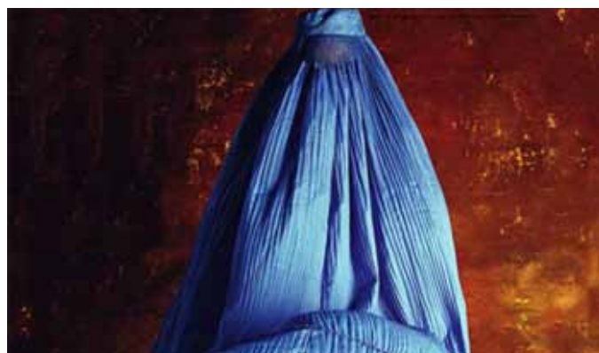
burka