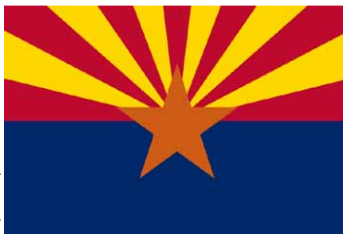
Vlajka Arizony