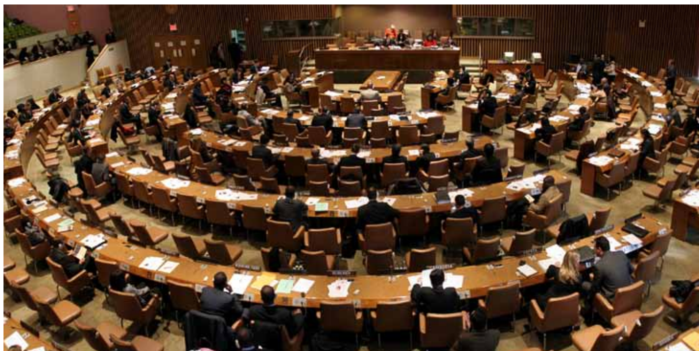
ICC conference room

- Gordon, Greg: A view of the aggression amendments from Kampala. Opinio Juris , 15. 6. 2010 ( http://opiniojuris.org/2010/06/15/greg-gordon-on-the-review-conference-and-aggression ).