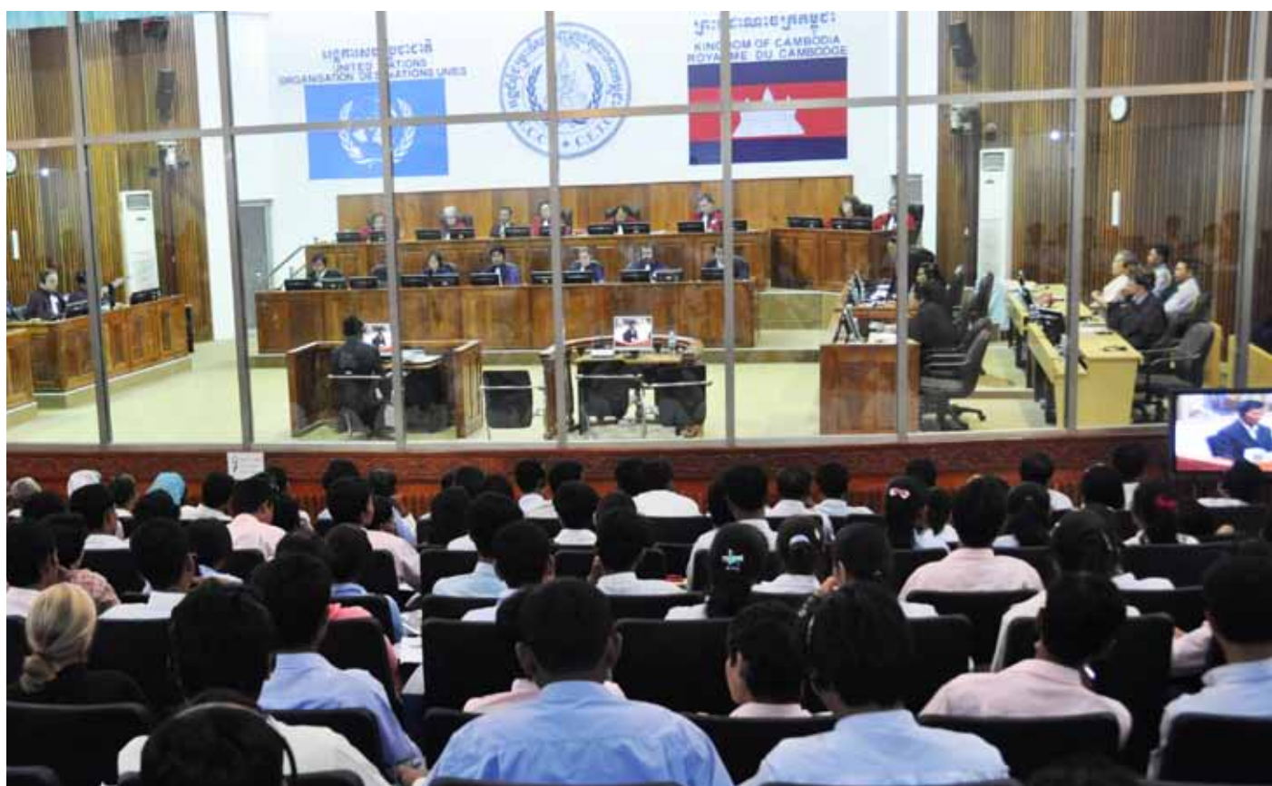
The Extraordinary Chambers in the Courts of Cambodia

- Keller, Kevin Jon: The ECCC Issues a Landmark Decision on JCE III. Opinio Juris , 23. 5. 2010. ( http://opiniojuris.org/2010/05/23/the-eccc-issues-a-landmark-decision-on-jce-iii/ )