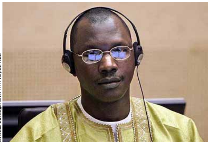
Thomas Lubanga

- http://www.icc-cpi.int/NR/exeres/100143A4-12B2-473C-A228-50509C2CE9D3.htm