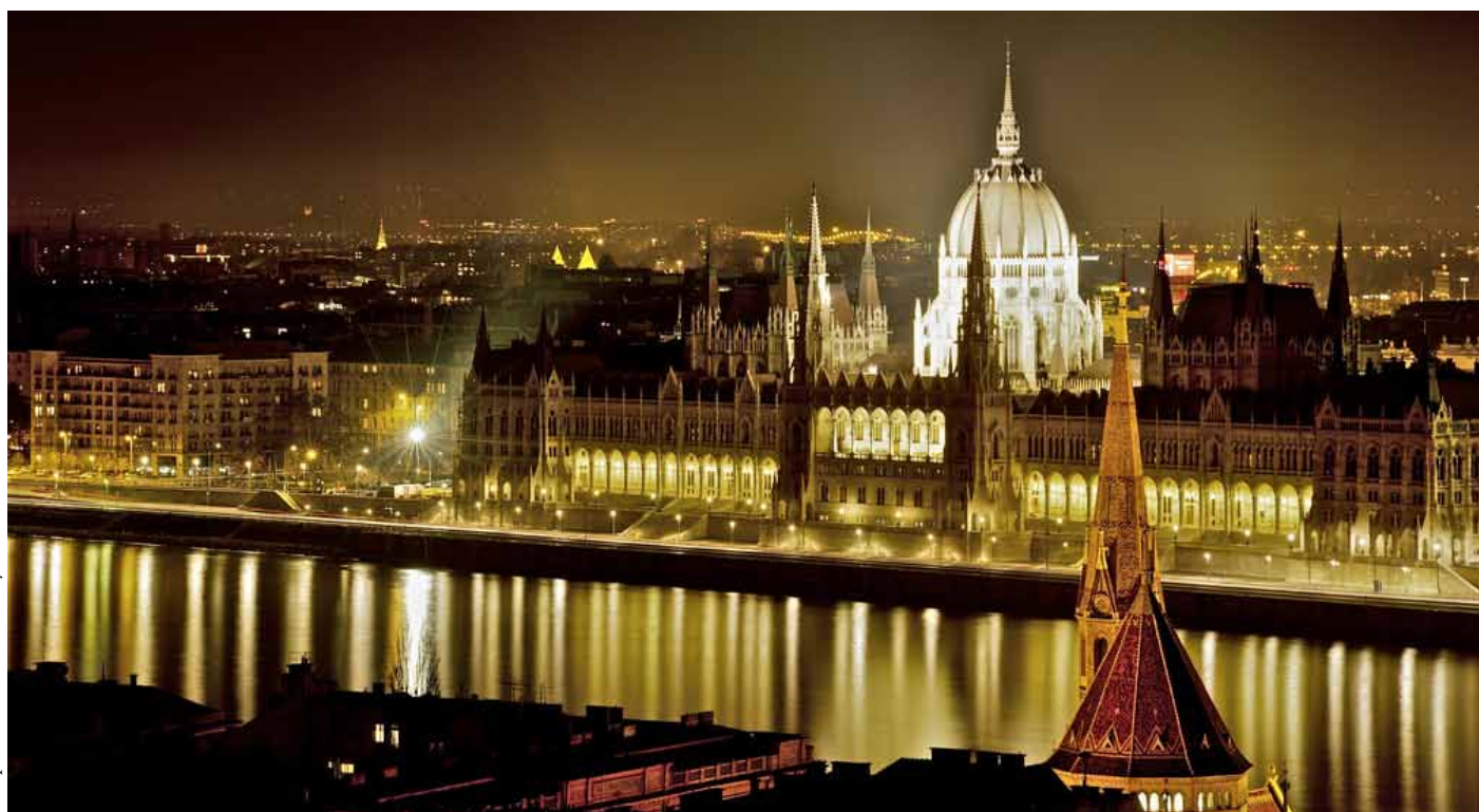
Budapešť, foto: Flickr - BeetchyB

http://web.ceu.hu/legal/prosp_students.html