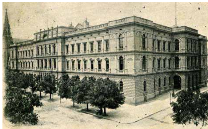
Ústavní soud ČR

Dále se stěžovatel odvolává na Úmluvu o právech osob se zdravotním postižením . Je třeba připomenout, že 12. února 2010 k ní přistoupila ČR a dle čl. 10 Ústavy má úmluva aplikační přednost před nesouladnými vnitrostátními normami. Tato úmluva chrání osoby se zdravotním postižením před všemi druhy diskriminace a pokrývá občanská, politická, ekonomická, sociální a kulturní práva. Zavazuje smluvní strany nejenom k přijetí zákonů a nařízení dodržujících tento princip, ale také k zajištění toho, aby v praktickém životě docházelo k lepší integraci zdravotně postižených lidí do společnosti. 2