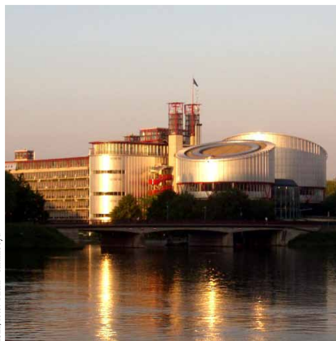
ESLP