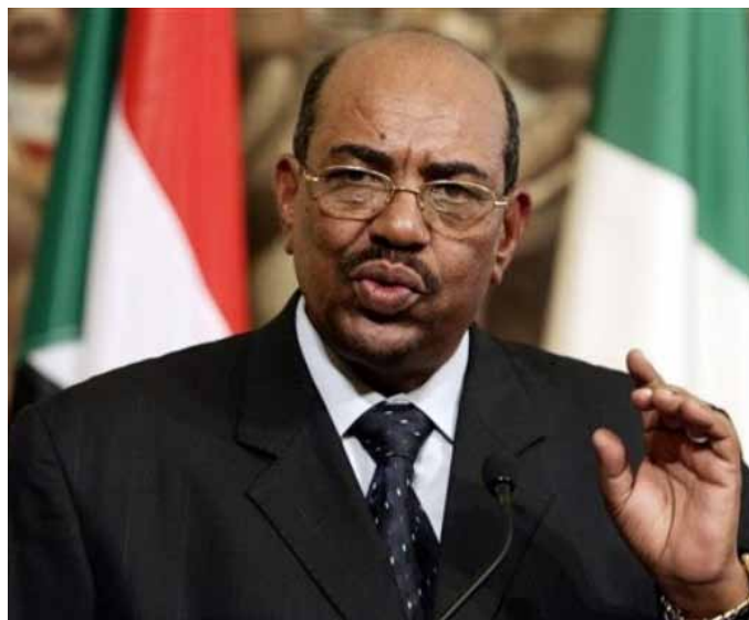
Al Bašír

Amnesty International zostavila pri príležitosti volieb v roku 2006 odporúčanie obsahujúce požiadavky na kandi-