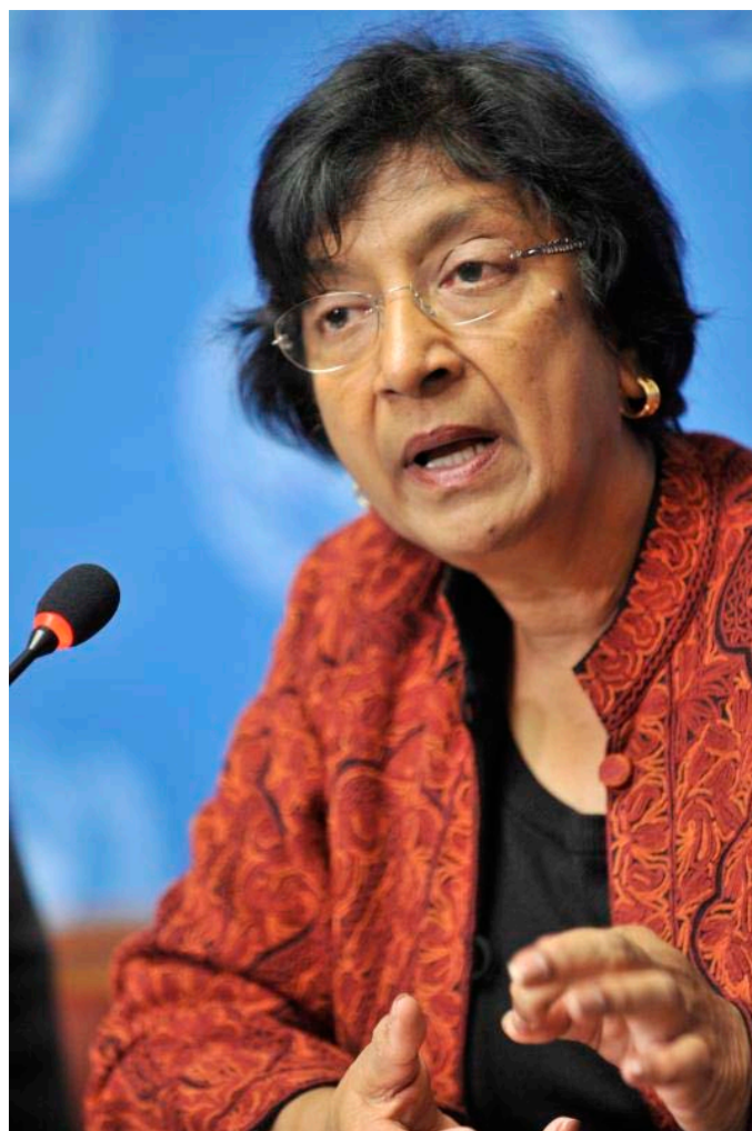
Nejvyšší komisařka OSN pro lidská práva

[4] Rusko, které v minulosti v Radě bezpečnosti OSN vetovalo všechny protisyrské rezoluce, nyní překvapilo vlastním návrhem vyzývajícím k okamžitému ukončení násilností a k respektování svobody slova a shromažďování. Specifikem tohoto návrhu je skutečnost, že za násilí v Sýrii přikládá stejnou vinu oběma stranám a že nepředpokládá zavedení jakýchkoli sankcí.