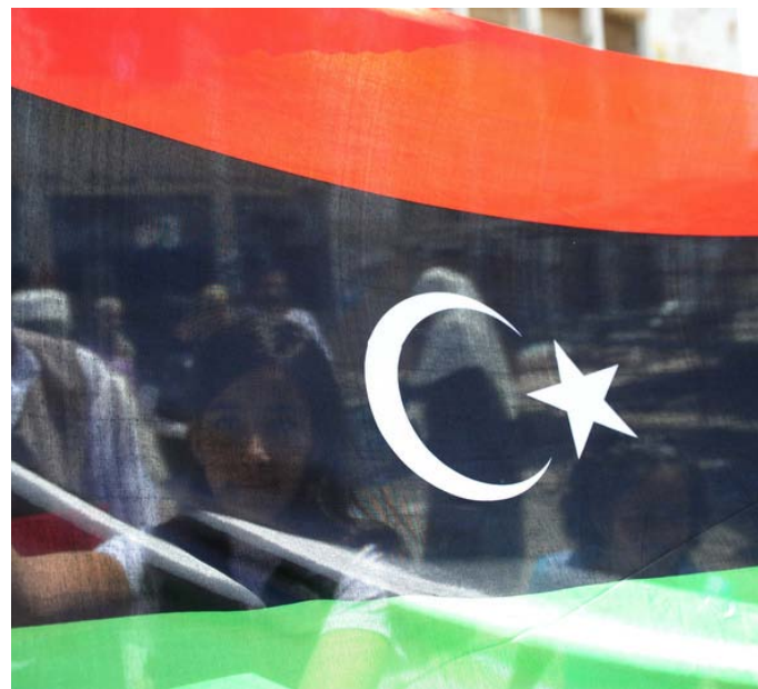
Autor: Annmar Abd Rabbo

V prizmatu transitivní spravedlnosti a demokracie je Rwanda neúspěchem. V žádném případě se nejedná o silnou a efektivní demokracii. Opozice je utlačována a třeba jen samotné tázání se po roli Kagameho jednotek během genocidy v roce 1994 může vyústit v trest. Lidskoprávní standardy, jako politická práva a svoboda projevu, nejsou aplikovány. Lidé jsou zavražďováni a probíhá až příliš mnoho politických procesů. Ale třeba ani Kosovo není o mnoho lepší. V těchto společnostech stále dominuje tradiční „vítěz bere vše“, což je pro demokracii velice nebezpečné. Demokracie totiž ukazuje svoji sílu tím, jak přistupuje k menšinám, znevýhodněným skupinám a demokratické opozici.