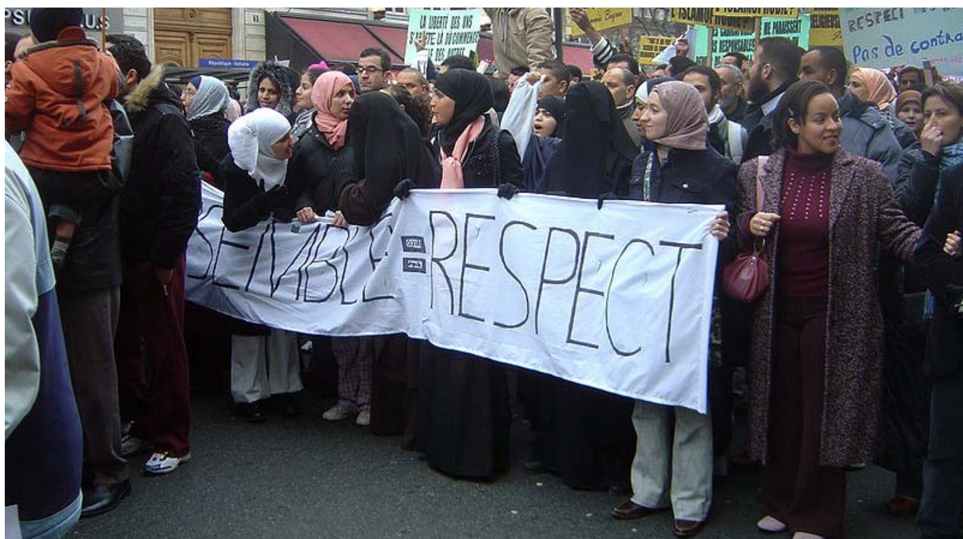
Pařížanky protestující proti publikaci karikatur Mohameda | Autor: David Monniaux

Velký problém spatřuji v oblasti politiky imigrantů a žadatelů o azyl. Dánsko v tomto směru základní lidská práva nerespektuje. Dánsko bylo vždy velmi liberální a pokrokové, co se týče kupříkladu genderové rovnosti, práv homosexuálů apod. Ale má velmi uzavřené hranice a striktní podmínky pro získání občanství nebo práva na pobyt. Očekával bych, že se tento stavlepší po výhře levicové strany v zářijových volbách. Předchozí pravicová vláda vytvořila dvojí sociální systém, který spočívá v rozdílu mezi sociálními výhodami pro zde narozené občany a pro imigranty. To je velmi nespravedlivé a navíc vytváří mezi imigranty velkou chudobu. Myslím si, že nová vláda tyto zákony změní.