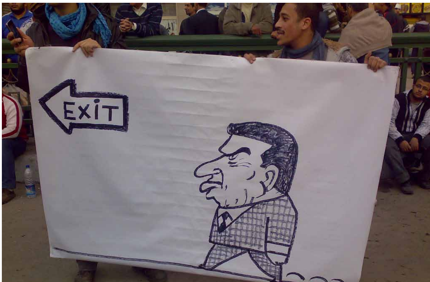
Demonstrace v Egyptě

Vlna nepokojů zachvátila na počátku února 2011 také Jordánsko, kde vypukly střety mezi provládními a protivládními přívrženci. V Jemenu se konal pochod k uctění usmrcených z předchozích dní a lidé žádali konec vládnutí prezidenta Ali Abdulláha Saleha, který stojí v čele země 32 let. Demonstrace se konaly i v ulicích Manamy, hlavního města Bahrajnu, kde nespokojenost šíitské většiny s vládou sunnitskou elitou dosáhla kritického bodu a lidé se i přes sliby krále al Khalífa vydaly do ulic. Dosaďadním výsledkem je propuštění politických vězňů.