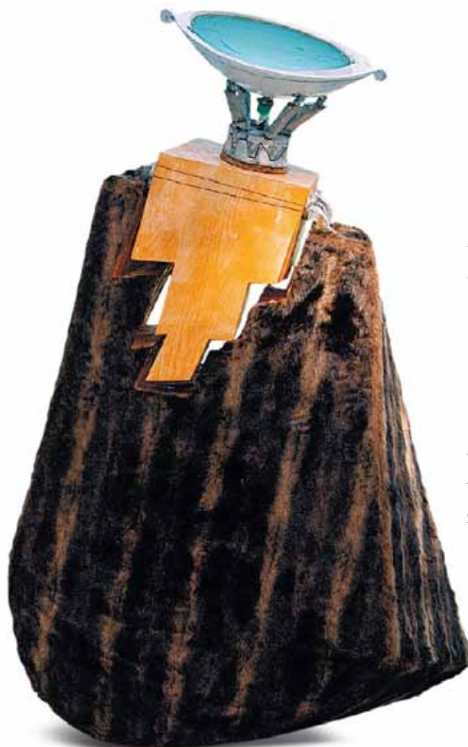
Mrdjan Bajic, „To breathe and to drink“, spirky Rady Evropy, foto: RE.

Evropský soud pro lidská práva tak hned v úvodu svého odůvodnění přisvědčil švýcarskému federálnímu soudu, že projednávaná věc se netýká práva zemřít (jež je im-