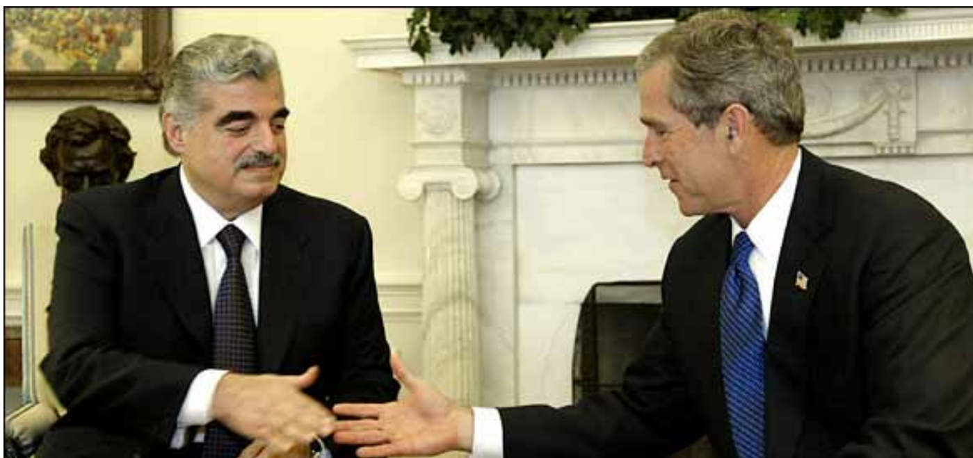
Rafik Hariri a G. W. Bush

2) Předseda Zvláštního tribunálu pro Libanon Antonio Cassese je dlouhodobým zastáncem takového postoje – rozhodnutí Odvolací komise v této otázce proto nelze považovat za příliš překvapivé.