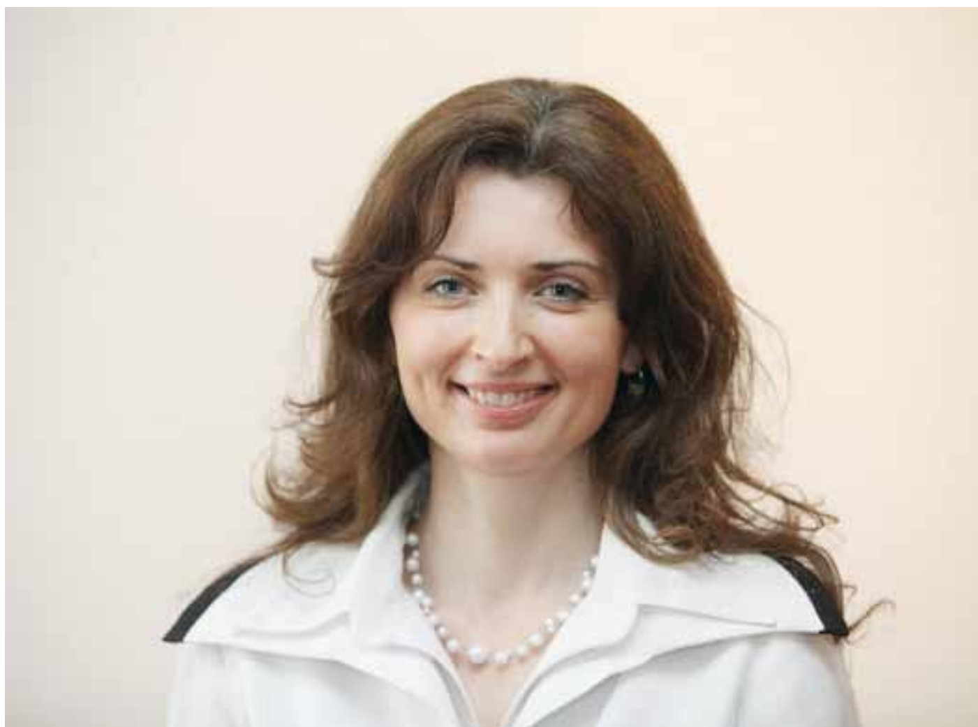
Monika Šimůnková

- Vláda ČR, http://www.vlada.cz/cz/media-centrum/predstavujeme/vladni-zmocnenkyne-pro-lidska-prava-monika-simunkova-81284/tmplid-47/ .