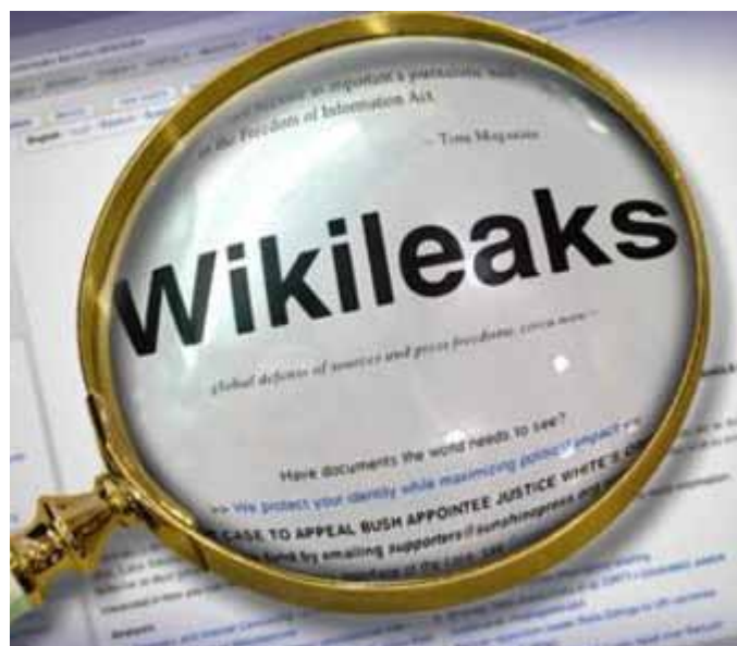
Wikileaks

Je teraz otázne, ako dopadne rozhodnutie odvolacieho senátu a aké dôsledky bude mať pre prípad. Pokiaľ potvrdí odmietnutie celého podania, obhajoba bude de facto vylúčená a prípad uzatvorený bez jej ďalšej účasti. Takýto postup je však nebezpečný z hľadiska dodržania Taylorovho práva na spravodlivý proces, ktoré je napríklad podľa disentu sudkyne Sebutinde silnejšie než procedurálne nastavenie lehôt. Rozhodnutie sudcov nebolo skutočne práve šťastné – bez ohľadu na výsledok výroku odvolacieho senátu sa prejaví zdržaním celého procesu. Okrem toho, istá diskrepcia pri oneskorení prijímaní podaní nie je na medzinárodných tribunáloch, a ani v praxi samotného SCSL, až tak zriedkavá. Stojí za úvahu, či má Súd skutočne záujem poznačiť svoj úplne posledný a najdôležitejší prípad pochybnosťami o spravodlivosti a transparentnosti jeho priebehu.