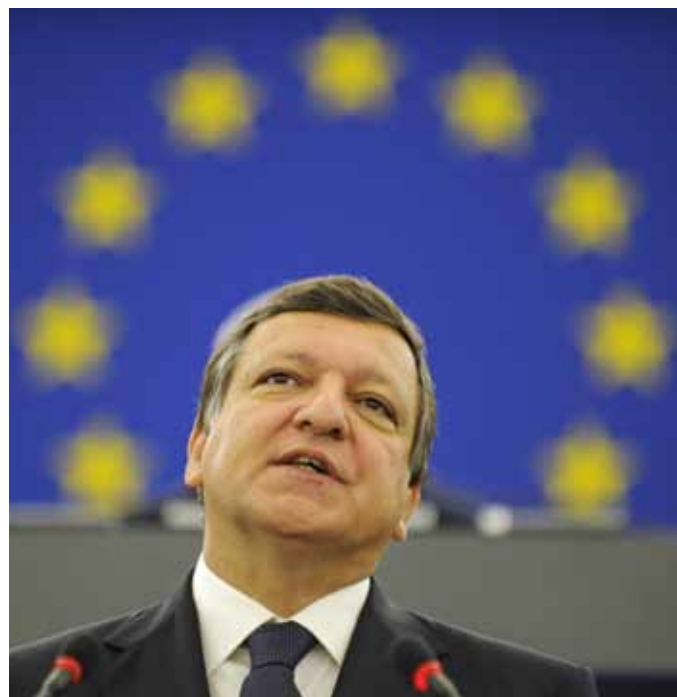
José Manuel Barroso, předseda Evropské komise