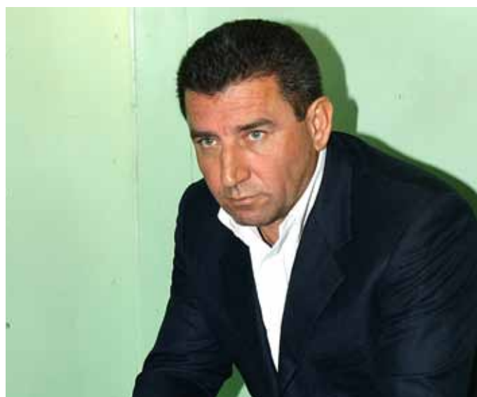
Ante Gotovina

Mezinárodní politologický ústav MU a Fakulta sociálních studií vás ve spolupráci s Konrad-Adenauer-Stiftung, zastoupení v Praze, a s mediální podporou zpravodajského webu Česká pozice, zvou na další ročník Brněnského politologického sympozia. Akce se uskuteční 4. května 2011 v Aule na Fakultě sociálních studií v Brně. Ústředním tématem letošního ročníku jsou „Zájmy v české politice“. Na úvod vystoupí významný host, německý profesor Peter Lösche, který se zaměří na otázku lobbyingu jako potenciálního ohrožení parlamentní demokracie (tlumočení bude zajištěno). Pak budou následovat dva konferenční panely a jeden panel diskusní. Registrovat se můžete na adrese registrace@iips.cz . Další podrobnosti a program na www.iips.cz .