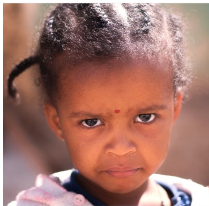
Eritrejské dítě [1]

Právo na spravedlivý proces je velice často porušováno, v trestněprávní oblasti se eritrejské orgány neřídí ani základními zásadami, vyšetřovatelé a vojenští vůdci vystupují často zároveň v roli soudců. Celý soudní systém je ve Zprávě popsán jako závislý na vládě a neschopen zaručovat dodržování a ochranu lidských práv eritrejských obyvatel.