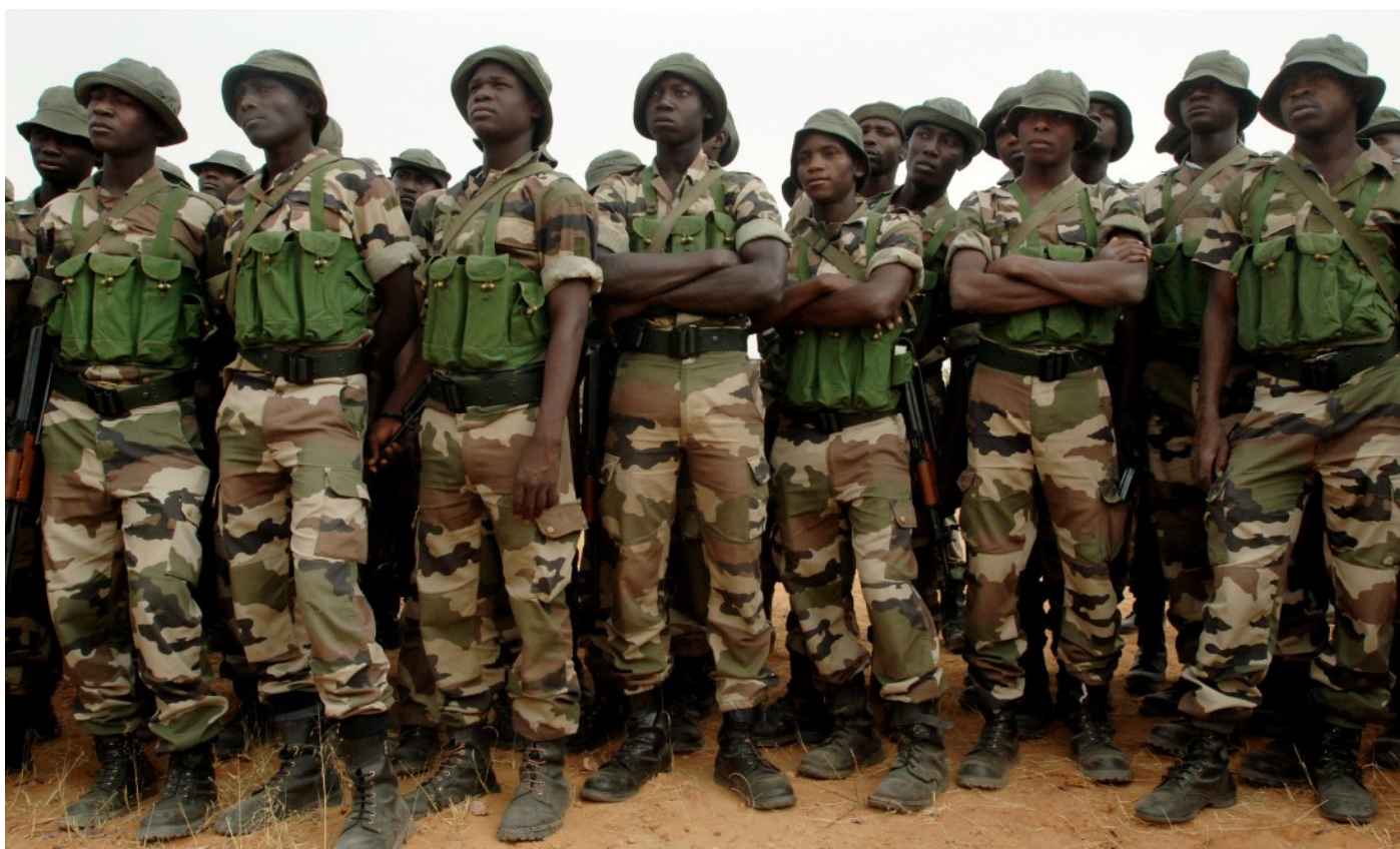
Nigerijská vojska při společném cvičení Flinthook s americkými vojáky v roce 2007 [1]

Dostupné důkazy (zejména interní vojenské dokumenty) podle AI jasně vypovídají o tom, že vrchní armádní velení bylo pravidelně informováno jak o aktuálních operacích proti Boko Haram na severovýchodě země (v rámci nichž byli zabíjeni nevinní lidé), tak o situaci ve věznicích. Z toho vyplývá, že generálové věděli, nebo měli podle všeho vědět o tom, co se děje. I přesto však nepodnikli žádné kroky, které by zásadním způ-