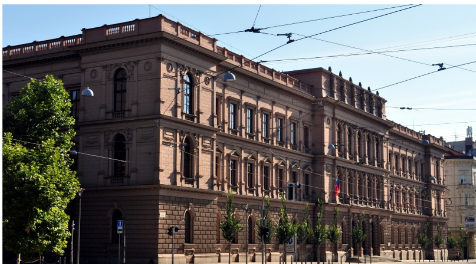
Ústavní soud [1]

[1] Ústavní soud, foto: Millenium 187, CC-BY-SA-3.0