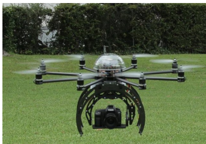
Dron nesoucí kameru [1]

Jak však také Komise připustila, problém vězí v dosud nedostatečné legislativě upravující používání dronů. Za stávající situace by zasahování do práva na soukromí a práva na ochranu dat v důsledku užívání dronů nebylo nic výjimečného. Do širokého rámce úkolů, k nimž lze drony využít, spadá totiž i shromažďování osobních údajů. Zejména v oblasti monitoringu, dohledu, mapování či videozáznamů vyvstává potřeba regulace právě v souladu s ochranou základních práv nejvýrazněji.