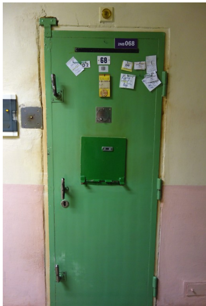
Ústav pro výkon zabezpečovací detence Brno [2]

Vedení věznice a Ústavu se tedy o obviněních ze zasměšňování chovanců poprvé dozvědělo až v den vydání zprávy. Plukovník Gáč se dokonce domnívá, že řada obvinění mohla vzniknout chybami při překladu: „Vezměte si, že delegace, která sem dojde, neumí česky. Rozhovor mezi chovanci a delegací je zprostředkováván tlumočníky, které si delegace zařídila. Celková zpráva je pak poslána v anglickém jazyce, a proto je nutný další překlad do češtiny. Je snadné, aby při překladech došlo ke zkreslení.“ Je pravdou, že ve prospěch tohoto vysvětlení svědčí také skutečnost, že v Ústavu se nachází chovanci, kterým mnohdy pro jejich nemoc nelze pořádně rozumět, což už tak složitou komunikaci značně ztěžuje.