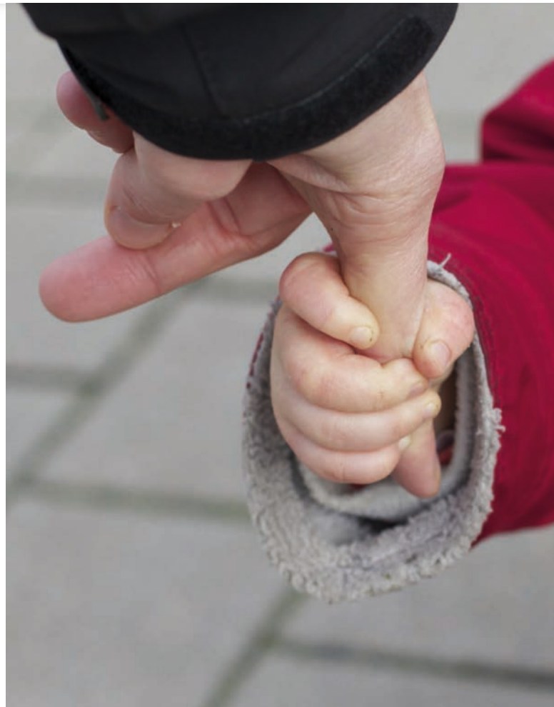
Děti potřebují zvláštní přístup [1]

Záleží zejména na chování osob, které jsou s dětmi ve styku. Zcela nevhodné je střídání těchto lidí, za nejlepší se považuje přidělení jednoho člověka po celou dobu řízení. Další aspekt představuje pohlaví spolupracující osoby. Děti tíhnou více k lidem stejného pohlaví, mladší pak k ženám. I na to je třeba myslet, ačkoliv u dospělých se to může zdát triviální.