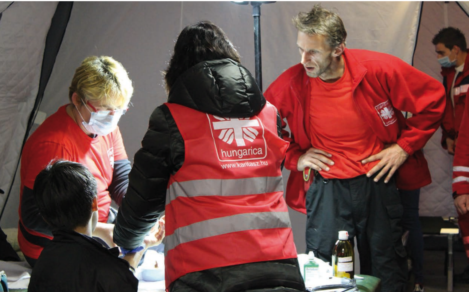
Zraněný uprchlík ošetřovaný lékaři – Livarna, Slovinsko [2]

dalšího vyloučit, že vzhledem k obzvláště závažnému zdravotnímu stavu žadatelky o azyl může její přemístění na základě nařízení Dublin III s sebou takové riziko nést.