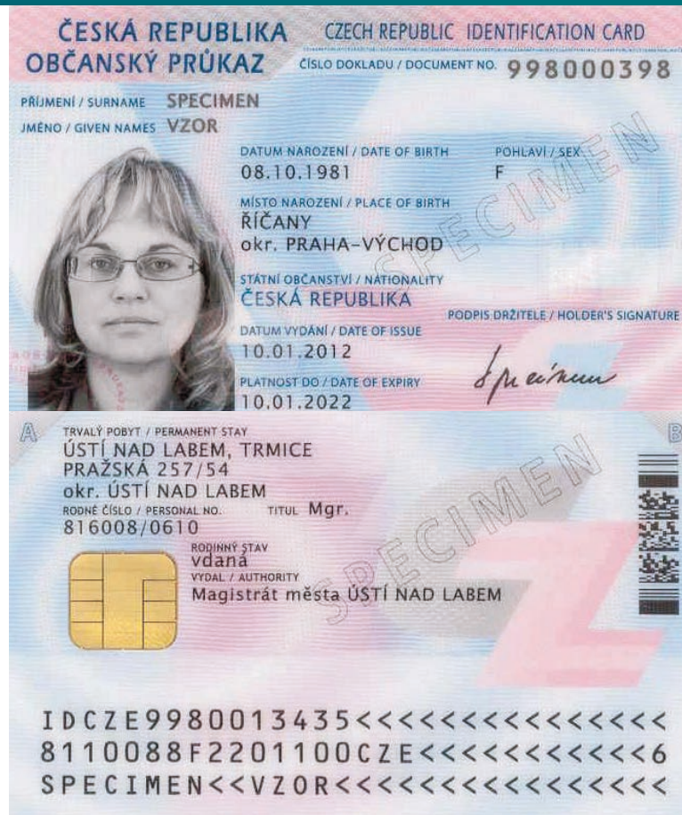
Občanský průkaz [1]

Uvedené závěry Nejvyššího správního soudu jsou vysoce relevantní pro diskuzi o ustanoveních § 22 odst. 3 a § 26 zákona č. 186/2013 Sb., o státním občanství, (ZOS), podle kterých lze na základě informací Policie České republiky nebo zpravodajských