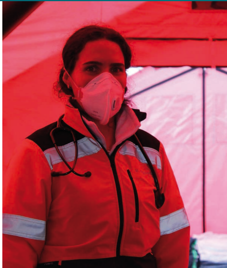
Slovinská lékařka v uprchlickém táboře [1]

Soud se ptá, zda za okolností, za nichž by přemístění žadatele o azyl, který je stížen obzvláště závažným duševním nebo fyzickým onemocněním, s sebou neslo skutečné a prokázané riziko vážného a nenapravitelného zhoršení zdravotního stavu dotyčné osoby, představuje toto přemístění nelidské a ponižující zacházení ve smyslu článku 4 Listiny základních práv Evropské unie (dále jen Listina EU).