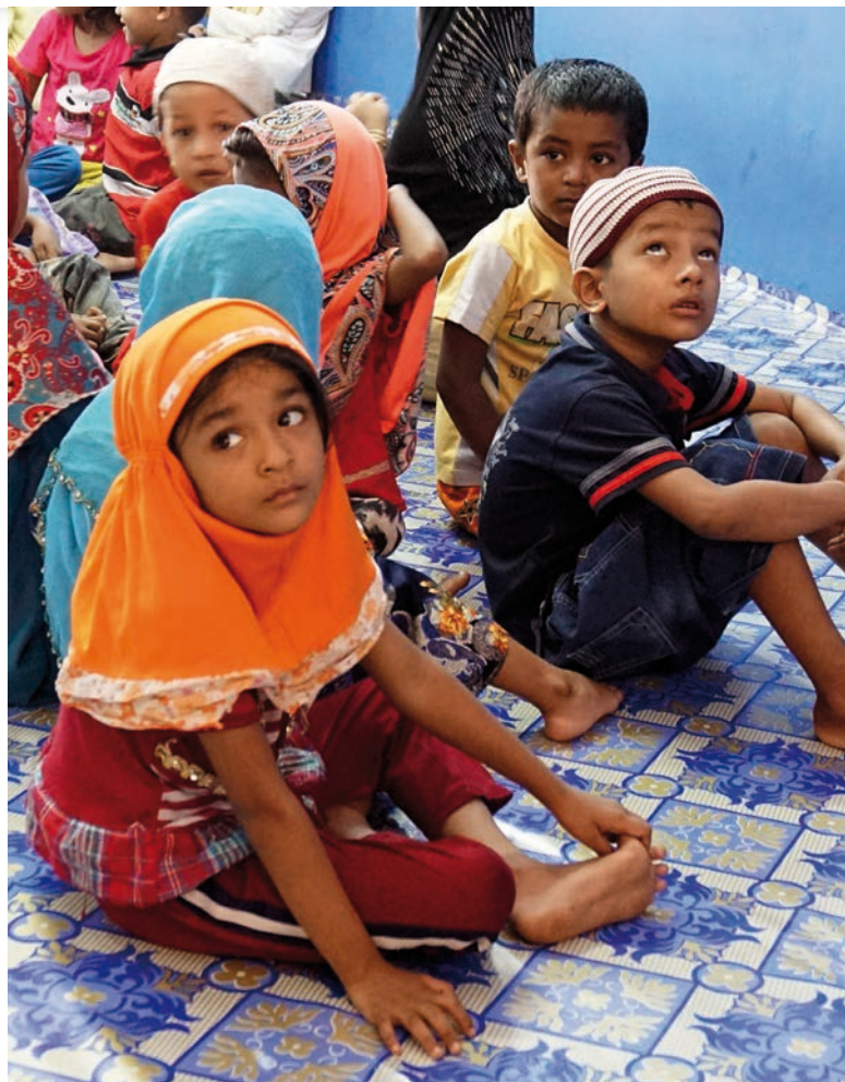
Děti z muslimské menšiny Rohingya [1]

Reakci Rohingya muslimů na přetrvávající násilí je útek do některé ze sousedních zemí. Zpravidla se jedná o Bangladéš. Tamní vláda však nejedná s uprchlíky vlídně a mnohdy je vrací zpět za hranice. Od roku 2014 uprchlo podle odhadů více než 125 000 osob. Ve většině zemí není uprchlíkům přiznána žádná forma ochrany nebo azylu. Stát jim neposkytuje lékařskou péči, vzdělání nebo adekvátní pracovní podmínky. Uprchlíci tak pracují nelegálně a nadále žijí v extrémní chudobě.