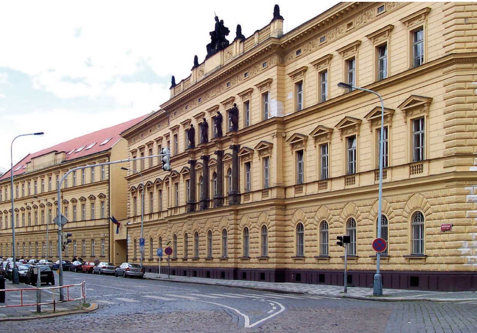
Ministerstvo spravedlnosti [2]

S ohledem například na kauzu (dnes již pravomocně odsouzeného) ústeckého soudce Berky se však nedá tvrdit, že by prosté spoléhání se na soudy mělo nekalým praktikám samo o sobě zabránit. Přesto se zdá, že by celkový dohled nad insolvenčními správci a nad agenturami zabývajícími se oddlužením, které často podle slov ministra působily „načerno“, měl být dramaticky zosťřen.