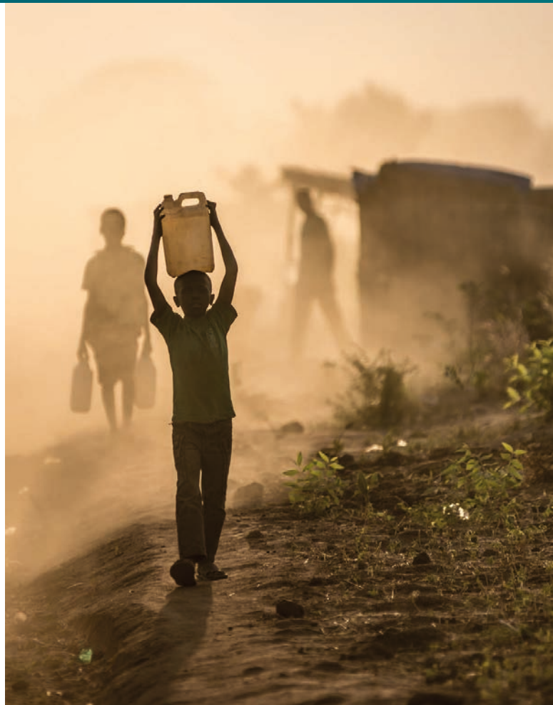
Chlapec nesoucí vodu v Bibibidi centru [1]

Narůstající počty uprchlíků právě v Ugandě přitom rozhodně nejsou náhodné. Uganda je totiž jednou z nejbezpečnějších zemí v regionu. Tamější vláda je navíc známá svým progresivním přístupem v oblasti migračních podmínek. Naprostá většina uprchlíků tedy proto směřuje přímo do Ugandy, někteří z nich se však, ve snaze vyhnout se ozbrojeným jihosúdánským silám, vydávají na dlouhou cestu přes Demokratickou republiku Kongo. Tato cesta zabere i několik dní a uprchlíci při ní trpí nejen nedostatkem pitné vody a jídla, ale rovněž strachem z divokých zvířat a z dopadení, či dokonce zabití ze strany vojáků a ozbrojených povstalců. Vzhledem k těmto okolnostem není tedy divu, že naprostá většina uprchlíků dorazí do azylových center ve velmi špatných fyzických a psychických podmínkách.