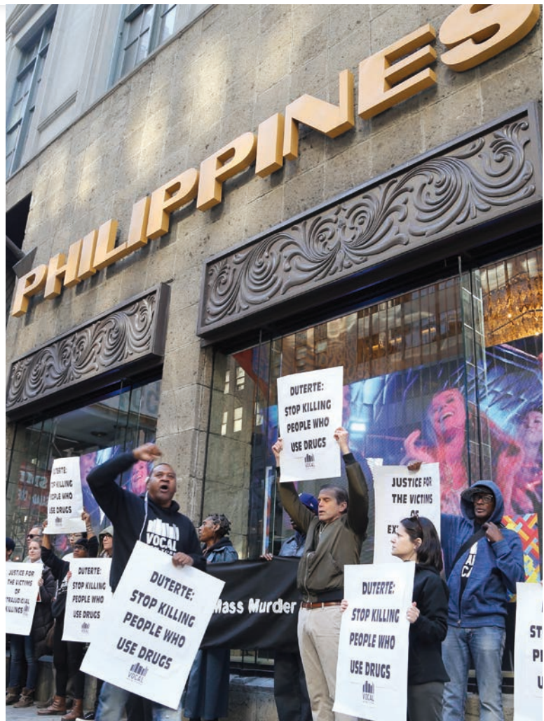
Protest proti protidrogovej politice Rodriga Duterteho [1]