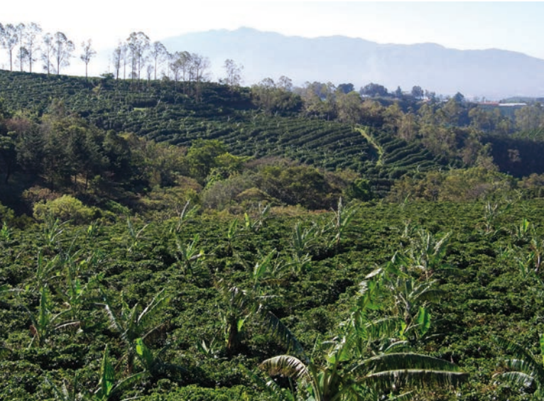
Kávová plantáž [2]

stejná studie, je toto skóre o 5 bodů nižší. Autoři se domnívají, že to může být způsobeno jednak stagnací v této oblasti ze strany firem nacházejících se v průmyslových zemích a jednak i faktem, že oproti minulé analýze byly tentokrát zkoumány rovněž rozvojové trhy, které mají zpravidla nižší regulační nároky, a požadavky občanských organizací v otázce lidských práv jsou zde více limitované.