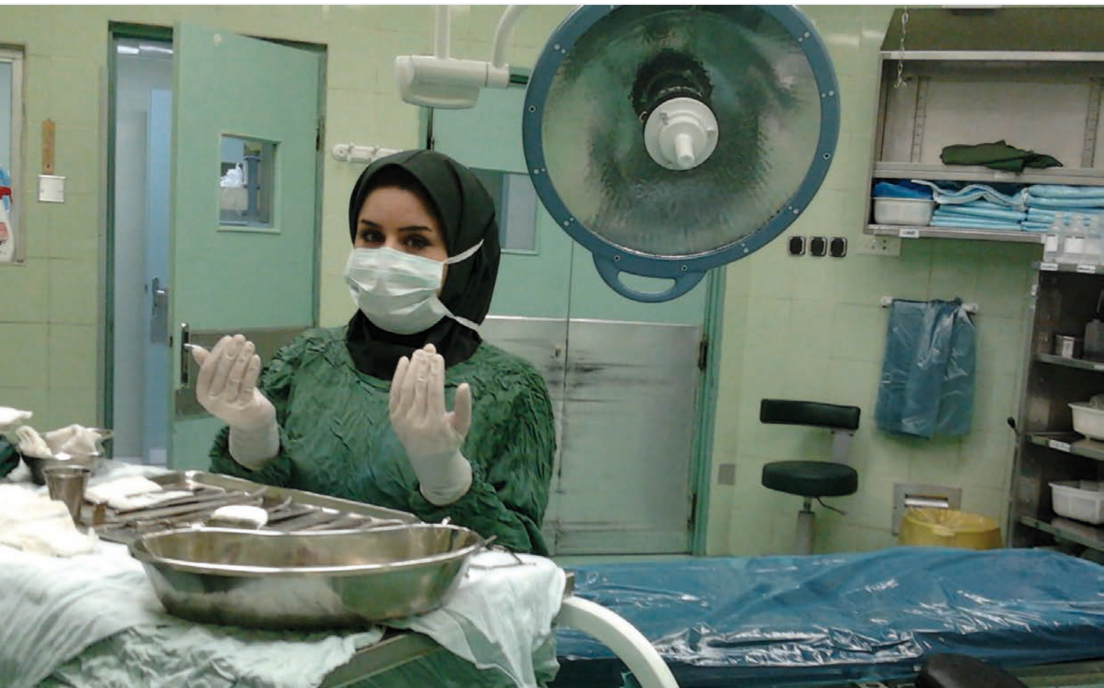
Íránská chirurgka pracující v hidžábu [4]

hodnutí tak jako tak vyvolala ve společnosti řadu komentářů a ohledně další judikatury nelze téma považovat za ukončené.