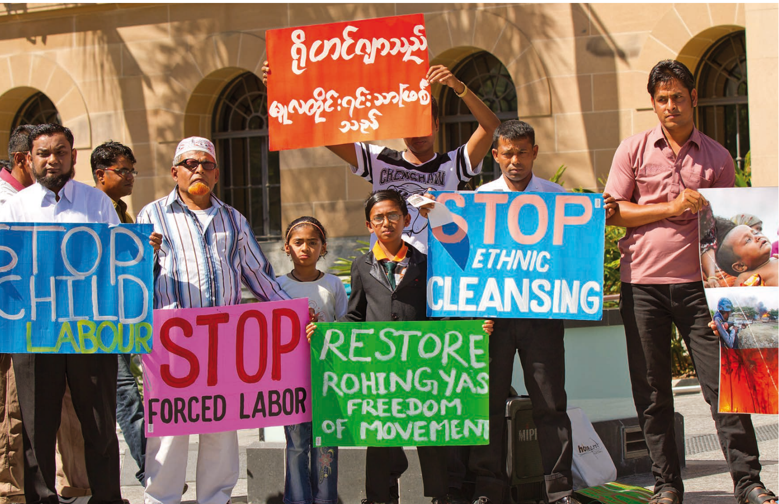
Protesty proti násilí páchanému na muslimech [2]

v zemi dochází k mimosoudním popravám, mizení osob, mučení a nelidskému zacházení, znásilňování a k dalším formám sexuálního násilí, svévolnému zatýkání a věznění, deportacím a nucenému přesunu v důsledku násilí a pronásledování.