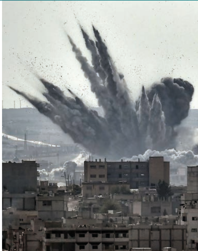
Syrské město Kobani během bombardování [1]

Mechanismus má dva hlavní cíle. Zaprvé shromažďovat, uspořádat, uchovávat a analyzovat důkazy o možných zločinech proti lidskosti či válečných zločinech na území Sýrie pro případ, že v budoucnu by trestní stíhání před mezinárodním soudem