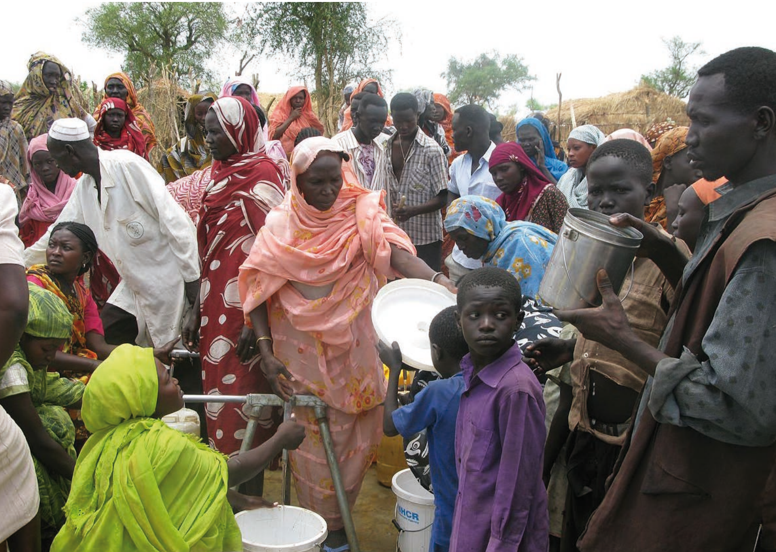
Uprchlíci v jihosúdánském táboře Jamam [2]

Uganda je bezesporu velmi dobrým příkladem regionální pomoci při uprchlické krizi. Je však zapotřebí, aby ve svém snažení eliminovat následky neštěstí, které postihlo Jižní Súdán, nezůstala osamocena. K tomu by měly pomoci nejen její sousední státy, nýbrž i mezinárodní společenství svým aktivním přístupem.